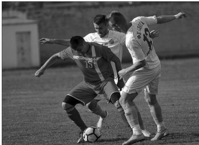
У Ковачима први почели са радом-детал са утакмице Радничког и Слоге из прошле сезоне