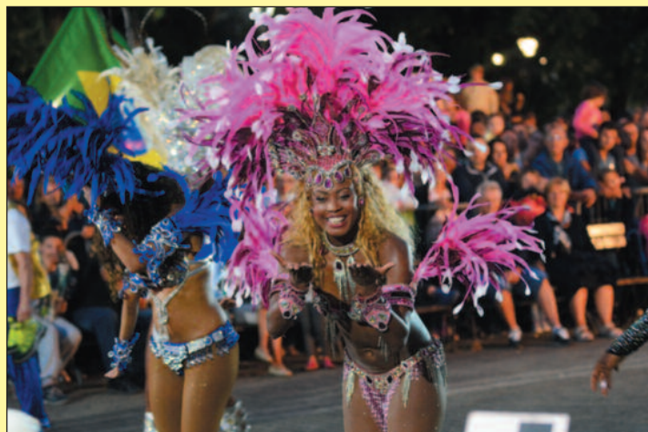
Бразилке својим наступом направе праву карневалску атмосферу

Карневал отварамо музичком манифестацијом "Једна песма, једна жеља", а већ у уторак 17.