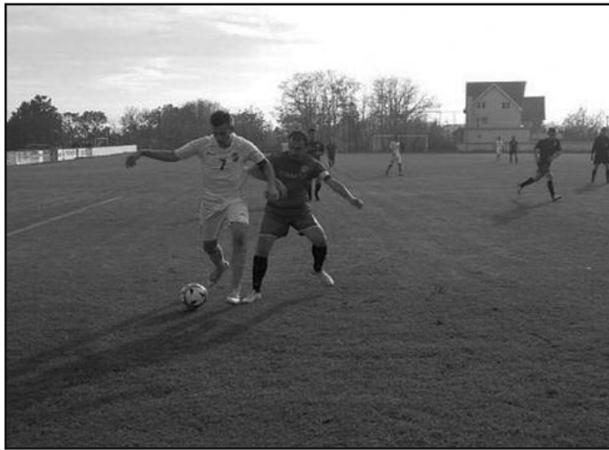
Чекајући решење нагомиланих проблема-детал са једне Слогине утакмице

Да ли је на помолу последњи покушај спасавања ФК Слога, оптерећеног огромним дуговањима или ће све остати само на речима? Све би требало да буде познато наредних дана, најкасније до краја јула. После друге уза стопне сезоне у зони "Морава", Слога се припрема и за трећу, али у новоформираној Шумадијско-Рашкој зони. Актуелно руководство, последње три године води тешку борбу да клуб опстане, да се не угаси, иако блокирани жиро рачун и огромна дуговања из прошлости прете да фудбаласки бренд града на Ибру пошаљу у историју. У међувремену, група краљевачких привредника има вољу и амбицију да спречи црни епилог и не жели сценарио какав се догодио годинама раније у Крагујевцу, Зрењанину, сада се најављује у Ужицу и слично.