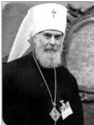
Митрополит Антоније Блум

Овде желим даначиним опаску и да кажем да је људима који су се родили у верујућој породици, који су васпитани у вери, људима који су увек били верујући и живели тиме, понекад теже да нађу у чему се састоји ова блага