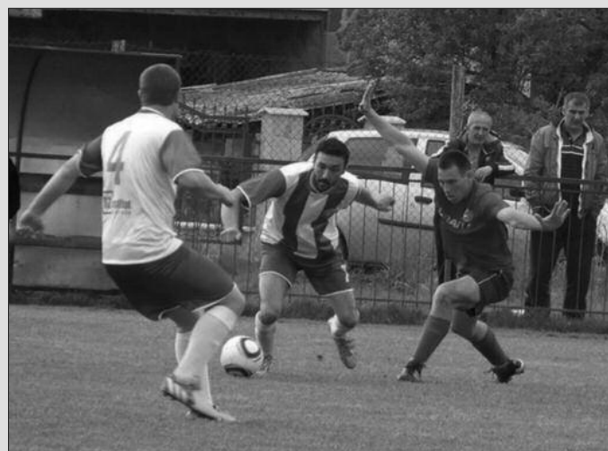
Детаљ са једне утакмице Карађорђа из Рибнице

- Увек стремимо да будемо у самом врху. Наш клуб нема српсколигашке амбиције, зна нам одговара, али не желимо да будемо у доњем делу. Јесењој полусезони увек поклањамо више пажње, преко лета сви играчи могу редовно да