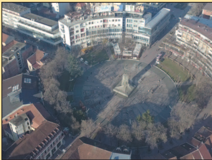
Радови на реконструкцији Трга српских ратника трајаће шездесет дана