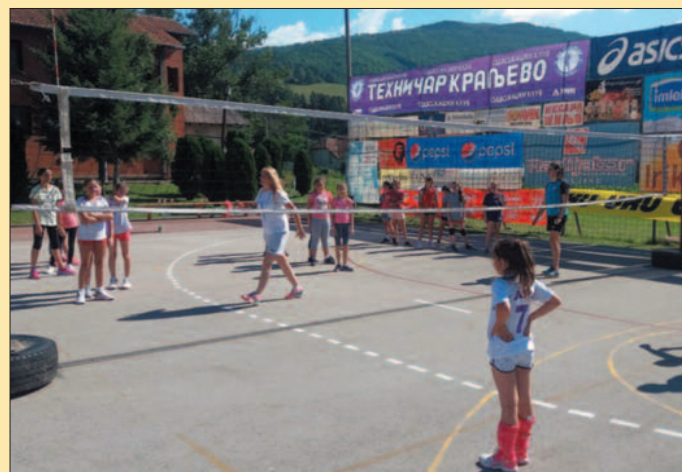
Тренинг најмлађих на кампу

Генерални спонзор кампа, компанија Треф Спорт и АСИКС