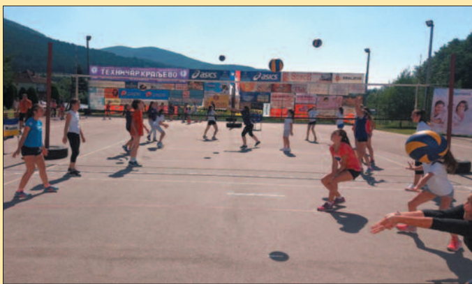
Вредан рад од првог дана-тренинг полазника прве смене