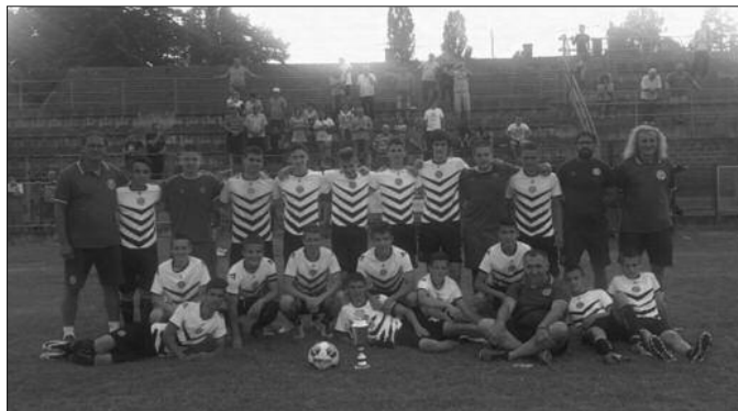
Прваци Западне Србије