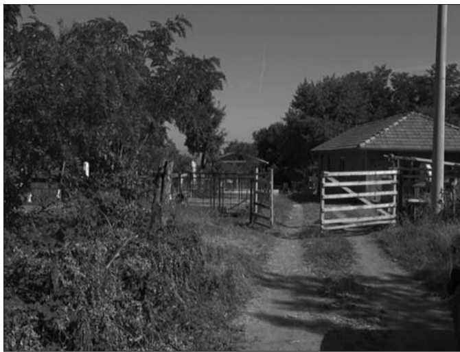
Могу ли мештани сами да нађу решење за спорни пут?

И нови пут који пролази тик уз гробље појединци су блоки-