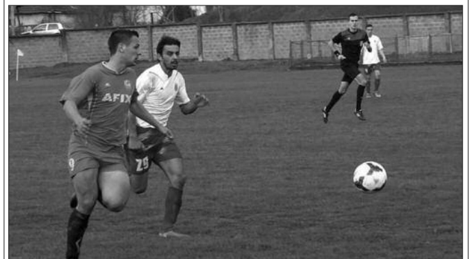
Детаљ са утакмице МФЛ Краљево на стадиону код Ложионице

Претходног викенда одигране су утакмице 28. кола Међуопштинске фудбалске лиге Краљево. Лидер из Витановца је успео да победи у Адранима, а како је Ласта одиграла без голова у Грдици, Гружа је на корак од уласка у Окружну лигу. Реми екипе из Витковца искористило је Напредак из Грачаца и победом против Ласца стигао до позиције која такође значи улазак у виши ранг. Последња два кола ће бити веома бурна у овом рангу такмичења. Комшијски дерби у Метикошима припао је гостима из Драгосињаца, док су „малинари“ у Врдилима поразили госте са Рудна. „хајдуци“ су били убедљиви против Партизана из Врбе, а гол више је виђен на утакмици код Ложионице где је Металац очеки-