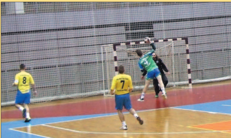
Сезона завршена пировом победом-детал са утакмице рукометаша Металца

Металац је јесењу полусезону окончао са свих 11 победа, али на пролеће то више није био исти тим. У прва четири кола Металац је изгубио два пута, од чега је неуспех од чачанске Мадости у Краљеву био кључан да се лидерска позиција препусти екипи из Пријепоља. Шта се током зиме дешавало у РК Металац, зашто се екипа преполовила, деловала безидејно, све су то питања која траже одговоре од челника клуба из Доситејевог улице. Како било, Металац и Слога ће и наредне сезоне играти