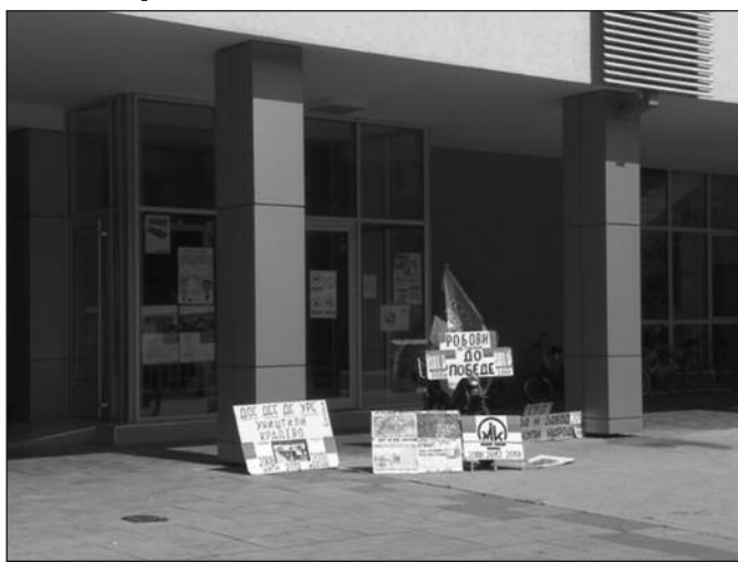
Бивши радници „Магнохрома“ истрајавају у својим захтевима

Тринаест опозиционих странака које протестују и траже