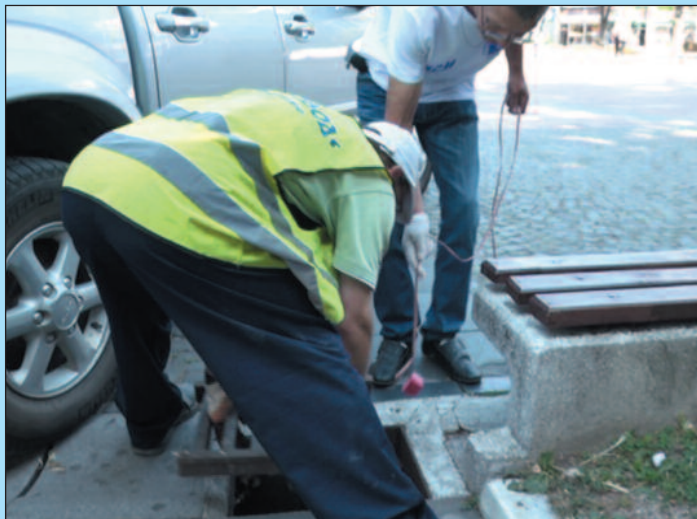
Мамци се постављају у канализацију, топловоде, парковске површине

Дератизација ће се спроводити континуирано до новембра. У првој фази постављају се мамци у канализацијама, топловодима, парковским површинама, приобаљима река,