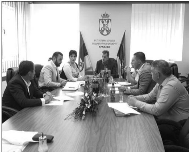
Нови систем у Краљеву за годину дана

Велика уштеда средстава је већ сама по себи довољан мотив, јер би тај новац могао да се искористи за друге намене. Такође, само електронско вођење скупштине било би знатно једноставније и функционал-