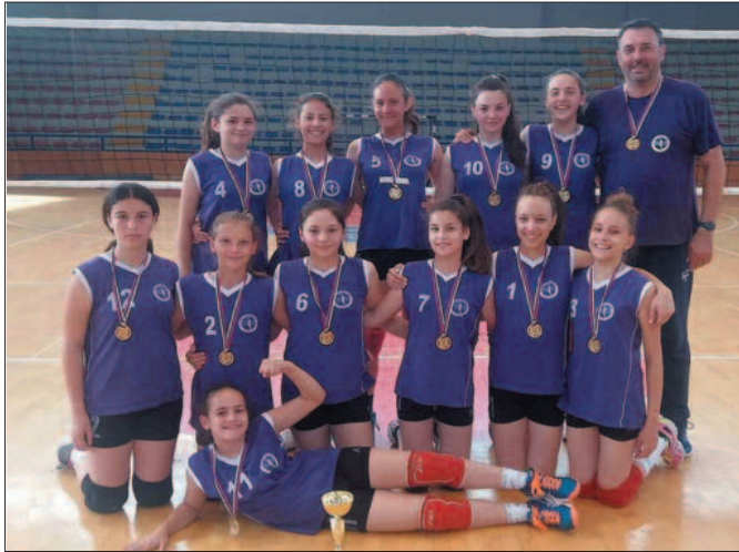
Предпионирке Техничара праве шампионке

Много тога нам се догодило пред овај завршни турнир. Због Лиге нација нисмо тренирали седам дана, пред сам полазак нам није дошао уговорен превоз, кренули смо са сат времена закашњења и стигли у последњем тренутку. Ипак, сви пехови су остали по страни, када је почела игра, показао се