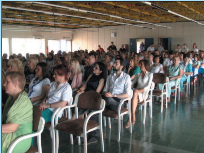
Награда као потврда да сестре свој посао раде баш како треба

-И ове године традиционално делимо награде најбољим тимовима и најбољој сестри, појединцу. Заиста је било јако тешко одабрати најбоље овога пута, међу толико добрих људи и запослених у здравству у Краљеву. Постоје наравно критеријуми којих се наше Удружење медицинских сестара и техничара држи, али морам да истакнем да су први пут ове године награду добиле службе чији радници нису чланови Удружења, али су се својим радом наметнули и истакли. То су тимови које је коле-