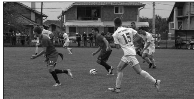
Детаљ са утакмице Карађорђе и ЛФК Младост

вредног три бода, а број прилика говори да су гости апсолутно заслужили победу у овом сусрету. Карађорђе у наредном колу гостује отписаном Овчару и то је можда прилика да се прекине поражавајући низ.