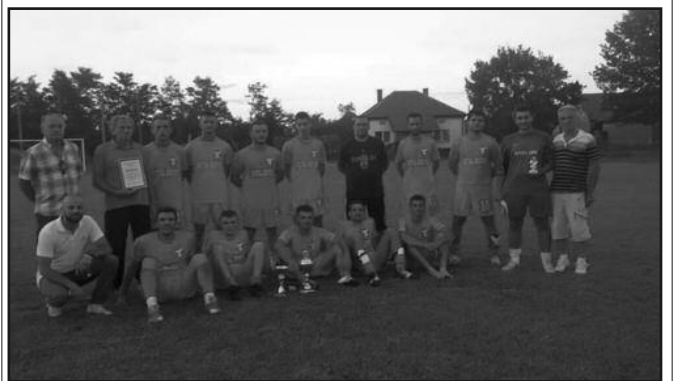
Једном ногом у МОЛ Краљево-ФК Јово Курсула из Цветака

У групи „Морава“, претходног викенда одигране су утакмице 15. кола. Највеће изненађење се догодило у Чукујевцу где је „фењераш“ из Опалнића одиграо без голова и тако омогућио екипи из Цветака да се усамом на лидерској позицији. Јово Курсула није пропустио такву шансу, победио је једном ногом загазио у виши степен такмичења. Врџци су победили „чаршијанце“ после велике борбе, док је у Шумарицама виђено шест голова и подела бо-