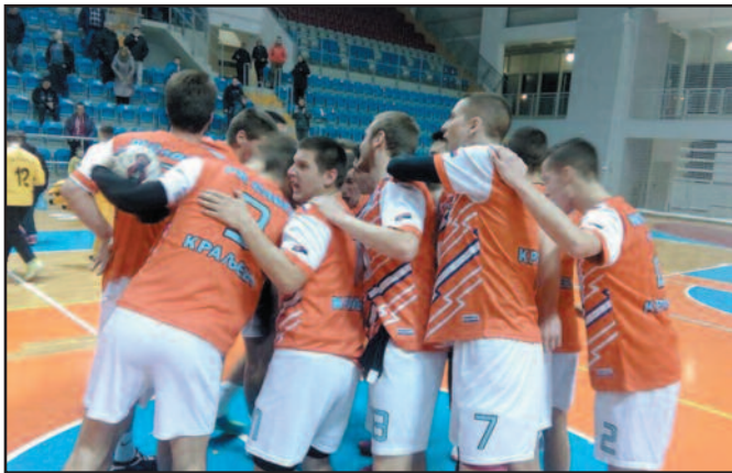
Рукометаши краљевачке Слоге

Утакмицама 20. кола претходног викенда настављено је првенство Прве лиге група „Запад“ за рукометашице. Екипа Слоге је у Краљеву убедљиво поражена од Прве Петолетке из Трстеника резултатом 29-48 (14-25), док је краљевачки Металац у овом колу био слободан. Млађи краљевачки прволигаш угостио је кошшије из Трстеника које су крај Ибра дошле са само осам играча. То их није спрело да победе убедљиво и до врха напуне мрежу Слоге. До 15. минута меч је био изједначен, а тада је П. Петолетка убацила у већи пренос, кренула је серија гостију и већ тада је било јасно да ће пред екипом из Трстеника пасти и други прволигаш из града на Ибру. До краја меч се само постављало питање колика ће бити конална разлика у корист гостију. Упркос ово неуспеху, Слога нема разлога за бригу, најмлађа екипа у лиги се котира у средини табеле и статус прволигаша јој није угоржен.