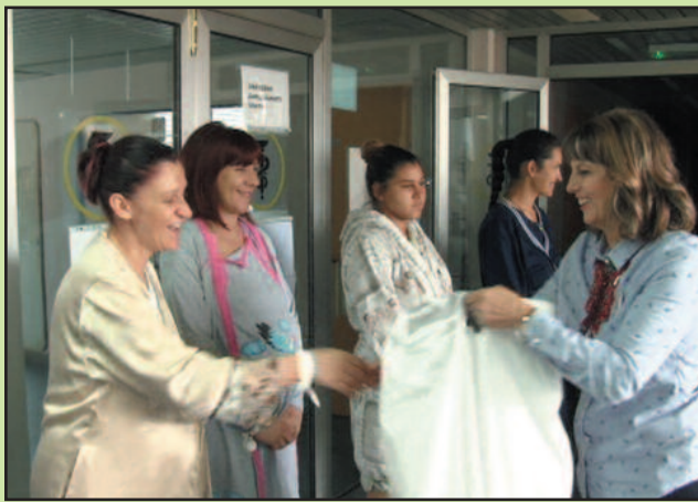
Некада се делило 30, а сада једва 20 пакета

Посета представника Црвеног крста породилишту у „Недељи Црвеног крста“ која се обележава од 8. до 15. маја је традиционална акција. У првој посети породилишту од планиране две током Недеље Црвеног крста, подељено је 10 пакета који садрже најнеопходније ствари за бебе током првих дана њиховог доласка на свет.