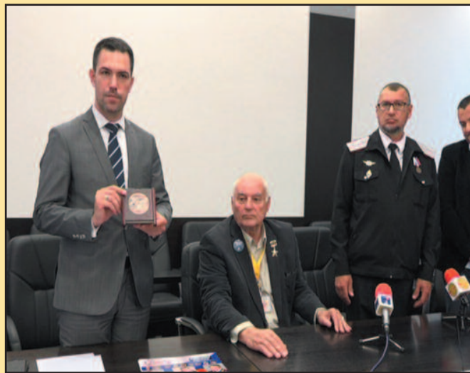
Градоначелнику признање за успешну организацију Бесмртног пука у Краљеву

-Неких десетак година уназад, када су први пут из Друштва српско-руског пријатељства организовали обележавање 9.маја, било је свега пет људи, а онда 9.маја ове године на улицама града Краљева прошетало је око 1000 људи. То је показатељ да је наша дружина и пријатељство наша два народа на добром