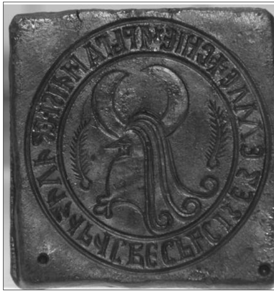
Типар кнеза Лазара

убрзо постао једно од најпознатијих рударских и трговачких средишта српске државе, а пун процват доживео је током XIV и прве половине XV века. Под топонимом Рудник у средњовековним изворима подразумевају се и планина и рударско место, посебно насеље и трг, али и читав регион, који је обухватао копове и места за прераду руде, као и друга насеља рудара и трговаца. Поред писаних извора, о значају тог подручја у средњем веку сведоче и бројни материјални остаци на терену. Мада је интерес за њихово проучавање постојао од средине XIX stoleћа, уз чињеницу да су још 1865. године ту обављена прва организована ископавања, археологија се прилично касно укључила у истраживања Рудника. Тек су истраживања из осамдесетих година прошлог века допринела томе да сазнања о средњовековном Руднику, раније заснована искључиво на писаним изворима, буду употпуњена и археолошким подацима. Многа питања, међутим, остала су неразјашњена, између осталих и питање положаја главног насеља и средњовековног трга. С намером да се потражи одговор управо на то питање, на Руднику су, након