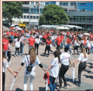
И ове године „Моравац“ на крају

Данас (18. маја), тачно у подне, око 900 из девет краљевачких средњих школа, са Трговице, из Краљева, Крајинице, Ратника послаће најлепшу слику разиграног свет, али и поруку мира и пријатељства.