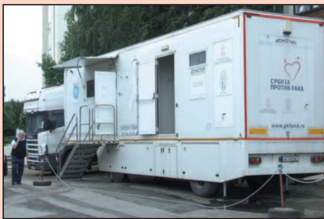
Покретни мамограф стационаран испред улаза у Поликлинику

Лекари кажу да је најефикаснија превенција, а то значи преглед који треба редовно обављати већ од двадесете године, јер од ове врсте рака могу да оболе и жене које не спадају у ризичне групе. Како је овај покретни мамограф пре неколико година био у Краљеву, а потом по осталим градовима у Србији, наш град је поново дошао на ред, јер мамограф у Краљеву не ради већ годину дана а списак листе чекања је све дужи. Жене старости од од 50 до 69 година које у последње две године нису урадиле мамографски преглед пожељно је да сада закажу преглед. За жене од