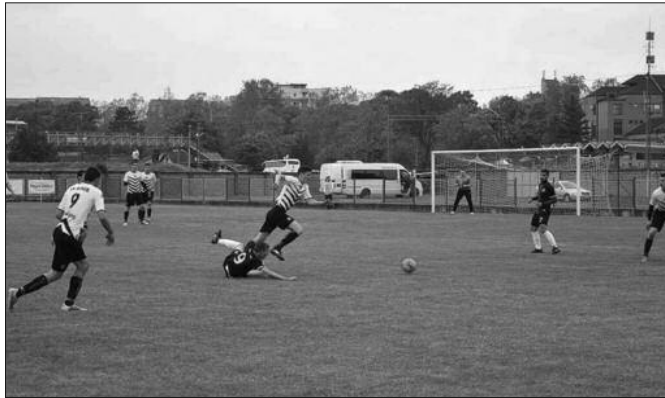
Победа у Крагујевцу за опстанак - детаљ са утакмице кадета Кикера

Кикер је тренутно на 13. позицији на табели са 33 бода, колико има и суботички Спартак на 12. месту које гарантује опстанак. Угрожени су још ОФК Београд са 34, те Нови Пазар и Телеоптик са 36 бодова. Краљевачки