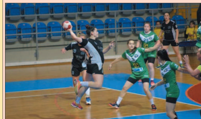
Детаљ са утакмице рукометашица Металца