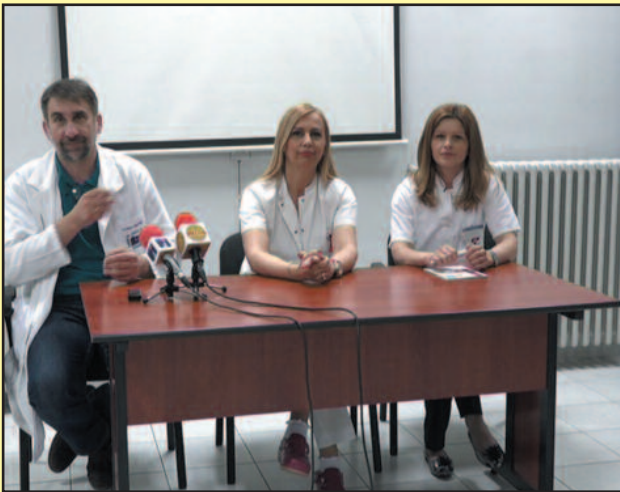
Тренд невакцинисања деце знатно је опао у односу на прошлу годину

Како се обележава Европска недеља имунизације генерално,