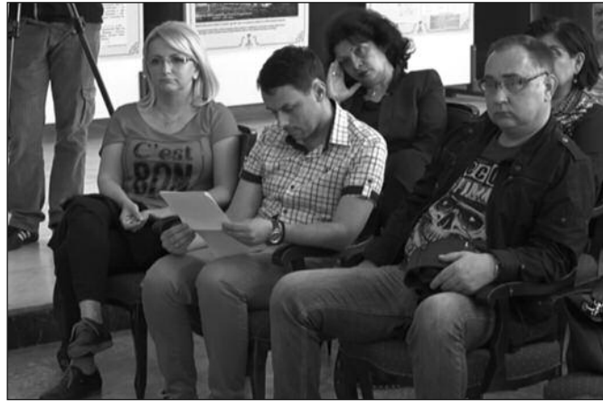
На трибини говорили и људи који су добили шансу за нови живот

Три године сам боловао од болести срца, преживео два инфаркта, имао стентове и онда је ми се срце ослабило на свега 12 одсто након чега сам стављен на листу за трансплантацију. После месец дана сам имао