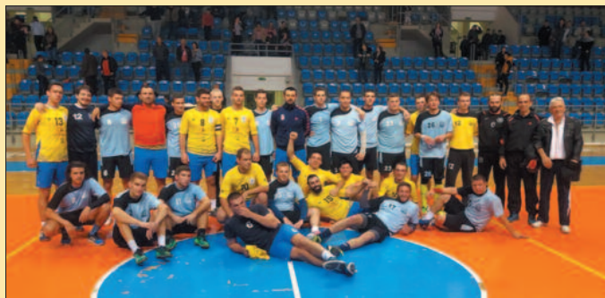
У недељу сви на дерби-заједнички снимак рукометаша Металца и Слоге после јесењег дербија

У првенству Прве лиге група „Запад“ за рукометаше претходног викенда одигране су утакмице 17. кола. Краљевачки Металац је као домаћин био бољи од крушевачког Напретка резултатом 34-28 (17-13). Гости су опхрани унутрашњим проблемима у Краљево дошли са само осам играча, а Металац је узвратио са девет момака спремних за утакмицу. Неозбиљно од екипе која рефлектује да се домогне Супер „Б“ лиге, али против анемичног госта довољно за сигуран тријумф. Већ после 11 минута игра Металац је водио 6-0, тек тада су гости постигли први гол, али су у пар наврата долазили на три гола заостатка. У другомк полувремену, у 36. минуту било је