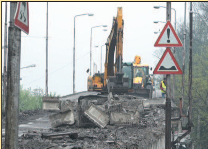
Комплетна средства за реконструкцију обезбеђује ЈП „Путеви Србије“

Комплетна реконструкција надвожњака врши се из средстава Републике Србије односно средства ЈП „Путеви Србије“.