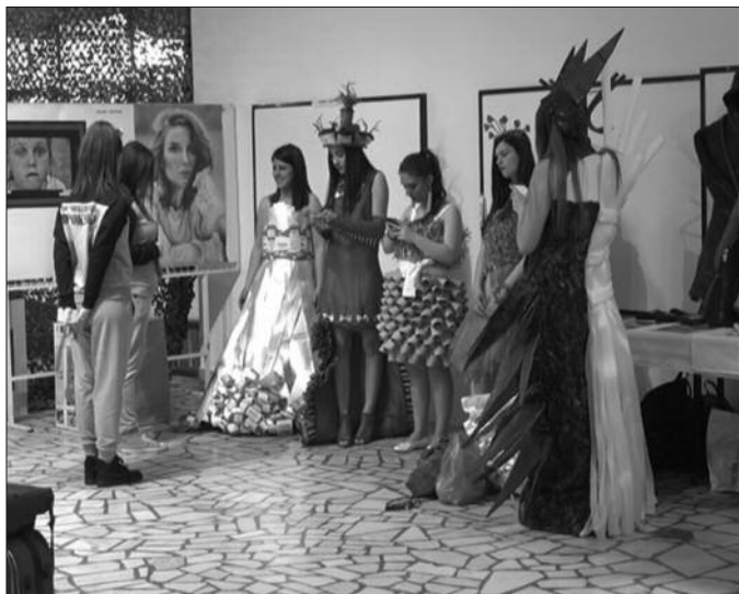
Ученици су се такмичили у више културно-уметничких категорија