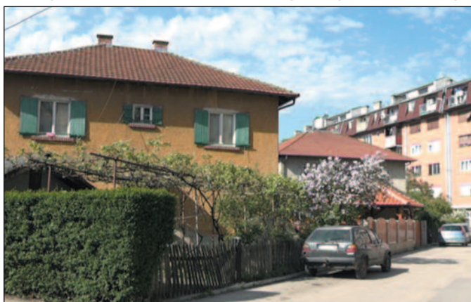
Насеље изграђено за раднике који су долазили са стране

-На територији које је Аустроугарска држала а где су спадале и Словенија, Хрватска, БИХ и део Војводине било је четири железничке радионице у којима су они поправљали вагона. И због тога је та стручна радна снага нама долазила из Марибора, Славонског Брода, Сарајева и из