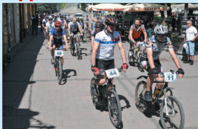
Старт трке првог меморијала Радош Чубрић у центру Краљева

– Служило нас је време, одзив такмичара је био одличан, а план је да овај меморијал буде у календару БСС и да у наредним година буде преко 100 возача на меморијалу. Возили смо предивним крајоликом, један број рекреативаца је раније завршио трку, очекивано, док су остали издражли до краја и сви су одушевљени организацијом и доживљеним