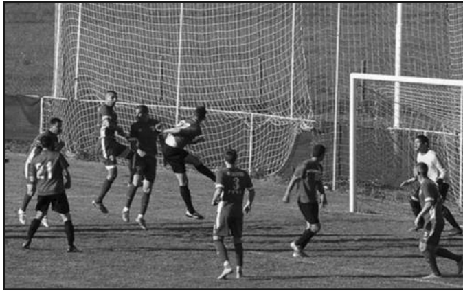
Детаљ са утакмице Раднички-Драгачево