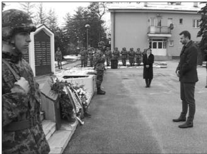
Ова јединица води рачуна о својим страдалим припадницима

цембра, за Дан војних ветерана, обезбедио се континуитет са ветеранима из времена 1912.године, када је Краљевина Србија, као модерна држава у рату ангажовала своје становништво и све материјалне и финансијске резерве уз стварање Балканског савеза са својим суседима. А одавањем почаст погинулима у ратовима између 1990.и 1999.године, чувамо њихову жртву од заборава.