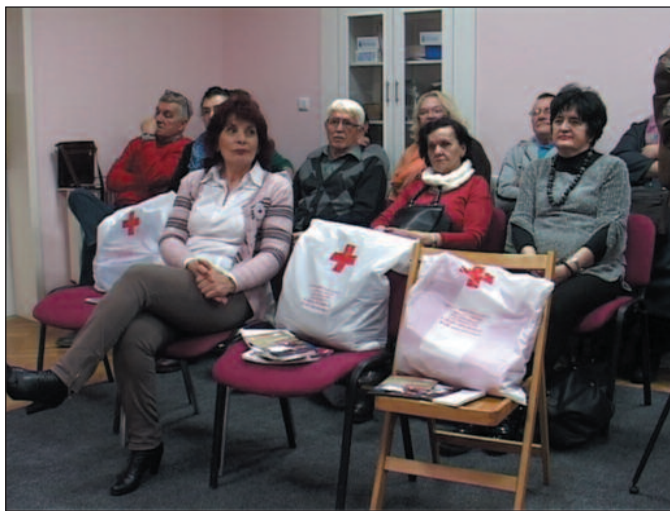
Старији волонтери младима преносе знање и искуство

- Сви наши волонтери, можемо слободно рећи, нису лаици. Они су едуковани од професионалаца који раде у Црвеном крсту како би помогли не само у ванредним ситуацијама, већ су то добровољци који нама помажу и током целе године у реализацији наших програмских активности. Међу волонтерима Црвеног крста има