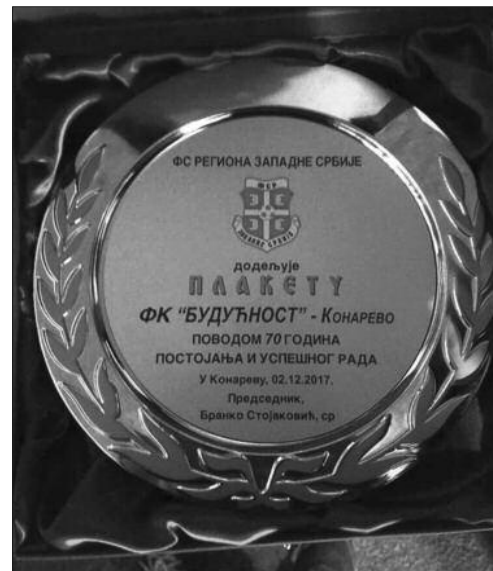
Златна плакета ФСРЗС за ФК Будућност Конарево