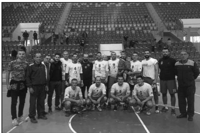
РК Металац првак јесење полусезоне у Првој лиги

Нова спортска дворана Гледалаца: 100 Судије: Пешић (Крагујевац), Стојковић (Лапово) Искључења: Металац 14 минута,