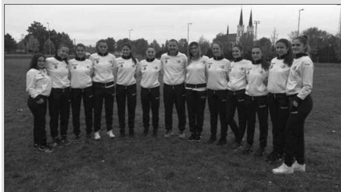
Следе утакмице за опстанак-одбојкашице Гимназијалца са тренером Пљакићем

У 8. колу Прве лиге Србије за одбојкашице, које је на програму било претходног викенда, Гимназијалац је у Краљеву поражен од новосадског ФОК-а максималним резултатом 0-3 (14-25, 20-25, 17-25). Млада екипа из Краљева се намерила на веома озбиљан тим, екипу која не зна за неуспех у првенству и која је и пред краљевачком публиком демонстрирала висок ниво игре и квалитета.