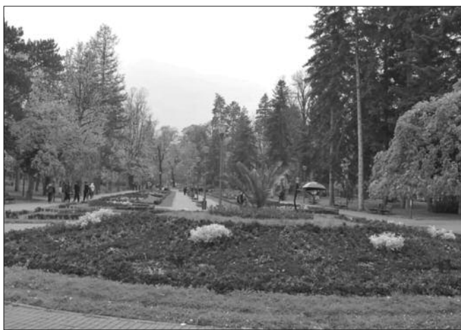
Паркови су заштитни знак Врњачке Бање

О парковским површинама одувек су бринули врхунски баштовани. Данас општина уређује парковске површине па су пре две године поставили 70 клупа и 30 савремених канти за смеће. Све је подређено туристу и уживању у природи и миру. Шетња између дрвореда од 900 липа дужине 1,5 километара може туристу изместити ван свакодневнице, а бања се може подичити и великим бројем четинара и столетних храстова. Колико је само знаменитих личности шетало централним парком који се налази уз Врњачку реку. У централном град-