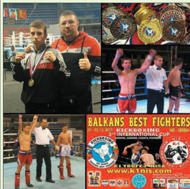
Млади Краљевчанин у финалу нокаутао противника