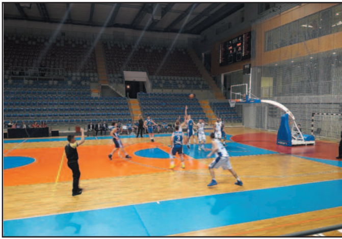
Детаљ са утакмице Слоге и Дунава