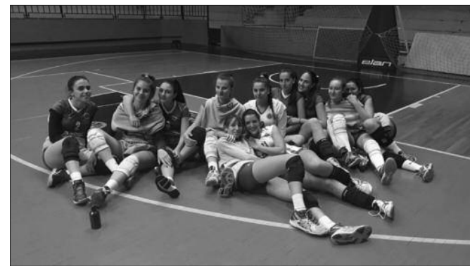
На домак трона-одбојкашице Техничара из Краљева