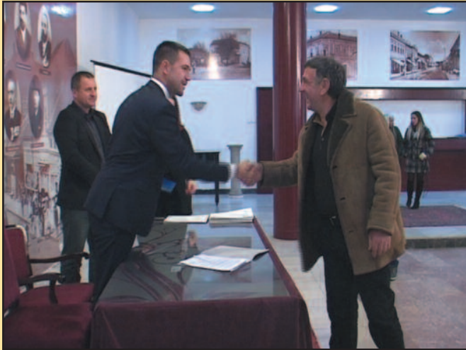
Ове године за средства је конкурисало осам нових домаћинстава

-Мислим да је овај потез града Краљева веома добар. Дамо побољшали инфраструктуру у селу, да смо увећали број кревета у сеоским домаћинствима. Надам се да ћемо наставком улагања у сеоску инфраструктуру, у изградњу пансиона, побољшање услова живота и услова за пријем туриста и да живот у овим селима учинимо бољим. Оно што је посебно значајно јесте да од 18 домаћинстава која су добила средства ове године, осам је од ових домаћинстава, који прошле године нису добили средства. Ове године су се одлучили за сеоски туризам и средства су добили,