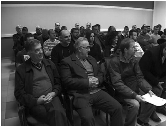
Да од узајамне сарадње користи имају и привредници и студенти

–Сматрамо да привредници нису довољно упознати са свим оним активностима којима се ми бавимо и шта смо све реализовали од пројеката. Сматрали смо да та сарадња може да буде још боља. На овај начин желели смо да представимо своје резултате и шта смо радили последњих година, а да је интересантно за привреду. Уједно желимо да подстакнемо и двосмерну сарадњу и видимо на који начин би они нама могли да понуде и помогну. Ту мислим конкретно на слање студената на праксу, затим израду дипломских и мастер радова, да то буду ипак неки применљиви резултати. Битно је и да наши студенти раде