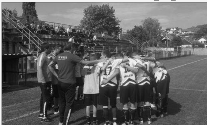
Јесен добра пролеће још боље-фудбалери и стручни штаб Кикера

Упркос неуспеху, Кикер је имао добру јесен, сакупио је