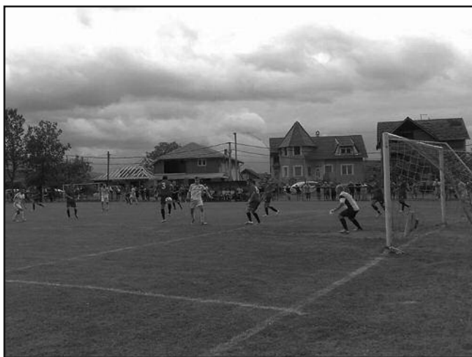
Подела бодова на брду-детал са утакмице Карађорђа у Рибници

-Тврда, типична првенствена утакмица, на тешком терену. Јошаница је, поготово у другом полувермену, била бољи тим и