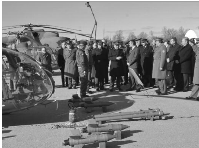
На Дан бригаде забележена највећа исправност борбене технике

уткана је у сваку нашу јединицу. Никада српска војска није учинила ништа због чега би се стидели. Храбра, поносна, об-