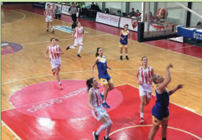
Залет за Звезду-детал са прошлосезонског дуела црвено-белих и Краљева