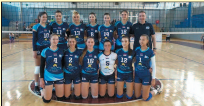
Добра игра за бод из Уба-одбојкашице Гимназијалца