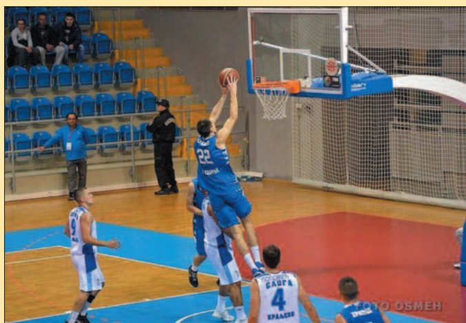
Сладоје закуцава за победу Спартак у Краљеву

Не знамо шта су тренери рекли својим пуленима током одмора, тек Слога у трећој деоници није постојала. Суботичани су радили шта су хтели,