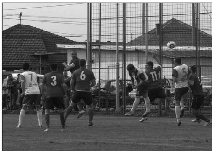
Победа у смирај меча-детал са утакмице Карађорђа у Рибници

-Више пута сам рекао да смо и претходне утакмице играли добро, али неискуство је највише утицало да губимо бодове. Сада су се коцкице склопиле, одиграли смо одлично, момци су све време били фокусирани, није мањкала реали-