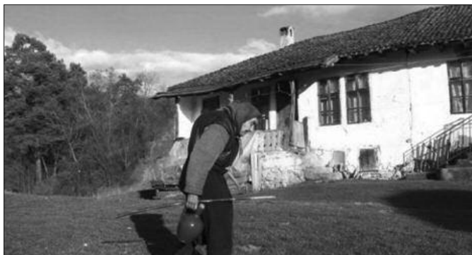
Српско село је највећа позорница личних трагедија

О томе како и зашто умире село може да се пише са више аспеката, са безброј емоција, са безброј анализа, са безброј протеста, са огорчењем, са клетвом и псовком, са проклетством власти и историје. Са нестанком села полако нестаје и Србија. То нико не жели да види, а онај ко види не жели или не може да помогне. Трагедија српског села је трагедија српског народа. Ми смо остали без сопствене земље. Стално гледамо шта ће други да нам каже, стално гледамо шта други ради, и силну снагу потрошисмо доказујући једни другима како су они први били гори, како су то све њихове грешке. Од силних речи и буке, коју сами правимо, не чујемо једни друге. Наша је памет најпаметнија, ми знамо све најбоље, народ је једна стока грдна која нити шта зна, нити шта доброг заслужује, нити га треба питати за били шта. Он је смо терет државе.