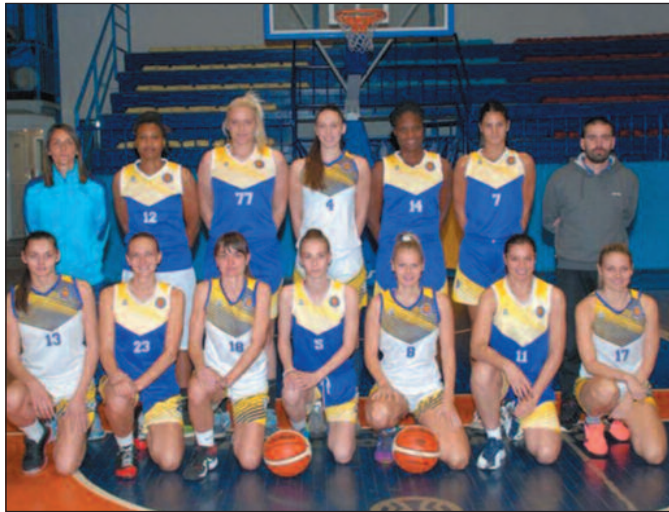
Све боље игре у ЖКЛС-ЖКК Краљево