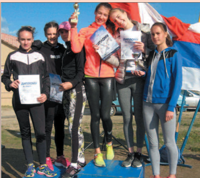
На подијуму крос првенства у Бору-атлетичарке Краљева