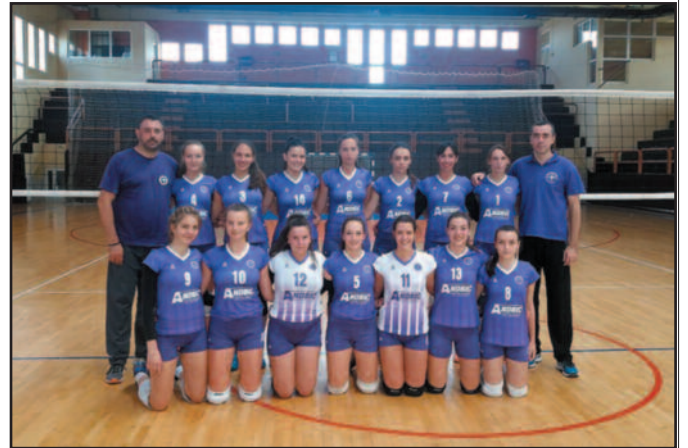
Лидер друголигашког Запада-одбојкашице Техничара