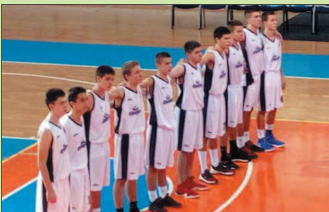
Кадети КК Полет Ратина

Млада екипа из Ратине заузима седмо место на табели, а у наредном колу дочекује новосадску Војводину.