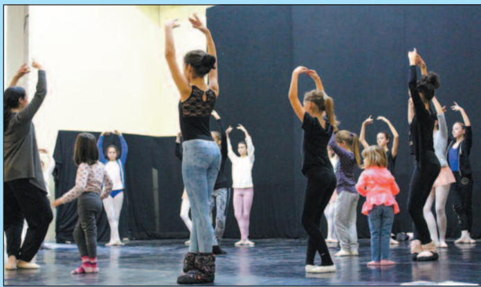
Многобројни малишани присуствовали отвореном часу балета

такла да је част што се наш град нашао међу 15 градова у Србији у којима се одржава „Караван игре“, као и да је организовање једне овакве манифестације доказ да се култура не централизује већ се даје могућност и локалним самоуправама да својим грађанима омогуће да присуствују разноврсним програмима.