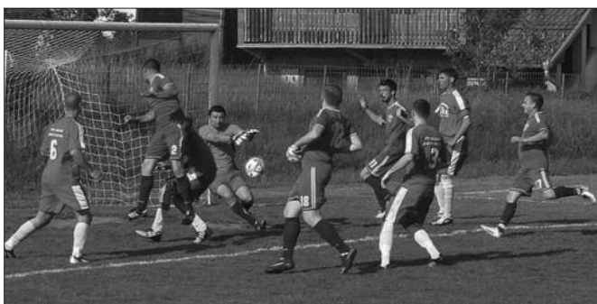
Гужва пред голом-детал са једне утакмице Међуопштинске фудбалске лиге Краљево

РЕЗУЛТАТИ 12. кола: Грдица-Јединство (Г) 2-2, Млада Крила-Ласта 2-1, Младост (В)-Јединство (Д) 6-2, Тавник-Ласта 2-2, Напредак-Гружа 5-4, Борац (А)-Магнохром 6-1, Металац-Партизан 1-1 и Краљево