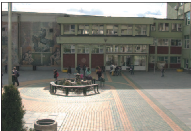
У школи кажу да до сада нису имали овакав случај вршњачког насиља

Агресивни ученик има дугу историју проблема са понашањем у школи. Пребивање из школе у школу није уродило плодом.