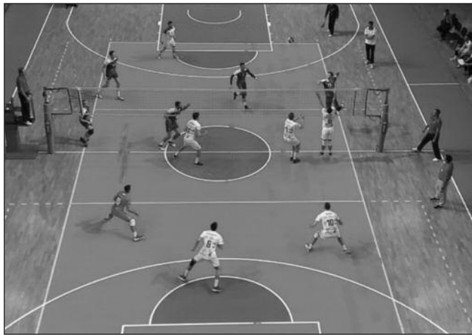
Детаљ са утакмице Рибница-Млади Радник

-Веома смо напорно радили целе недеље са жељом да после очајног издања у Старој Пазови