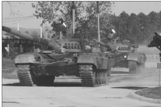
Припадници Друге бригаде показали висок степен обучености

-Сви припадници наше војске подједнако су вредни, подједнако су значајни, али и наши оклопници су пронели славу свог позива и славу овог народа где год су били. А били су тамо где је њиховом народу требало, где је било тешко, где је требало бити храбар. Војска Србије је поштована и вољена институција у нашем народу. Војска Србије је оно што наш народ чини сигурним и поузданим. Наша политика војне неутралности је могућа захваљујући томе што је војска Србије овако