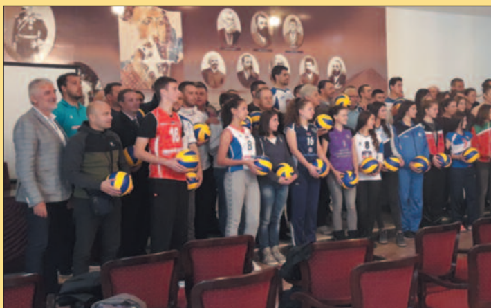
Сваком клубу додељено је по пет микаса лопти