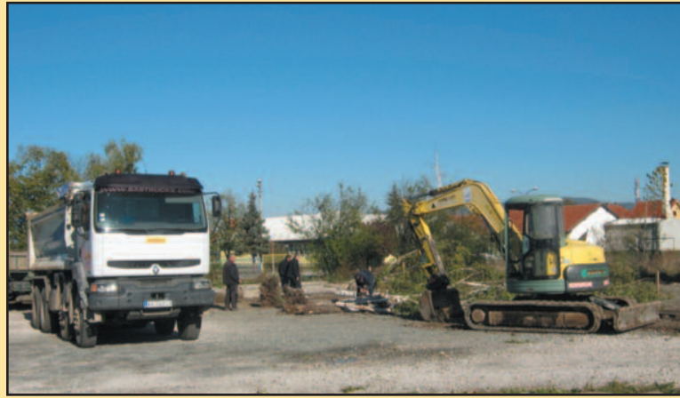
План је да се до Нове године зграда стави под кров