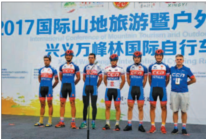
БК Металац на трци у Кини

-Ово је велики успех за све нас и Јелену наравно, што је успела да на себе скрене пажњу и добије