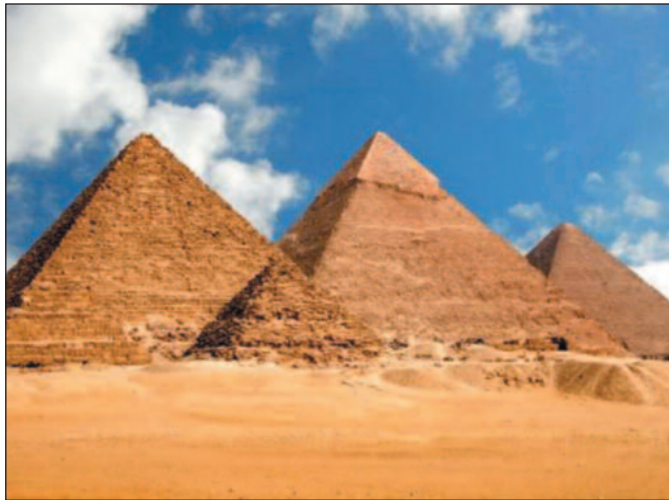
На једној од пирамида пише ћирилицом „Арсо“

У светској научној јавности је општеприхваћено да је латиница, која се код нас сада употребљава, хрватска. Сада имамо ситуацију да је већина натписа на објектима написана латиничним писмом уз огромну упо-