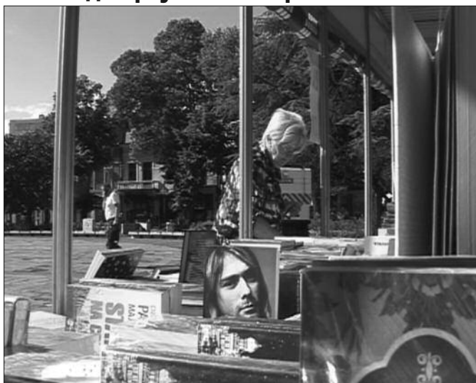
За мале паре свако може обогатити душу