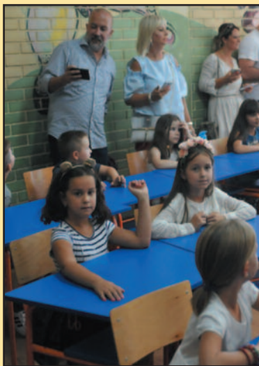
Ко не достави потврду губи право на дечји додаток

У случају да ове, унапред утврђене обавезе корисника дечјег додатка не буду испу-