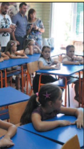
Право на дечји додаток

Градске управе Краљева да до краја октобра до краја октобра