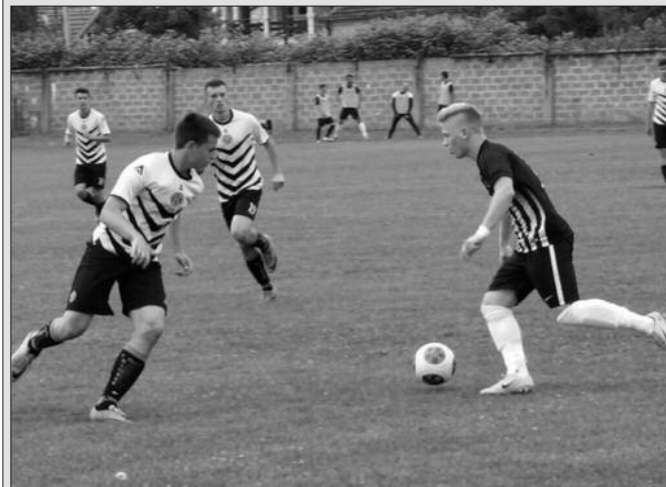
Кикер све бољи-детаљ са утакмице код Ложионице

Кадетска фудбалска лига Србије настављена је претходног викенда редовним 6. колом. Кикер је у Краљеву убедљиво поразио тим Јагодине резултатом 4-0 (2-0) што је друга победа Краљевчана у сезони.