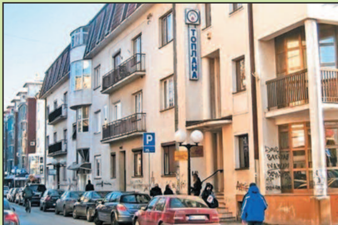
Најављена поскупљења струје и гаса неће повећати цену грејања

У краљевачкој „Топлани“ лето су искористили за ремонт, али и припрему документације за инвестиционе радове који ће се извести у наредној години.