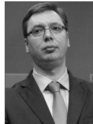
Председник Александар Вучић

Како „Ибарске новости“ сазнају 7.октобра наш град посетиће председник Србије Александар Вучић. Председник ће присуствовати обележавању Дана града Краљево а овом приликом биће потписани и уговори са три инострана инвеститора који ће на подручју града отворити производне фабрике у којима ће бити упошљено од шест до осам хиљада људи. Привредно девастиран град коначно добија могућност новог развоја и узлета, а то Краљево чека од почетка 21. века.