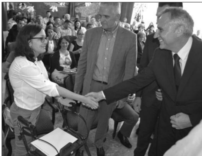
Још 60 лица добило субвенције за samozapošljavanje

-Ја ћу истаћи чењеницу да је НСЗ у овој години у граду Краљево издвојила 75 милиона динара што је омогућило да се или у програме образовања, обука или у програме запошљавања укључи преко 500 лица. Ово што радимо са локалном самоуправом омогућиће да се још 86 лица укључи у наше програме које заједно финансирамо. Дакле то ће бити један велики степен обухвата оних лица која