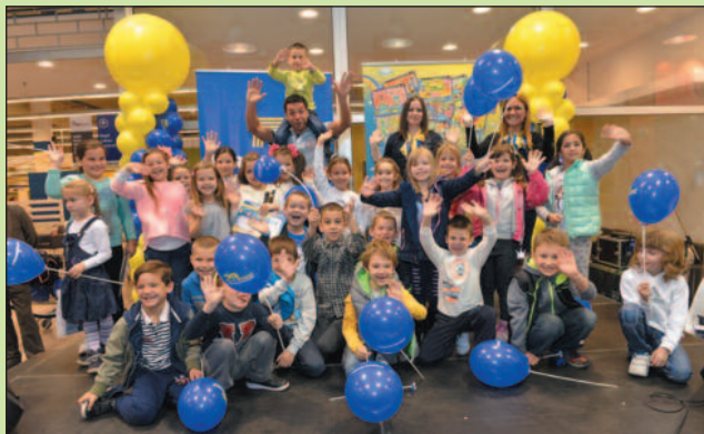
Пријаве за конкурс до краја септембра

Велики ликовни конкурс „Нацртај, обоји и освоји!“ Форма Идеале, који је због масовног учешћа првака и предшколаца ранијих година, означен као манифестација од националног значаја, током септембра се организује у свим заинтересованим школама и предшколским установама у целој Србији. Малишани имају шансу да своју креативност искажу на начин који одаберу, на тему „Моја идеална соба“, док ће учитељице и учитељи,