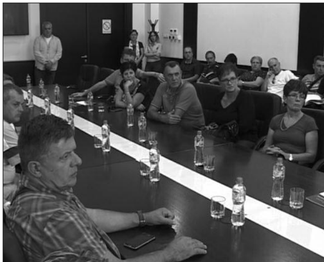
Нови импулс успостављању сарадње у свим областима

-Краљево је већ од раније са Словенијом, тачније највише са Марибором, имало одличне везе, а ово је још један импулс у отварању нове сарадње у области привреде, за оно