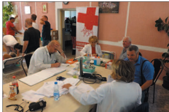
У акцији прикупљено и рекордних 114 јединица крви

периоду. Чланови краљевчке делегације обишли су и село Сушиће у