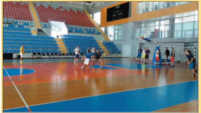
Јако од старта-тренинг кошаркаша краљевачке Слоге