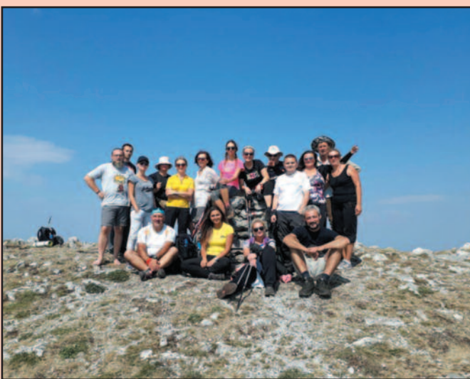
Краљевачки планинари на највишем врху Суве планине

Прошлог викенда краљевачки планинари, њих седамнаест, били су на Сувој планини где су успешно освојили највиши врх Трем, који се налази на 1810 метара надморске висине. Прва стајанка је била код Бојанине