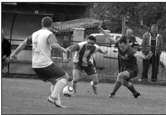
Карађорђе у победничком заносу чека Слободу-детал са прошлогодишње утакмице два тима