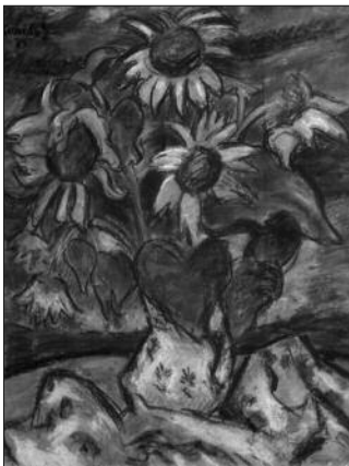
Сунцокрети из 1943. године