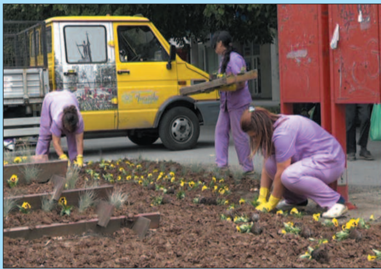
Како намолити обесне суграђане да не уништавају цвеће

-Паркови ће ове ране јесени имати један вид реконструкције, бар када су у питању промене у смислу цветних леја, односно засада украсног жбуња и украсних четинара. Морам да истакнем и да моје колеге, ја и читаво Јавно-комунално предузеће „Чистоћа“ се заиста трудимо да нам зелене површине и опште град буду што чистији, што