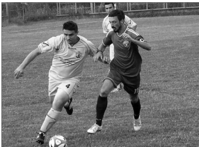
Детаљ са једне утакмице Међуопштинске фудбалске лиге Краљево

РЕЗУЛТАТИ 5. кола: Напредак-Младост (В) 0-0, Борац (А)-Тавник 2-0, Металац-Грдица 5-1, Краљево