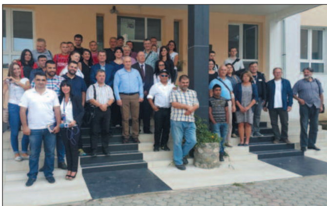
Домаћини из Штрпца организовали и пригодно дружење

Педесет активиста Српске напредне странке из Краљево и Врњачке Бање, који су добровољно даваоци крви, пре седам дана боравили су у Штрпцу где су учествовали у традиционалној акцији добровољног давања крви. Акција је организована у просторијама Економско трговинске школе у Штрпцу. Црвени крст Штрпце акцију организује традиционално са два завода за трансфузију крви - из Косовске Митровице и Грачанице. Ова акција остаће упамћена јер је прикупљено чак 114 јединица крви. Према евиденцији Црвеног крста Штрпца то је највећа количина крви прикупљена током само једне акције у последњих 25 година. Након акције домаћини из Штрпца организовали су и пригодно дружење где су дугогодишњим даваоцима уручене