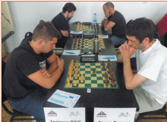
Детаљ са меча краљевачких шахиста у Руми