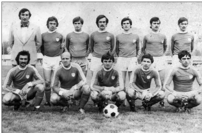
Једна од најбољих генерација у историји ФК Напредак из Грачаца

У нашем селу се посебно слави Велика госпојина, ваљар је и нормално је да смо прославу конципирали за те дане. Било је предивно, на нашем предивном терену сјатило се и старо и младо, сви они који су обележили исто-