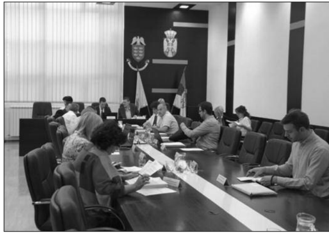
За четрнаест месеци одржана 31 седница

-Оног тренутка када комисија заврши свој рад и када коначни нацрт пошаље Комисији за приватна и јавна партнерства, а по њеном враћању, односно по позитивном исходу комисије биће заказана седница Скупштине града Краљева где ће тај предлог, надам