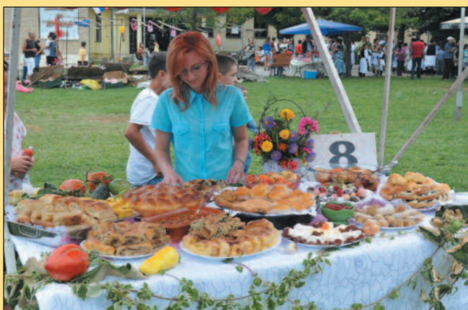
Ове године надметаће се више од двадесет такмичара

Данима проје у Ратини сваке године присуствује и неко из амбасада Русије, Белорусије и Ук-