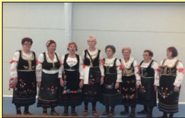
На свакој смотри оне освоје једно од прва три места

Женска певачка група „Рибница“ освојила је треће место на Госпојинском сабору у Дубу код Бајине Баште. Иако је била велика конкуренција, такмичило се више од 45 певачких група, Рибничанке су показале да су у одличној „форми“ и заслужено освојиле бронзу. Остаје да се и мушки део тима мало више потруди и донесе Краљеву још неки трофеј. М.М.К.