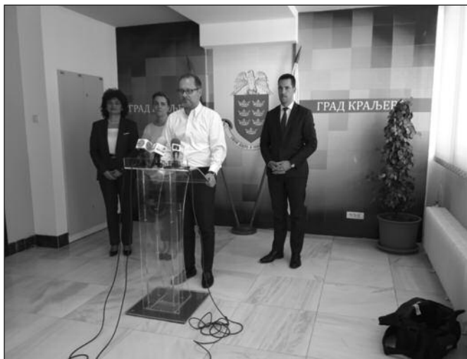
Побратимство иде својим током, на потезу су инвеститори

канадским дипломатским представницима овде и са канадском амбасадом у Београду, мислим да је битна. Одатле могу доћи иницијативе и предлози и то учешћем града Краљева у Савету канадских инвеститора који окупља око 70-ак канадских компанија које су овде. Њихова укупна вредност бизниса је око милијарду и по канадских долара, значи милијарду еура. Мислим да је то нешто што треба да донесе и неку инвестицију граду Краљеву из ове далеке земље са