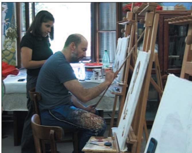
Полазници у први план стављају љубав према иконописању

–Одрастао сам у православном духу и често посећивајући манастире и цркве развио сам љубав према сакралној уметности, а нарочито према средњеве-