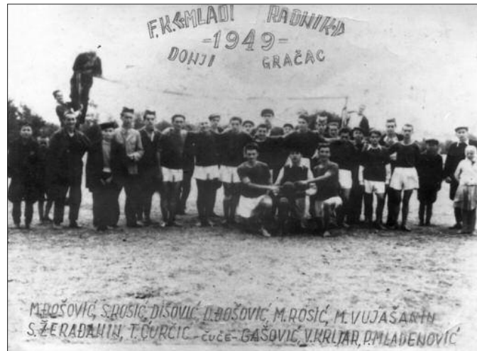
Почетак фудбала у Грачацу-слика екипе Младог радника из 1949. године

Актуелни председник Напретка из Грачаца са поносом истиче да у клубским анализама се прецизно води евиденција чланова.