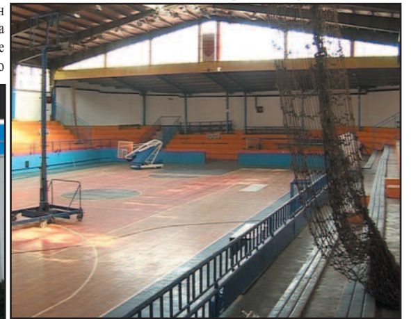
Стара хала од понедељка поново ради

-Очекујем да у понедељак 4. септембра дворана на Ибарском кеју почне нормално да ради. До тог дана