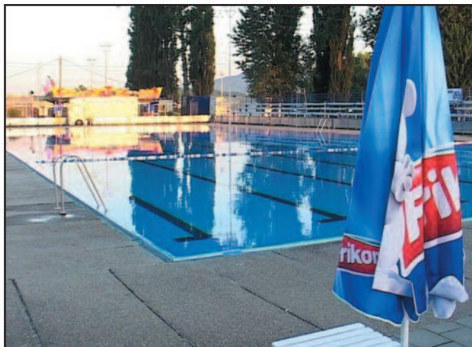
Одлична сезона-градски базен у Краљеву

Најављујући рад базена под обалом, у СЦ „Ибар“ су истакли да је жеља да он ради целе године. И