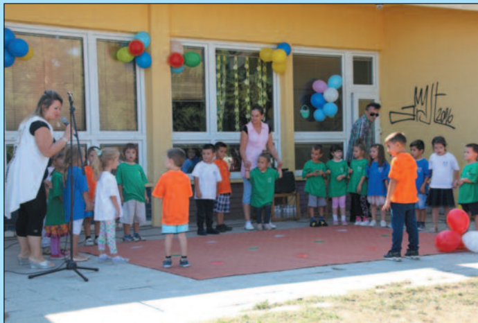
У знак захвалности малишани донаторима приредили посебан програм

„Доста смо пута коментари-сали на који начин би најбоље могли да подржимо и помогнемо локалне заједнице где послујемо. Углавном све идеје биле су нам у правцу деце. Управо зато смо дошли у вртић „Младост“. Желимо да на овај начин помогнемо и побољшамо услове у којима деца одрастају и очекујемо да ће им бити пријатније по овако топло време у климатизованим условима. „Рома компани“ ове године слави 25 година рада и у акцији под називом „Ко кречи, кућу лечи“ донирали су укупно 1.800.000 динара у Београду, Кра-