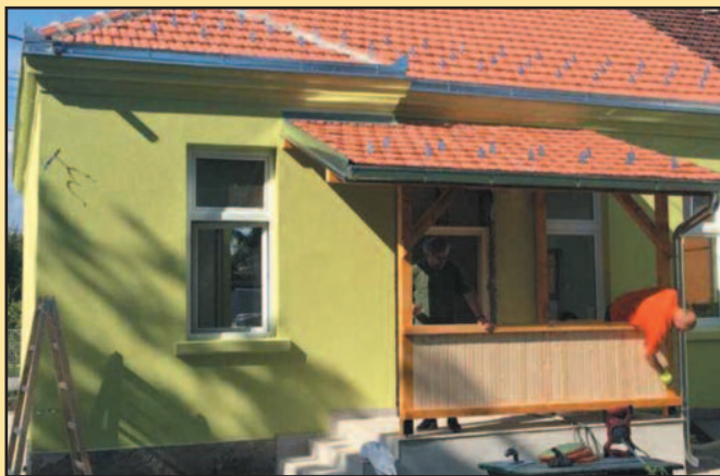
Библиотека санирана седам година после земљотреса

Овог школског распуста реализовали санацију школске библиотеке, која је била оштећена у земљотресу 2010. године. Заиста нам је неопходан тај простор и на крају смо успели да га реализујемо и то уз помоћ локалне самоуправе, која је финансирала цео пројекат. Радови су завршени крају, а у овом моменту у току су радови на санацији котларнице. То је заиста био наш вишедеценијски проблем. Ове године смо успели да прибавимо средства од Министарства просвете, науке и технолошког развоја и радови се приводе крају. Сигурна сам да