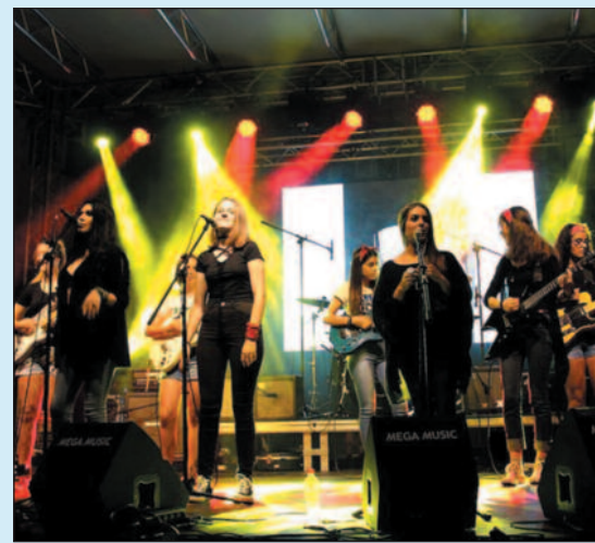
Краљевачки бенд „Принцезе рок планете“

Музички програм одржавао се два дана у дворишту ОШ „IV краљевачки батаљон“. Програм су прве вечери отвориле ПРИНЦЕЗЕ РОК