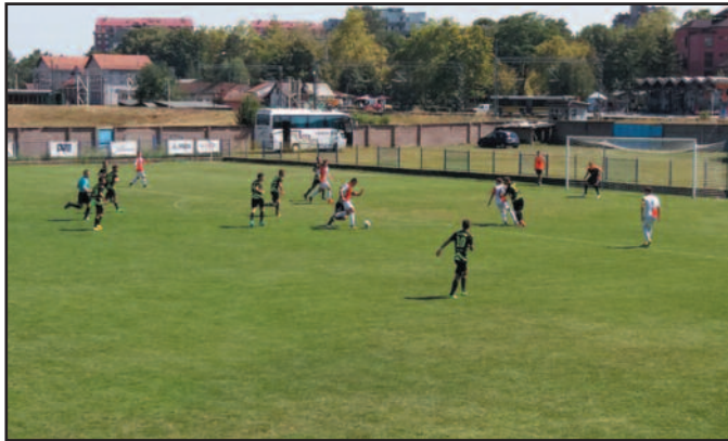
Војводина конкретнија у првом полувремену