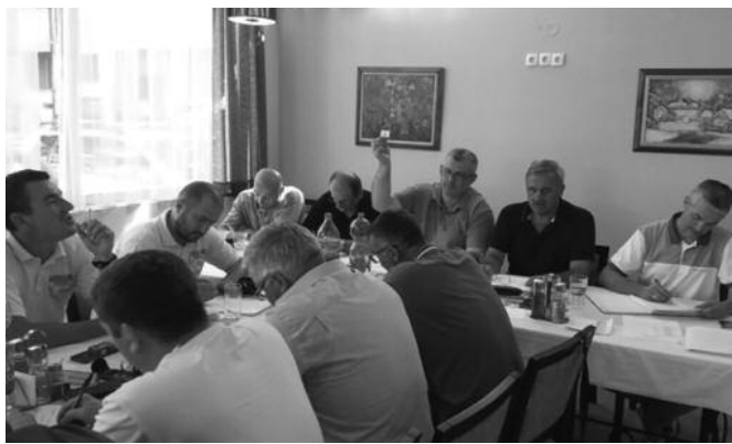
Жреб без проблема-са конференције клубова зоне Морава

- Трошквник такмичења није мењан у односу на прошлу сезону, све остаје исто. Такође ФСРЗС је учинио уступак клубовима и сада у такмичењу морају да имају само једну млађу селекцију, што се надам да ћете знати да искористите. У јесењој полусезони неће бити ванредних кола, док ће на пролеће бити два – нагласио је први оперативац фудбалског савеза Западне Србије.