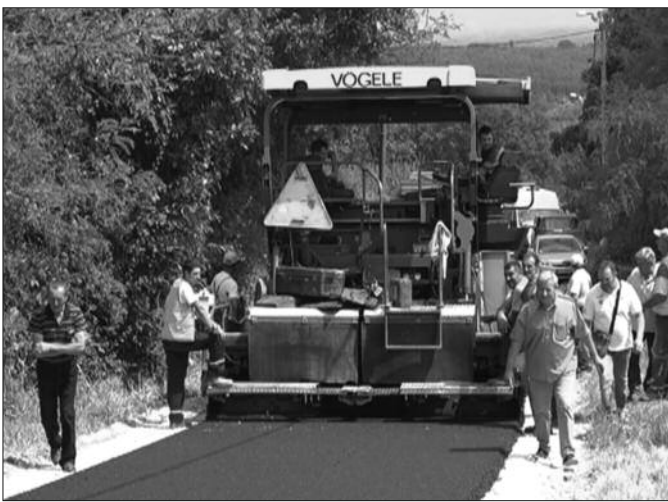
Асфалт ће сада спречити да киша однесе пут

- Захваљујем се свима који су нас разумели. Овај пут је стално био у проблему, када падне киша однесе га вода. Сваке године смо га бар по три пута поправљали.