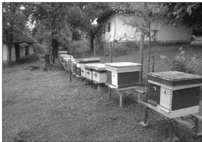
Август је прави период када треба третирати пчеле

-Обавеза увек има. Од тог првог пролећног прегледа, развоја друштва, затим паше којих има чак три и на крају припрема пчела за на-