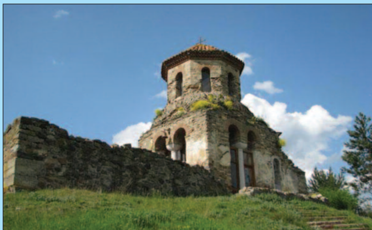
Манастир Стара Павлица