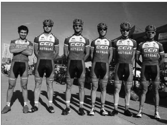
Бициклисти Металца у Кини