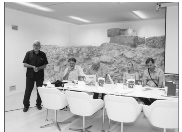
Представљање зборника у Римској дворани Библиотеке града Београда

тичара, историчара књижевности и наравно песника. То је наш допринос пре свега српској науци. Ето у томе је највећи допринос