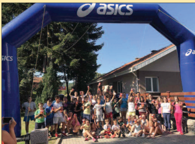
У знаку АСИКСа почетак друге смене кампа у Митровом Пољу

- Веома сам задовољан. Ово нам је једна од најбољих других смена на кампу, само смо једне године имали више полазника у дру-