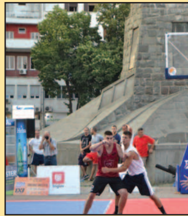
Играло се на два терена професионалног баскет

• Баскеташки тим из Крагујевца победио је у финалу професионалног турнира „3x3 Краљево“ са резултатом 60.000 динара, спортски центар Крагујевца Србије и директан пласман у финале турнира који је бити одржано 19. августа