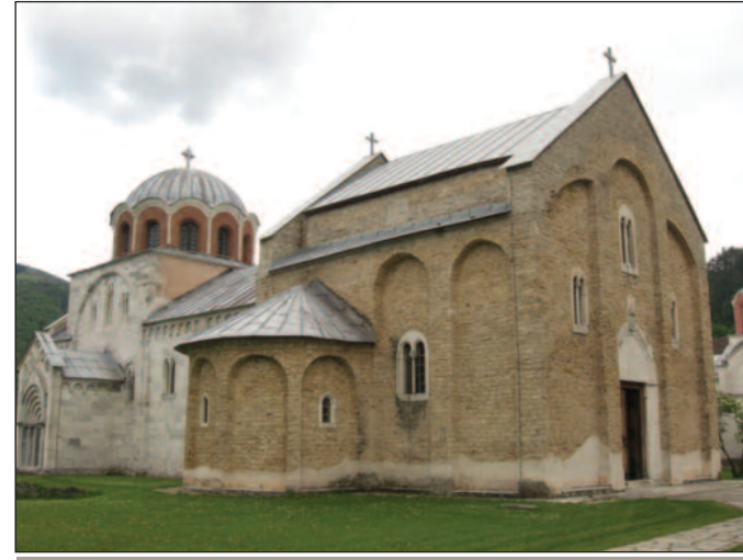
Манастир Студеница, 1183. Задужбина Стефана Немање

Путоказе имамо: личности, време и тло, за које смо коренима везани истински и моћно да само наш пристанак да нас ишчупају може нас из њега истргнути да нас нема. Немањићи су, на овом длану земље, коју је Бог нама наменио,