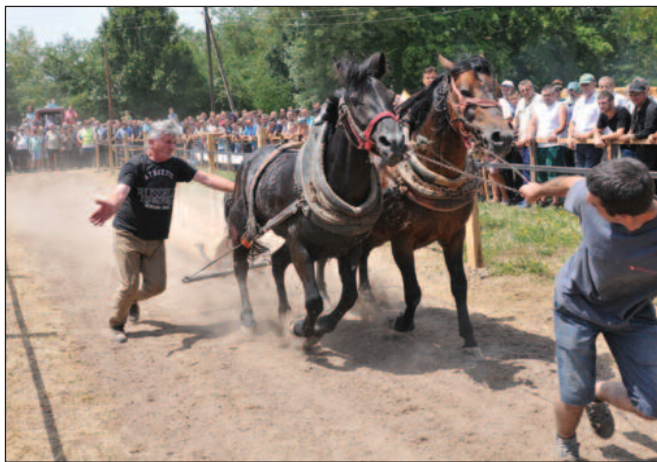
Оцењивало се понашање коња, али и њихових власника