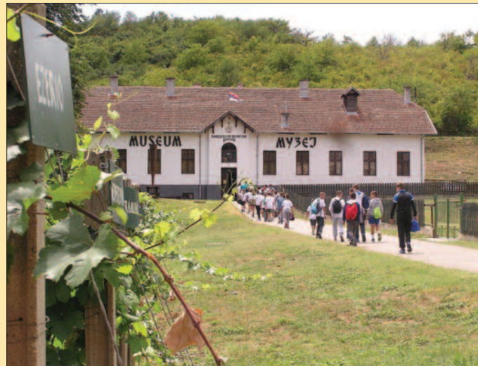
Полазници друге смене посетили су и музеј виноградарства у Александровцу

И у овој смени су деца имала адекватну здравствену заштиту, осигурање, као и занимљив друштвени живот мимо одбојкашког терена. Граја, осмеси задовољства парали су небо између Гоча и Жељина као и ватромет који је означио крај овогодишњег дру-