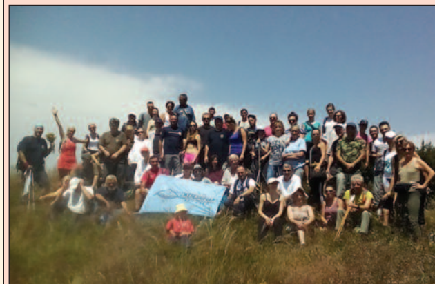
Свих стотинак учесника успешно су изашли на врх Гусарице