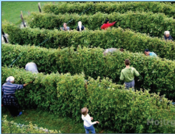
Млади нису заинтересовани за бербу малина

И у туристичком месту Врњачка Бања нема довољно радне снаге за рад у угоститељству, па се и ту може наћи