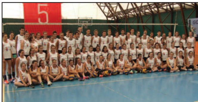
Међу учесницима прве смене дечака је било мање од трећине