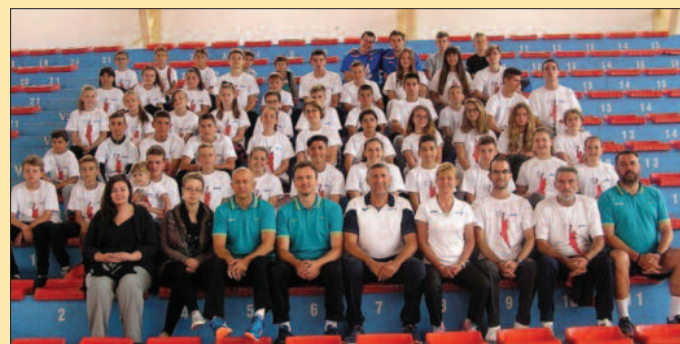
Полазници друге смене кампа АСИКС Митрово Поље

- Дошао сам у Митрово Поље други пут и веома сам задовољан. нама је то далеко до киуће, али сав тај напор се заборави када стигнете овде, јер је природа и амбијет одличан. Ради се врхунски, тре-