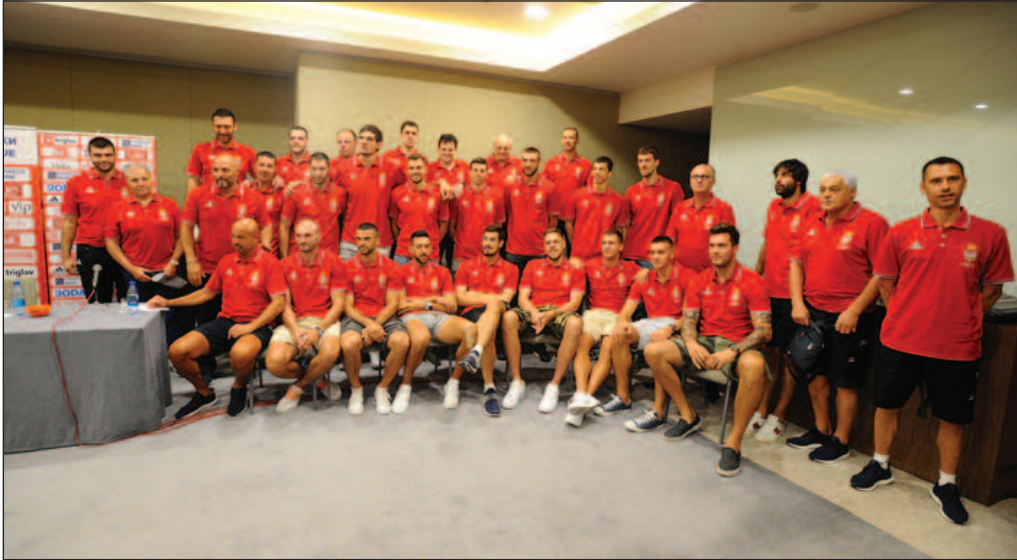
Краљевчани ће у среду моћи да поздраве репрезентативце Србије и да уживају у њиховим потезима

-Ја морам да напоменем да ово није прва сарадња са Кошаркашким савезом Србије. Ми смо прошле године били домаћини и организатори утакмице у којој су играле женске селекције Србије и