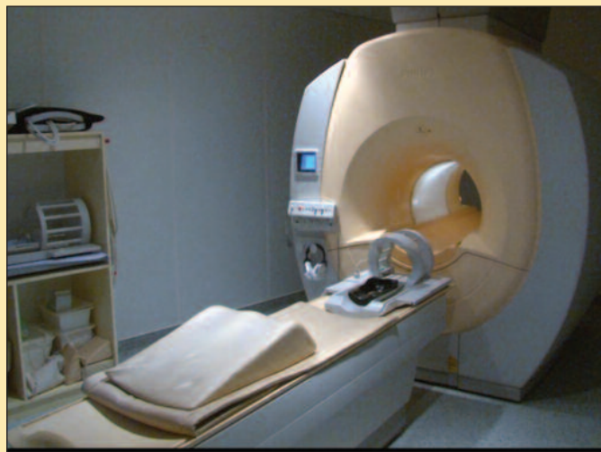
Нови апарат омогућиће већи број услуга

-Самим тим добили смо бољи квалитет и већи дијапазон пружања услуга нашим пацијентима. Оно што на старој магнетној резонанци нисмо могли да радимо, а сада можемо, то је магнетна резонанца дојки, онда магнетна резонанца жучних путева, па комплетног коштаноглобног система и слично. Гледали смо да тај апарат задо-