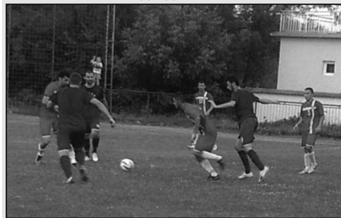
Детаљ са пријатељске утакмице Карађорђа и Радничког

Пријатељски меч припремног карактера одиграли су међусобно краљевачки зонаши Карађорђе из Рибнице и Раднички из Ковача. После изједначене игре победу је славио Карађорђе минималним резултатом 1-0, али у оба тима има места задовољству.