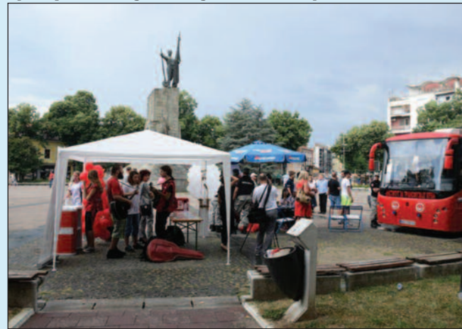
Позиву се одазвало 155 Краљевчана

• Позиву да дају крв одазвало се 155 Краљевчана, а прикупљена је 131 јединица крви