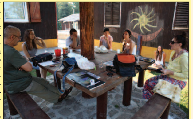
У колонији на Гочу и две гошће из Дизелдорфа

Кроз непосредно искуство у процесу стварања уметничког дела, млади уметници истовремено обликују, коригују и усавршавају сопствену личност, постајући тако квалитетнији и свеснији људи. Отуда је оправдано и