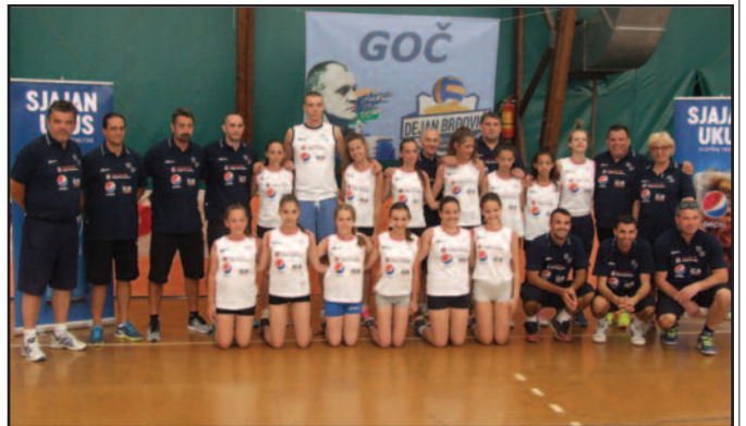
Тренери и најмлађа категорија учесника кампа

играча кампа припремљена је посебна награда ручни сат дар фирме Ајс своч. Поред ове фирме као спонзори помогли