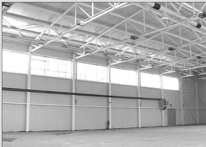
У трећој фази хала ће бити уређена и споља и изнутра

Сама Хала се састоји из два дела, од анекса и спортске сале, укупне површине око 1 200 квадрата корисног простора. Радови на изградњи спортске хале износиће до 50 милиона, а ту ће бити и додатних средстава за спортску опрему која ће бити набављена по завршетку радова.