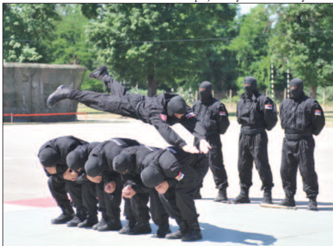
Припадници жандармерије показали велику умешност, издржљивост и увежбаност

Представници епархије Жичке, Војске Србије, Полиције и локалне самоуправе могли су да виде једну од ефектнијих тактичко показних вежби. Прво су припадници Жандармерије показали групни приказ борилачких вештина. Ови припадници су мајстори у каратеу, цудоу,