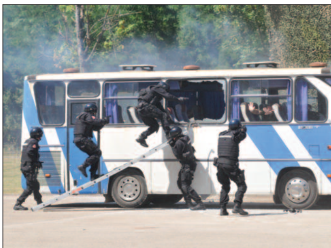
Брзо и ефикасно заустављени терористи у украденом аутобусу

Припадници краљевачког Одрода жандармерије били су домаћини централне прослава Дана Жандармерије. На самом улазу био је представљен тактичко - технички збор, опрема коју користи Жандармерија. Први међу једнакима постављено је борбено возило Лазар. Ремек дело наше производње са погоном на осам точкова. Припадници жандармерије воле да користе српско наоружање, а застава м93 познатија као „црна стрела“ најбоља је на свету са убојном моћи од 1000 метара. Главни гост централне манифестације Дана Жандармерије био је потпредседник Владе Републике Србије и министар унутрашњих послова др Небојша Стефановић. Њега је највише занимало да погледа борбено оклопно возило „САКС“ са 4 члана посаде које трпи од 3 до 5 килограма експлозива и директан погодак муниције од 20мм. Возило је од 1988. до