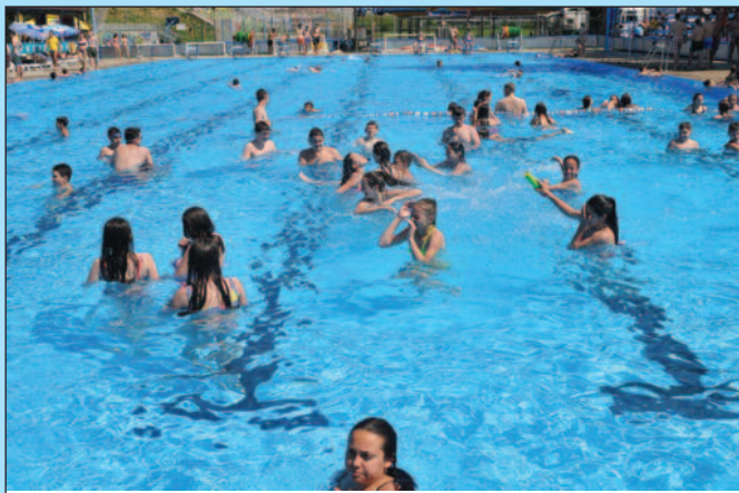
Вода у Градском базену редовно се контролише

-Постоји правилник о контроли воде у базенима. Ове године, по измени правилника који је уск-