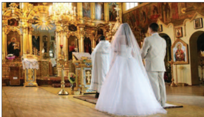
у 2016. години хиљаду бракова мање него у претходној години!

Језик наш, другим језицима, оних, из чијих нам је жвала само мржња текла, подводнички потурамо, заборављајући завет предака и завет прецима и нашу крв коју су лоптили. „Вируснице“ радо употребљавамо да бисмо били оно што нисмо и да бисмо се представили другима онаквим какви нисмо. Трујемо језик, а у својој глупости, поданички, подрепашки, бескичмењачки себе неизлечиво трујемо, као биће и као појединца. Хулимо на Бога и претке и дозвољавамо цинички да силују и „вирусницама“