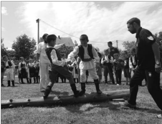
У хајдучким дисциплинама такмичили се и дечаци старости до десет година

Такмичење у хајдучким дисциплинама, који се ретко виђају на нашим просторима, окупило је момке и девојке из целе земље. У категорији Орлића до 10 година, најуспеш-