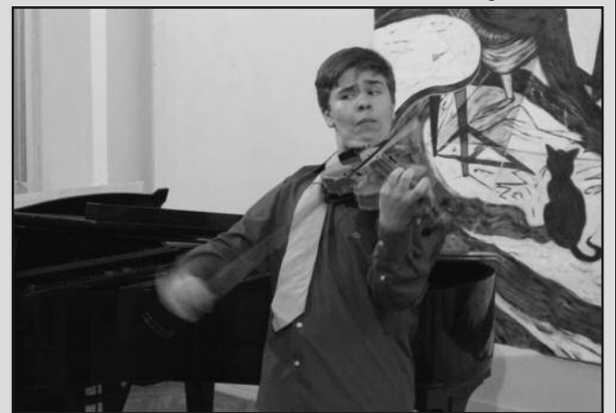
Виолиниста Александар Илијовски