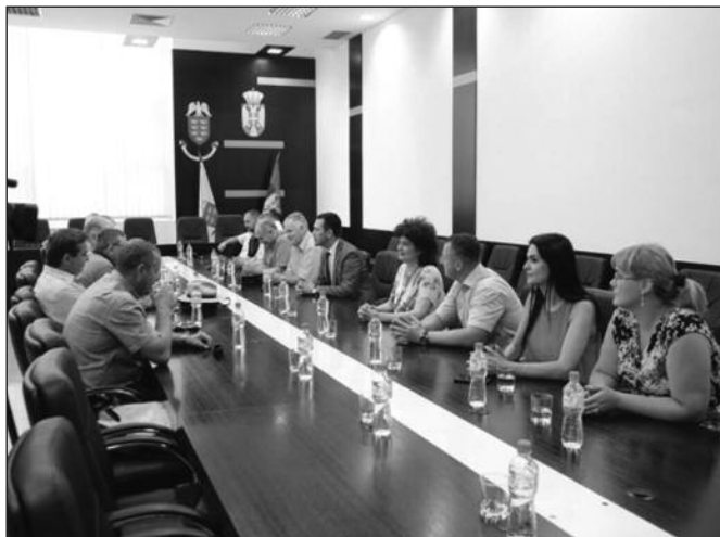
Међусобном сарадњом до средстава из европских фондова

-Техничко лице, представник Марибора, разговараће са нашем особом за контакт. Ми смо обезбедили неопходне техничке услове за сарадњу и просторије у којима ће се представник Марибора налазити када буде у Краљеву. Надам се да ће они кроз своје разговоре пронаћи најбољи модел сарадње и одредити се на који начин ће конкурисати за средства из европских фондова. Конкретне понуде постоје и надам се да ћемо успети да започнемо реализацију тих пројеката, рекао је градоначел-