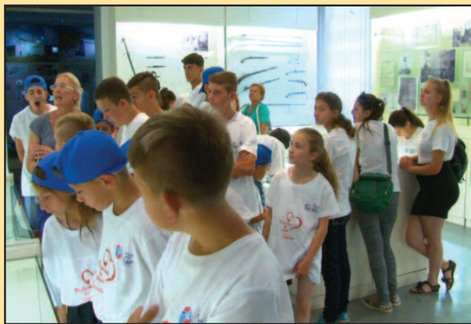
У музеју највише их је заинтересовала ратна историја Краљева

- У том селу живи 30 породица, укупно око 160 људи. Скромног су материјалног стања, мањи број њих је запослен и осим тог лошег материјалног положаја живе и у неком извесном безбедносном ризику. После 1999. године имали смо и жртава у овом селу које је карактеристично и по томе што у селу од 160 становника имамо 50 деце од 0 до 18 година, а са градом Краљевом до-