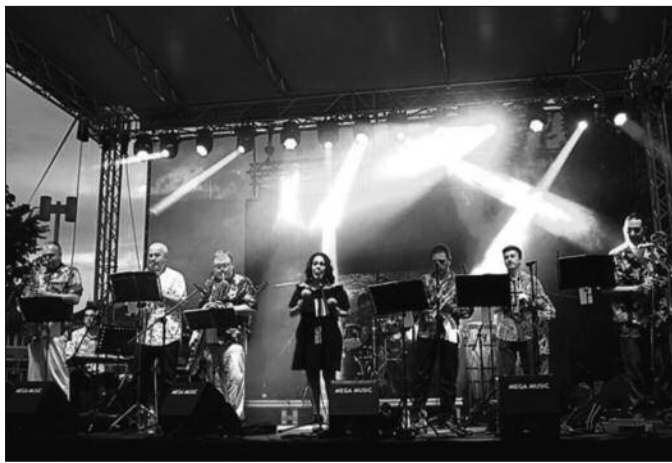
Ансамбл The Mambo Stars натерао посетиоце да заиграју

У суботу, другог дана фестивала, на Тргу Светог Саве вече је почело наступом београдског ансамбла The Mambo Stars, који је настао као латин, салса оркестар, али временом су репертоар проширили на џез