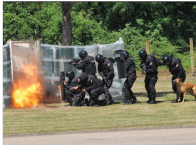
Упад специјалне јединице у објекат са терористима

За крај и врхунац церемоније три припадника падобранског вода скочили су из хеликоптера са висине од 1.200 метара. Српску заставу носио је помоћник команданта Одрода жандармерије у Нишу, који иза