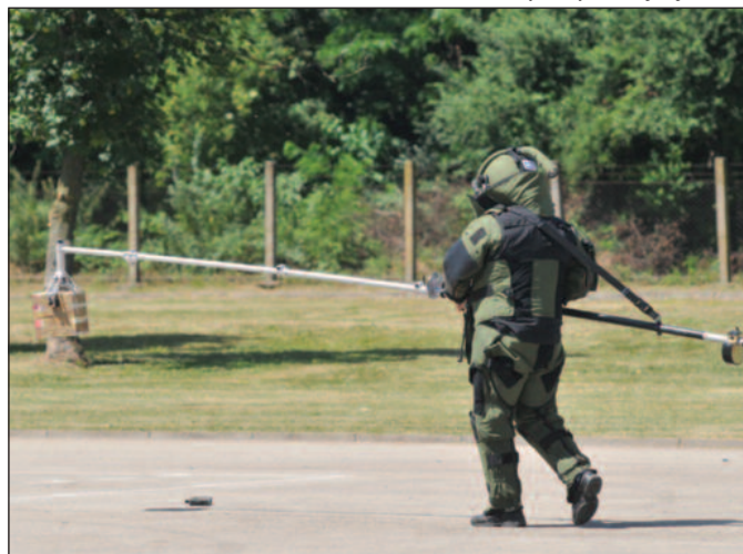
Припадник специјалне јединице деактивира експлозив

„Морамо да се сетимо оних припадника Жандармерије и Полиције који су своје животе дали извршавајући своје задатке. Не смемо да заборавимо све оне који су своје животе уградили у безбедност Србије да би ми данас могли да будемо безбедни, да живимо нормално и који су то урадили несебечно. Ми ћемо у Жандармерију да наставимо да улажемо. Већ су плаћене нове униформе, настављамо са куповином возила, модернизацијом