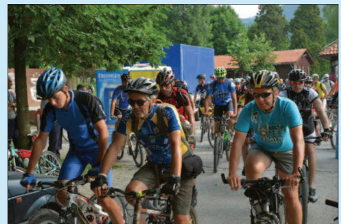
Сваке године све већи број учесника

"Чикер МТБ марафон 2017" стартовао је прошле недеље у Краљеву, а завршиће се у Котору, на обали Јадранског мора, у уторак 4. јула. На својој траси марафон ће ићи преко многих планина у Србији и Црној Гори, од којих су најпознатије Златибор, Златар, Јабучка, Љубишња и Дурмитор, а