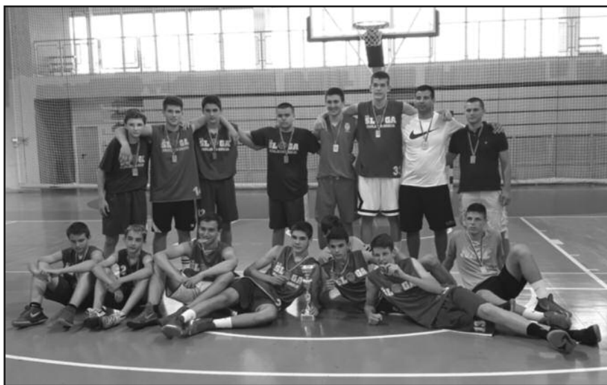
Окићени медаљама пионири Слоге обећавају нове успехе

-Направили смо један леп успех у овом региону, мислим на Рашко- косовски округ и на Централну и Западну Србију. Оно на шта сам посебно поносан је што смо били једина екипа ван Београда која се пласирала међу осам најбољих тимова који су наступили на завршном турниру за првака Србије управо у главном граду. Најпре смо у Краљеву одиграли две јаке утакмице где смо победили Партизан и Срем а изгубили од Визуре и тако заузели друго место. На финалном тур-