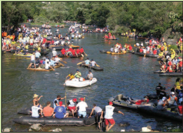
Организатори у недељу очекују пет хиљада посетилаца

Традиционални, 28. по реду „Весели спуст“ – популарно сплаварење Ибром од средњовековног града Маглича у Ибарској клисури, па до Матарушке Бање и Краљева, биће одржан у недељу, 2. јула. Организатори најлуђе и најстарије журке на води у Србији – овадшња Туристичка организација и Кајакашки клуб „Ибар“, очекују долазак бар пет хиљада „сплавара“ из свих крајева земље, али и из Македоније, Републике Српске и држава у региону.