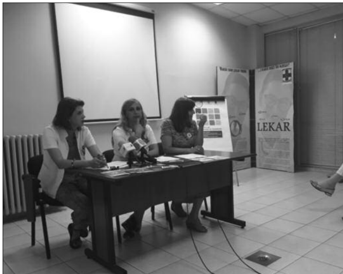
Велики проблем данашњице је појава нових илегалних дрога

се број зависника на хероину одржава негде на истом нивоу, односно не повећава се, а оно