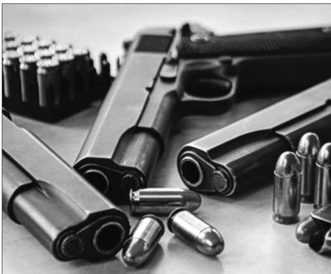
Не постоје никакве санкције за лица која предају оружје

-За грађане то значи да имају могућност да своје илегално оружје уведу у легалне токове. Наиме, власници оружја који немају прописану исправу издату од стране надлежног органа, могу у овом периоду предати оружје а могу и поднети захтев