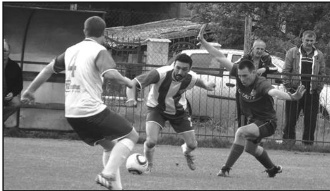
Детаљ са утакмице Карађорђе-Орловац