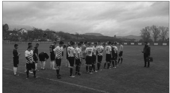
Кадети Кикера и Рада пред почетак утакмице