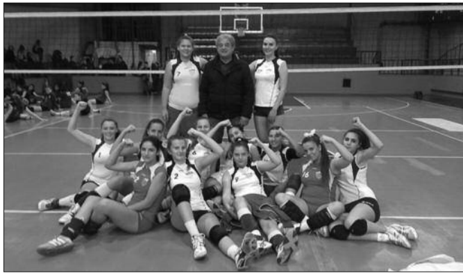
Одбојкашице краљевачког Економца

- Јесам задовољан сезоном, али признајем да сам очекивао више и надао се да будемо прваци. Ми имамо тим који већ неколико сезона игра заједно, са те стране смо били у предности у односу на друге екипе. Ипак, имали смо великих проблема око термина за тренинге у Краљеву. Често смо морали да тренирамо у Грачацу, Вранешима, било је то сналажење и такви проблеми су се одразили у финалисту сезоне. Када се све сабере, победили смо 15 утакмица и то мора да се цени и поштује. На крају је Златибор првак, заслужено, јер они су нас