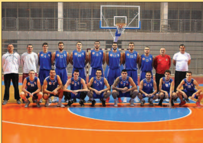
Крај тешке сезоне-КК Слога Краљево