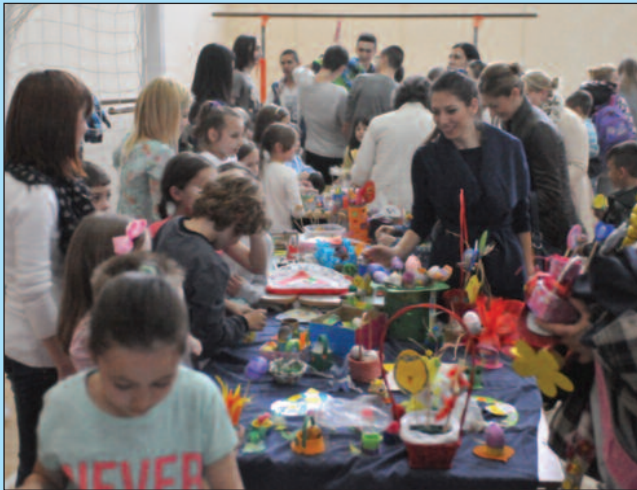
Интересовање превазишло сва очекивања

По шести пут организујемо ускршњу манифестацију која и ове године има хуманитарни карактер. А колико је изложба била успешна сведочи и чињеница да је наша сала била тесна да