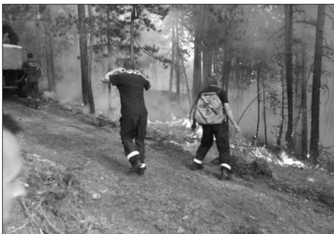
У фебруару написано 40 пријава, а поћетна казна је 10.000 динара

Поред штете на пољопривредном земљишту, наноси се и огромна материјална штета ватрогасцима и друштву у целини. Ми смо у фебруару имали чак 98 интервенција. Ако узмемо у обзир да нису сви дани били сунчани, да је било и падавина, долазимо до