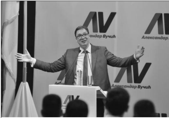
Александар Вучић још доминантнији у другом кругу