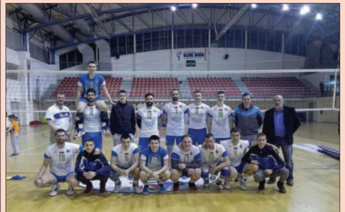
ОК Кнез Лазар из Крушевца првак Друге лиге група Запад