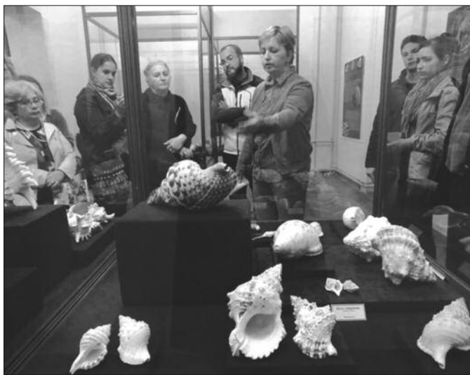
Лепота мекушаца скривена у морским дубинама

Из Збирке савремених мекушаца која се чува у Природњачком музеју, на овој изложби је