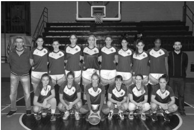
Победиле Кораћ и спремне за Звезду-кошаркашице Краљева