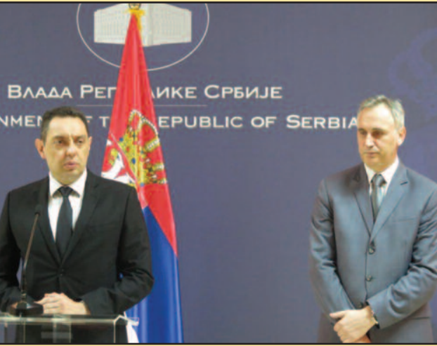
сандар Вулин и Зоран Мартиновић на конференцији за новинаре

ом, што представља нову тенденцију у односу на претходну годину. Последњи рок за поднеске захтева са бизнис планом за samozапошљавање је до 30. априла.