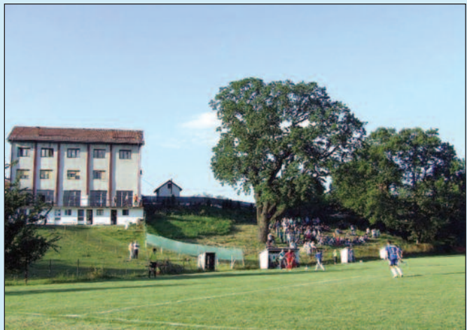
Лађевци без фудбала-игралиште Браће Вуковић