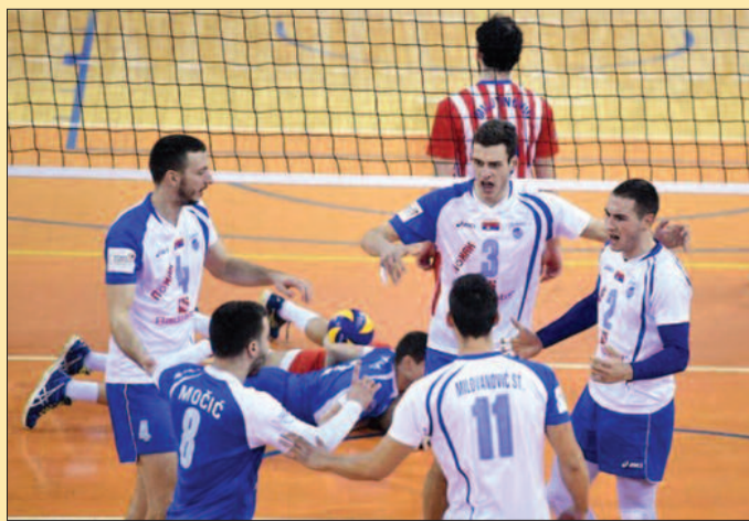
Прославили тријумф на Бањици-одбојкаши краљевачке Рибнице

– Нисмо ни размишљали о статистичким подацима, тек када смо