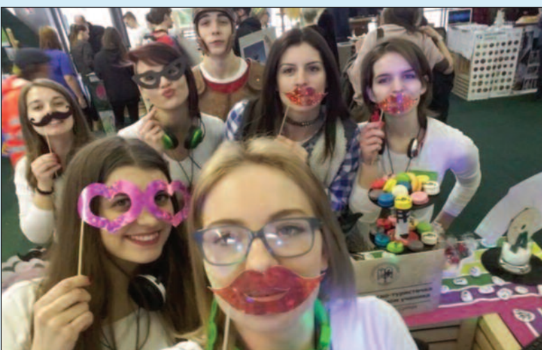
Доказали квалитет Угоститељско-туристичке школе у Врњачкој Бањи

школе из Словеније, Црне Горе, Босне и Србије, Угоститељско-туристичка школа из Врњачке Бање, освојила Златно признање у три категорије, односно у три категорије: „Потујем, промоцијском виртуелног турнеја“ и „Туристички центар“.