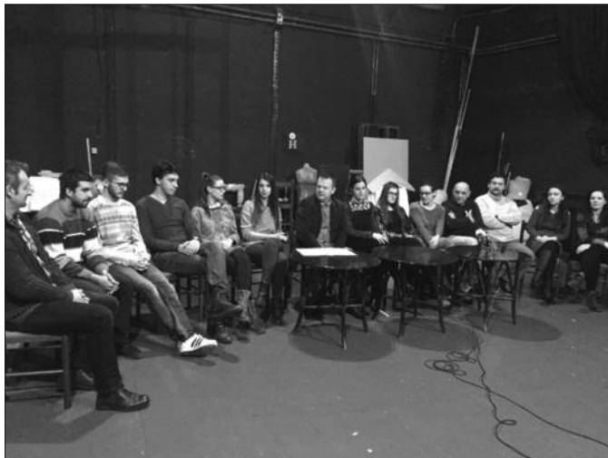
Глумачки ансамбл наставља рад са нескривеним ентузијазмом

- Тако да ће овај месец носити слоган „Позориште упркос свему“. Имаћемо прилике да вам прикажемо представе, како наше, тако и гостујуће, у новим, камерним условима. Намера је да се овог месеца, све пред-