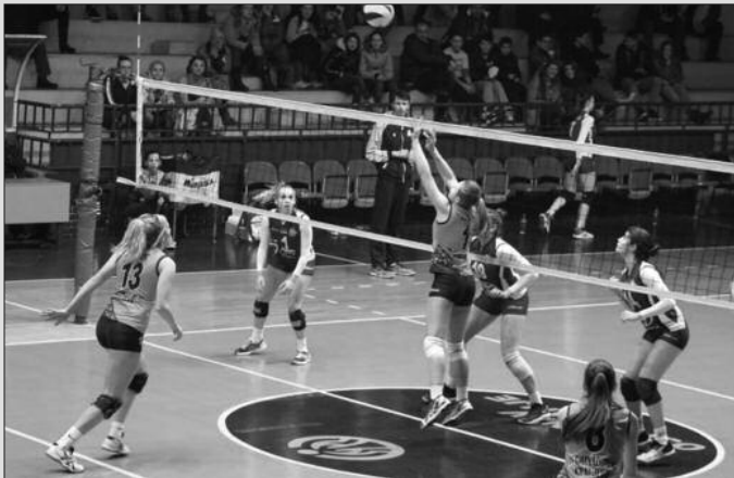
Јована Симић у акцији

- Одлично смо почели, најбоље ове сезоне. Просто смо разнели ривала и утишали веома гласну публику и њихове ватрене навијаче. Шта се после тога догодило, тешко је објаснити. Потпуно смо стале, два сета смо изгубиле без отпора и противника вратиле у живот. Прекор тренера смо озбиљно схватиле, у четвртм сету смо одиграле врло квалитетно, имале сигурно вођство све до тренутка када је нашем стратегу показан жути картон. Све некако окренуло, Београд нас је стигао, али смо после велике борбе, на разлику добиле сет и изједначиле. У тај брек нисмо имали снаге, једва смо стајале на ногама и домаћин је заслужено победио – прича Јована Симић први техни-