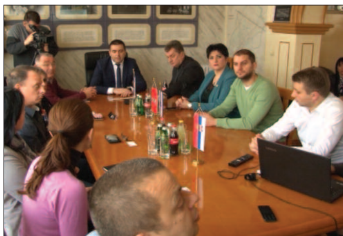
Гости оценили да ће се Врњачка Бања сигурно допасти Израелцима

-Данас смо се овде уверили у велики потенцијал тог ловног, односно спортског туризма. Оваквим објектима желимо да читав Рашки округ представимо као једну интересантну дестинацију. Битно је да ће овде радити један број људи, али је је још значајније да ће село Лопатница, развојем оваквих објеката, добити могућност да угости одређени број туриста који су везани за тај ловни туризам. То јесте једна добра и перспектива идеја, јер су у питању на стотине хектара ограђених лова