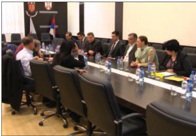
За делегацију Израела организована презентација свих потенцијала Краљева