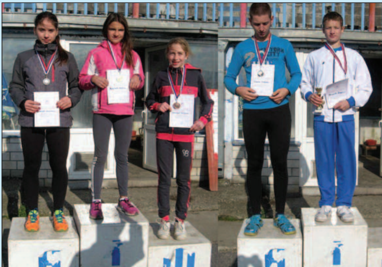
Победници на клупском вишебоју

Хладно и ветровито време није спречило најбоље пионире АК Краљево да изађу на стадион крај Ибра и такмиче