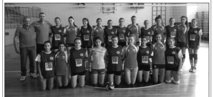
Различита расположења-одбојкашице краљевачких друголигаша Економца и Техничара

На теренима Друге лиге група "Запад" за одбојкашице претходног викенда одигране су утакмице 5. кола. Економица је у Краљеву победио тим Лепосавића резултатом 3-1 (25:21, 25:14, 22:25, 25:21), док је Техничар у Пријепољу поражен од домаћих ПUTEВА Трендтекс резултатом 3-1 (25:16, 22:25, 25:16, 25:23). Изабранице Љу-