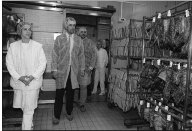
Оно што можемо решити у најскорије време, обећао градоначелник

много људи из околних градова довозе своја говеда како би их продали баш у Тавнику. Веома је важно да пронађемо начин како да помогнемо овим предузећима. Ми ћемо настојати да проблем отпадних вода ускоро решимо. То су проблеми који датирају годинама уназад и ми смо дошли да видимо који су то проблеми и како их можемо решавати. Оно што можемо решавати у најскоријем периоду и надам се да ће сви у Тав-