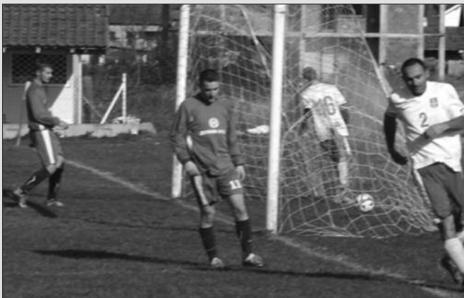
Тренутак када Млада Крила постижу трећи гол против Груже

Претходног викенда одигране су утакмице 14. кола Међуопштинске фудбалске лиге Краљево. Лидер је код Ложионице показао како стоје ствари, "петардирао" је домаћи Металац и потврдио да има тим за највеће домете. Победу је остварио и први пратилац, Будућност је у Конареви лако изашла на крај са непредвидивим Напредком из Грачаца. Криза донедавног лидера из Врбе траје, овога пута су до бода стигли "малинари" из Врдила. Звезда је у прошлом колу уписала прву победу, а сада је у Сирчи стигла и до првог ремија. Реми зачињен са шест голова виђен је у Адранима, док је највише голова виђено у Мети-кошима. У недељном матинеу