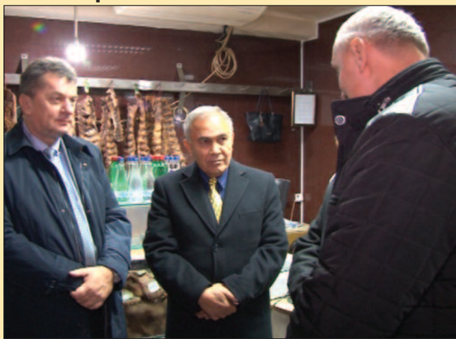
Палестина увози доста хране-има простора за сарадњу

Након обиласка ових угледних домаћина организован је и