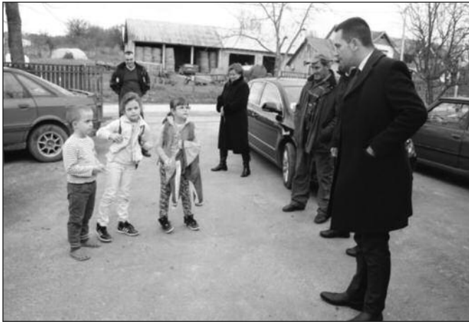
Тавник је село у коме млади остају

—Обишли смо предузеће „Сан“ и предузеће „Нид“. Предузеће „Сан“ запошљава 110 радника, а предузеће „Нид“ 144 људи. С једне стране град Краљево преко Фонда за развој пољопривреде обезбеђује подстицаје за развој сточарства и на тај начин успева да обезбеди сировину за ова предузећа. С друге стране сточарима то значи, јер они могу своја говеда и свиње да продају Краљевчанима и не морају да их одвозе у друга места. У разговору са власницима кланице сазнали смо да