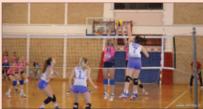
Пораз у Врању-деталј са утакмице одбојкашица Гимназијалца