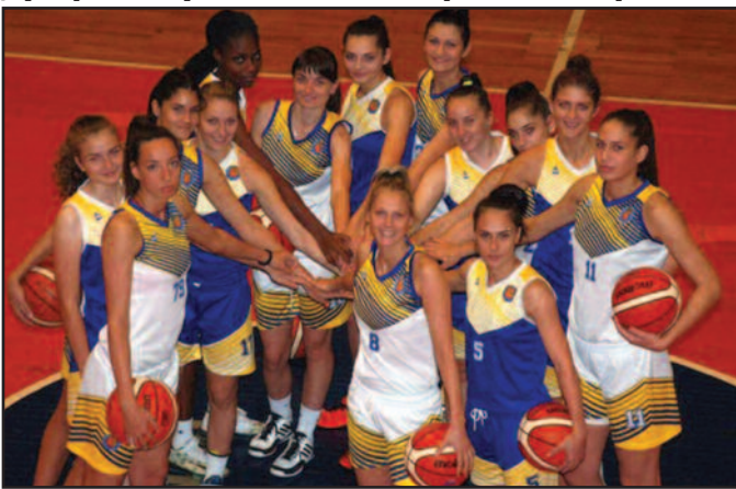
Кошаркашице Краљева у доброј форми

-Чекамо дуеле са Партизаном који ће одлучити око четвртог путника у Суперлиги из ове групе ВАБА лиге. Мислим да са „црно-белима“ можемо да играмо, чека нас тежак двомеч, али се надам да као дебитанти у овом такмичењу можемо до друге фазе – јасан је