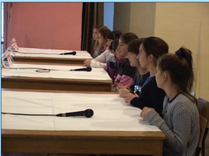
Победници ће бранити прво место на прошлогодишњем такмичењу

Припреме за квиз су обављене у септембру, када су наставници и чланови ДВД Краљево свим ученицима основних школа преносили низ основних знања у облику питања и одговора који се појав-