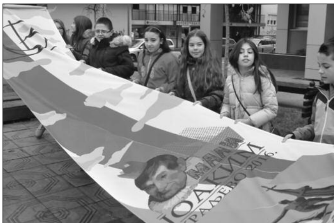
Краљевачки малишани подижу фестивалску заставу

- „Јоакимов“ фестивал који се очигледно разумио и на ову врсту театра, која је темељна, значи иницијална врста театра, је подухват вредан пажње. Пре свега због свих театарских напора изван Београда, који кумулише много позоришне енергије, да се сва она позоришта у средишту Србије међусобно повезују, међусобно представљају резултате, да различите средине