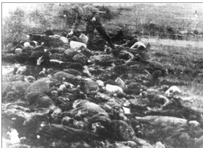
Призор са стрељања у Краљеву 1941. године

За становнике Краљева, месец октобар је месец сећања на жртве које је немачка војска стрељала октобра 1941. године. И овог 14. октобра смо чули јасну поруку да октобарске жртве не смео и не можемо заборавити. Међутим, једна од суштинских одлика савремене цивилизације је да живимо у времену заборављања. Много је појединаца и институција који сматрају да је напредак целокупног друштва могућ само онда ако заборавимо прошлост и оријентишемо се искључиво на будућност. Зато је Фридрих Ниче и рекао „Блажени заборавни“, док калифорнијска изрека каже: History is five days old (Историја је стара пет дана). Према томе, по среди је жеља да се из људске свести избрише сећање на прошлост, што даље значи и сећање на жртве. Отуда су појединци, институције и читави системи свестрано радиле на томе да одређене жртве избришу из сећања њихових потомака и сународника. У томе су често имали великог успеха. Међутим, заборављање је поништавање и жртава и оних који су их заборавили. Другим речима, заборав жртава је њихово обесмишљавање и порицање да жртвовање има сврху и