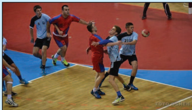
Вељовић заустављен-детал са утакмице рукометаша Металаца

У 5. колу Прве лиге група „Запад“ рукометаша Металаца су доживели и пети пораз. У Краљевоу је претходног викенда победу славио Гоч Меркур резултатом 26-28 (13-12). И поред вођства на полувремену, рукометаша Металаца нису успели да одиграју довољно концентрисано да би стигли до првих бодова у так-