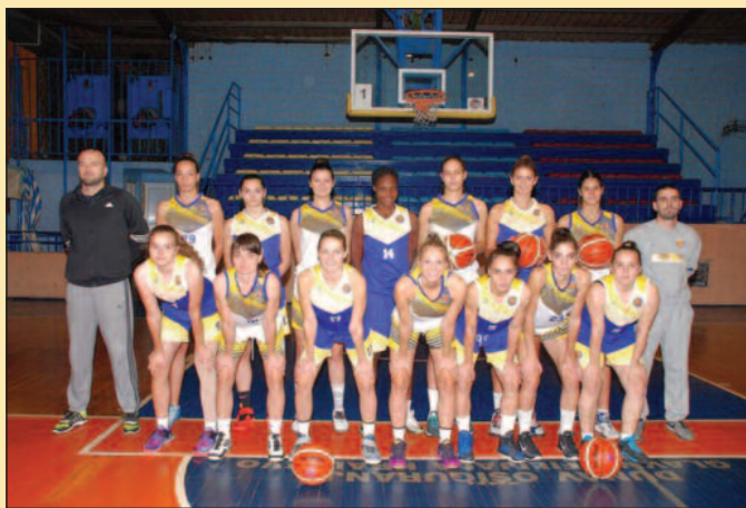
Кошаркашице Краљева после четири кола воде у КЛС

Нови тријумф Краљева само потврђује да су „малене“ спремне за високе домете ове сезоне. Лидерска позиција, после два уводна