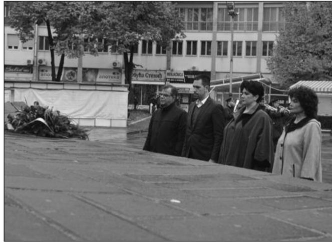
Венац на споменик српским ратницима положила делегација града Краљева

На дан 22. октобра пре 98 година у 19 часова коњица патрола