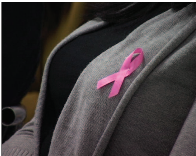
Ружичаста машница- препознатљив симбол у борби против рака дојке

-Према подацима Института завода за јавно здравље Србије за 2013.годину у нашој земљи регистровано је 3 594 оболеле жене од карцинома дојке а исте године је умрло 1 647 жена. На територији нашег округа ситуација је као и у целој нашој земљи. Просечно од 2002.године, па до 2014.године годишње оболи око 125 жена. На територији града Краљева, Врњачке Бање и Рашке оболева дупло више жена него на територији Новог Пазара и Тутина.