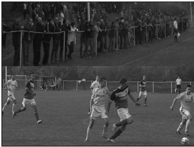
Добра посета за једну зонашку утакмицу-детал са меча Раднички-Слога

мица без пораза, све тријумфе оставио је у Ковачима, где милости према ривалима нема.