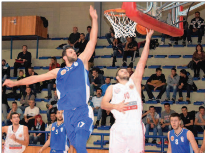
Детаљ са утакмице Напредак-Слога

Тренутна селекција је таква да се тај проблем јако осећа у игри. Био је присутан у све три одигране утакмице КЛС. Много је разлога зашто нисмо успели то да решимо раније, али константно радимо на томе. Сада нам се отвара други про-