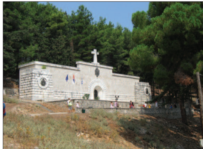
Маузолеј на острву Виду

Друштво историчара Рашког округа - Краљево организује нови циклус такмичења за ученике основних и средњих школа на тему "Срби на острву Крфу и Солунском фронту". У периоду од 1. до 10. новембра сви заинтересовани ученици ће бити тестирани. Најуспешнији ће учествовати на такмичењу из историје у категорији ученика основних и средњих школа. По-