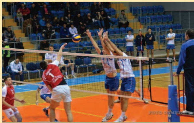
Блок мускетара за вредан тријумф

-Одлично смо ушли у утакмицу, све је функционисало јако добро, од пријема, преко првог напада. Служно нас је сервис, значајан број поена смо