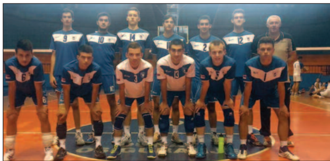
ОК Рибница 2 члан Друге лиге група Запад