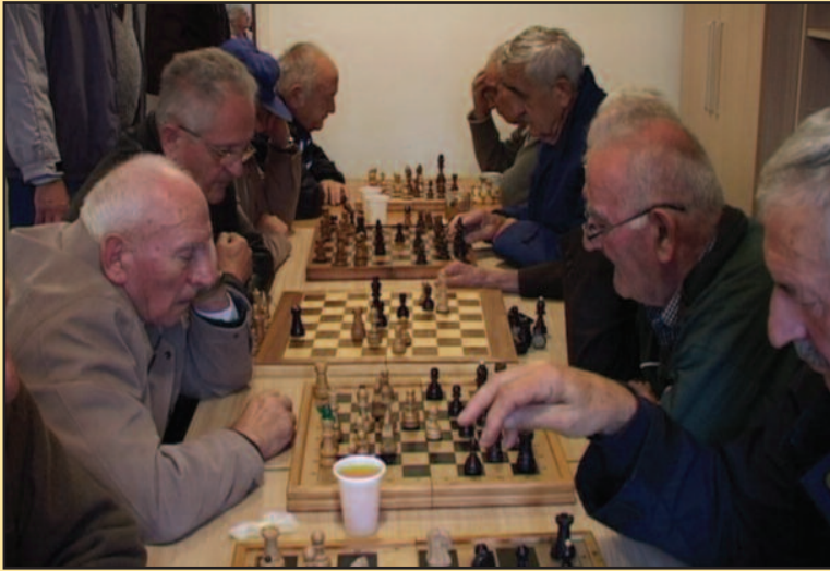
Поводом Дана старих први пут организован шаховски турнир

свакодневно до- р за старе. Сада ир у шаху. Ми се ално иновативни ачи. Њима је под- дршка, а не само Стари спадају у орију. Јако је мо да искористе цитете и да им ко би што дуже ционишу, нагла- нији из Центар за