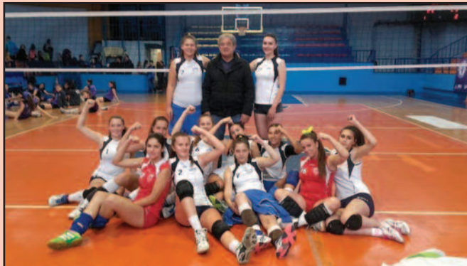
Одбојкашице Економца после победе на градском дербију