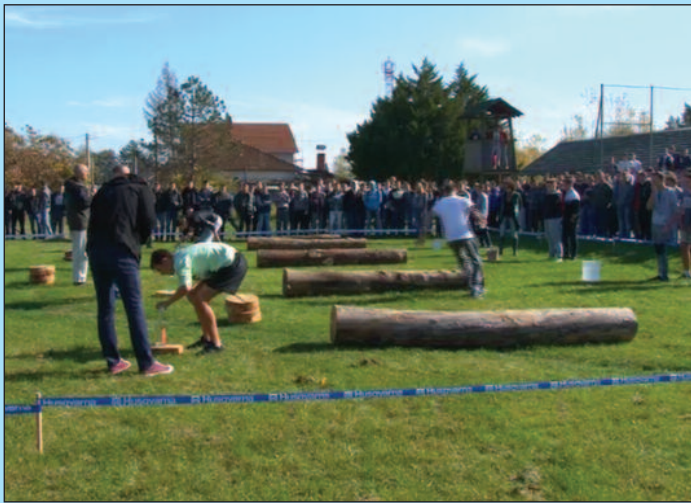
По три ученика из сваког одељења надметало се у шумарским дисциплинама

Овде смо већ трећу годину за редом и са Шумарском школом имамо добру сарадњу.