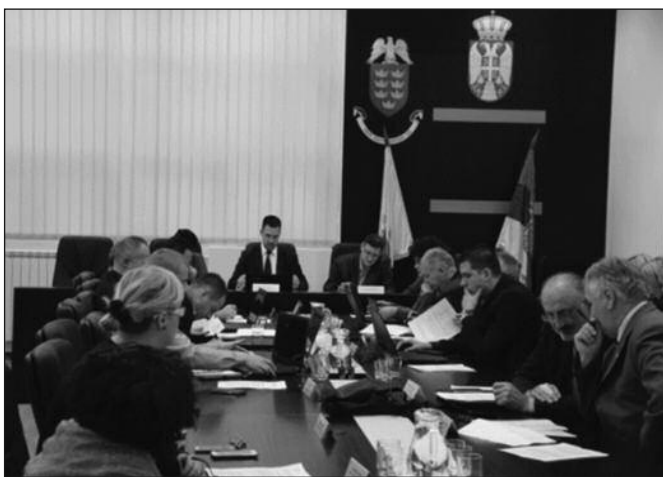
Одлуке Градског већа треба да потврди и Скупштина града