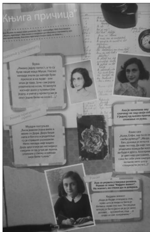
На панелима приказан цео живот Ане Франк

Када говоримо о основношколском узрасту, у питању су деца узраста од девет до дванаест година. За њих, изложба је више фокусирана на Ану Франк као писца, дакле на девојчицу која је још као врло мала волела да чита и пише. Када причамо о средњошколском узрасту, онда већи фокус стављамо на антисемитизам, на Холокауст и на нацизам у Европи од 1933. до 1945. године. Поносна сам и срећна да кажем да је ова изложба и више него посећена. Велики број наших основних школа најпре се одазвао нашем позиву да посете ову врло по-