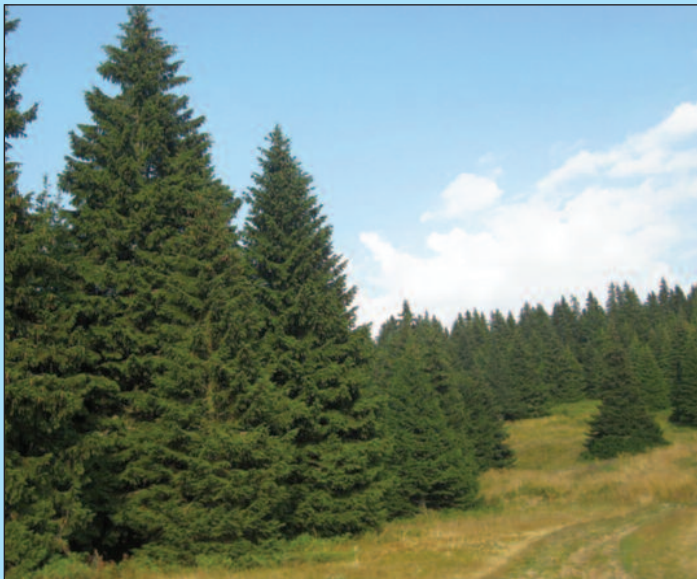
Већа заштита споменика природе-четинари на Голији

-На територији Краљева налази се девет заштићених природних добара. Заштићено природно добро највише категорије је парк природе Голија који се делимично налази на територији Краљева, а други део се налази на територији пет општина. Голија је заштићена и од стране UNESCO-а као резерват биосфере, а тај део који представља резерват биосфере налази се само на територији Краљева и Ивањице -