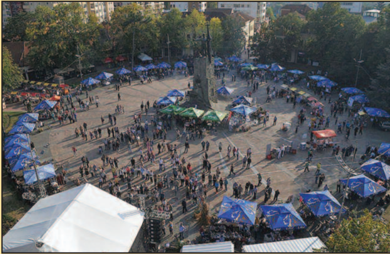
Краљево у знаку пасуља-градски трг за време манифестације „Сребрни казан“

Тријада која траје три дана, град је из буџета определио 800 000