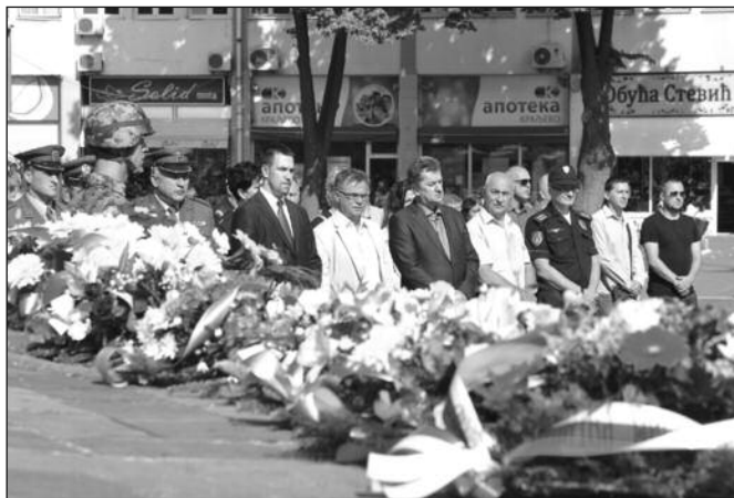
Обележавање херојског пробоја солунског фронта

последнице Првог светског рата, изгледа да ми као европска цивилизација нисмо ништа научили до дана данашњег, јер ратови трају и данас. Једини светао пример у целој тој причи јесте, без икакве патетике, управо српски народ који је, како је то негде и записано „уз божју милост водио борбу за достојанство и слободу ове земље“. На дан пробоја Солунског фронта треба да се подсетимо неких ствари када