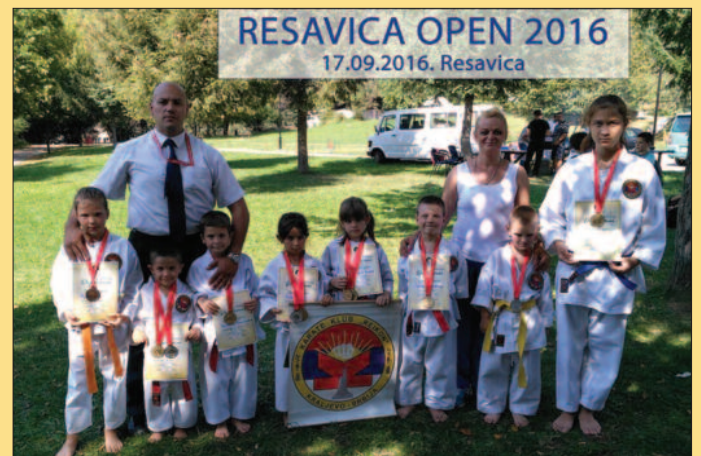
Реиконци у Ресавици