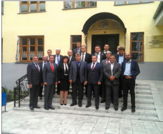
Сусрет краљевачке и тамбовске делегације

На сајму смо могли и да видимо најновије пољопривредне машине које су Руси почели да праве заједно са Ки-