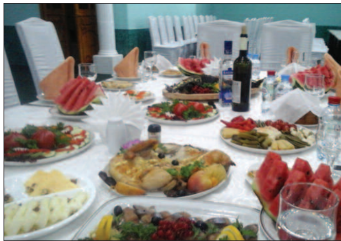
Богата трпеза у Мируинску-на трпези само органска храна

После завршетка првог дана конференције посетили смо и