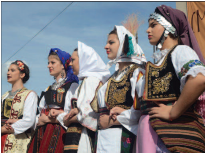
Да сачувамо културу и традицију-детал са смотре народног стваралаштва у Рибници

поклон за драге особе. Лицидерска срца су некада служила за удварање. Куповали су их момци девојкама, а свако срце је имало огледалце. Велико огледало било је симбол велике љу-