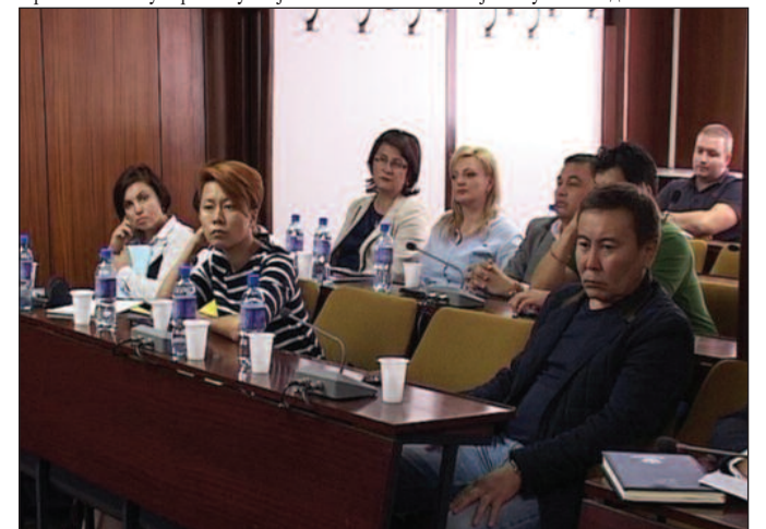
Заинтересовани за Краљево и Врњачку Бању-новинари и блогери из Казахстана

што имамо само ми у свету. Битно је да постигнемо да од сада па у будуће Србију не везују за нешто што се можда десило у прошлом веку, него за оно што је актуелно сада и оно што ће