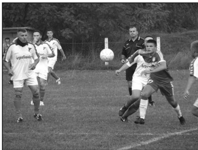
Силни Конаревци-детал са утакмице у Сирчи Морава-Будућност