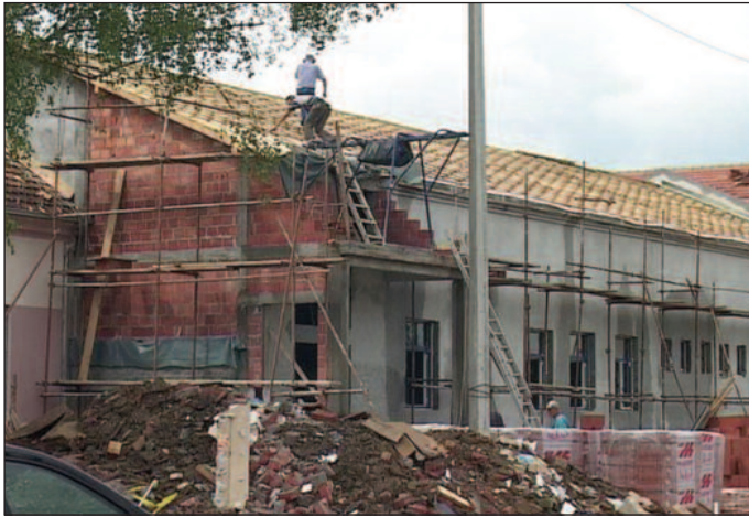
Радови готови 15. октобра-основна школа у Адранима

је за средства конкурисала код тадашње Канцеларије за поплаве, чији рад је финансирала ЕУ. Владина канцеларија за поплаве обезбедила је средства за прву фазу радова у износу од 9,4 милиона ди-