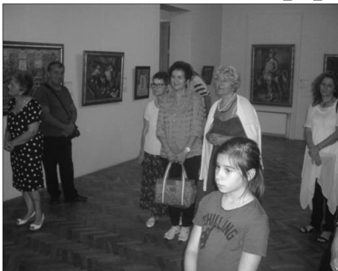
Свечано отварање изложбе „Арт тура“ у Замку културе

Настала са жељом да грађани Србије буду упознати са културним благом које је чувано у депоима Народног музеја, изложба Арт тура је предвиђена за излагање како на нетипичним местима на фасадама објеката тамо где је то могуће, тако и за типична галеријска места. Овде у Врњачкој Бањи јавности ће бити представљене 22 репродукције уметничких ремек дела која представљају избор из уметничких збирки наше и стране уметности у периоду од друге половине 19. до четрдесетих година 20. века.