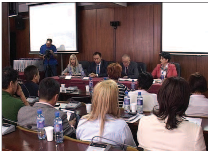
Казахстанци дошли да упознају Србију-детал са скупа у РПК Краљево

- Пре свега, ово је организација новинара и блог туре који долазе у Србију са циљем да упознају привредне и туристичке потенцијале. Основне делатности које су приоритетне у нашој будућој сарадњи, то је туристичка делатност, пољопривредна и прехрамбена индустрија и грађевинарство. То су правци сарадње које су трасирали наши председници у претходној посети. Хоћу у име амбасаде да изразим жељу да ми хоћемо преко ове туре, преко ове посете, да нашем народу и нашој земљи што више покажемо о Србији, како би те две земље биле више и боље информисане и како би могле знатно боље да сарађују у будућности - нагласио је шеф ми-