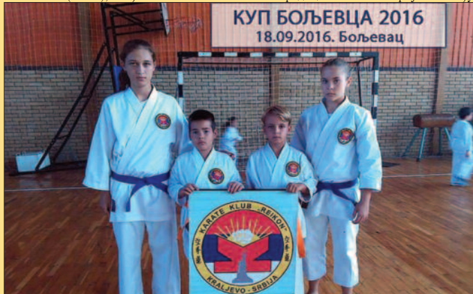
Вредна одличија освојена у Бољевцу