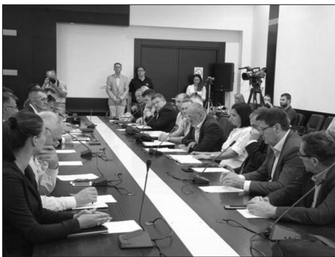
Детаљ са седнице Одбора за пољопривреду