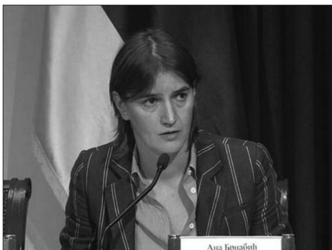
Министарка Ана Брнабић

-Неке јединице локалне самоуправе испоштовале су ту одлуку и биле професионалније и од централне власти, јер су рационализовале управу пре него што је донета одлука. Друге су имале много више запослених од онога што је прописано одлуком, а ми смо 2015. одлучили да