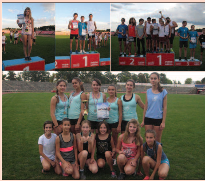
Краљевчанима подијум-успех младих чланова АК Краљево

Појединачно гледано, за Првенство Централне Србије, такмичари АК Краљево су освојили 11 медаља, три златне, четири сребрне и четири бронзане медаље. Шампиони Централне