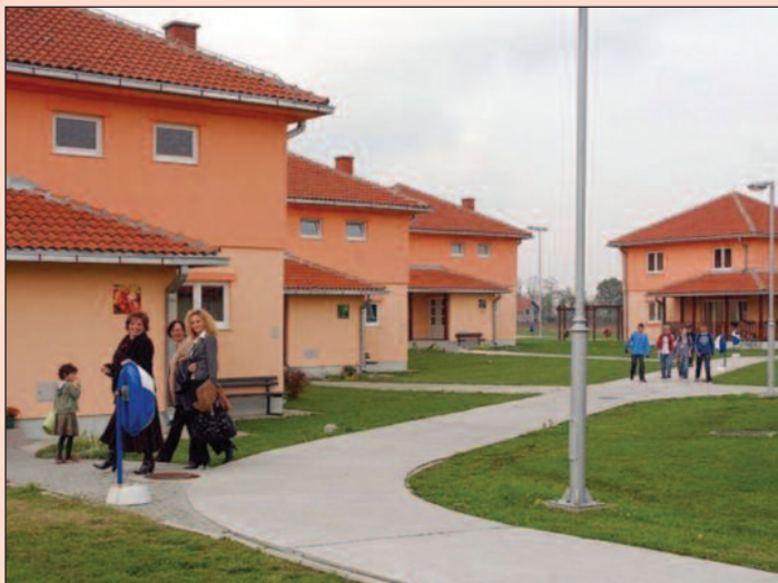
Школски дани у СОС Дечјем селу

Када се заврши настава, деца око учења и домаћих задатака