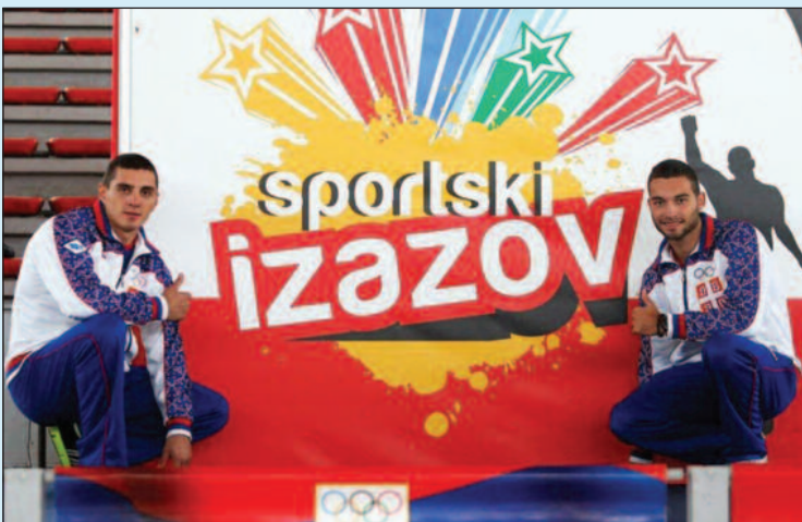
Најава спортског изазова

-Ја рачунам да ћемо уз једну озбиљну организацију која је