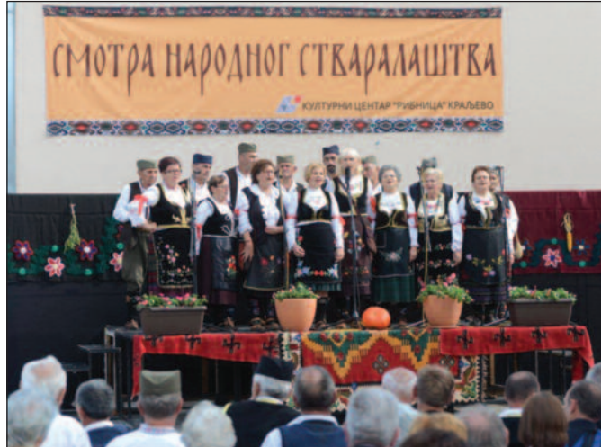
Наступ певачких група посебно запажен на овогодишњој смотри

бави. Кућице су ношене младенцима на поклон са жељом да што пре оснују свој дом. Истовремено је испред