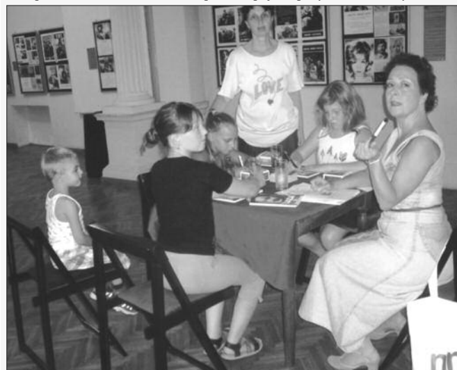
Аутор пројекта са полазницима радионице

дивни програм који је научно изучаван и потврђен MBA дисертацијом и заштићен на Универзитету у Батху (Енглеска), директор компаније „Steinvej“ је рекао да је то „напросто генијални приступ, нигде до сада виђен!“ И заиста је крајњи резултат био изузетан и