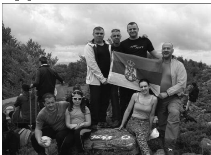
У походу Рудно-Радочело-Рудно нико није одустао