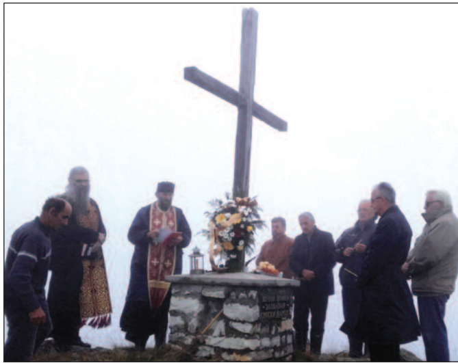
Помен крај Спомен-крста на Чемерну

нијим снагама аустроугарске војске у јесен 1915. године, на Чемерну је погинуло око 2.000 припадника "остатака" српске војске из Шумадијске и Дринске дивизије, Студеничког, Ужичког