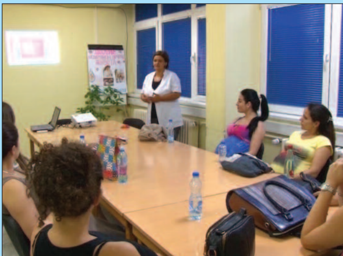
Сваког петка организују се предавања за труднице

-Ми акценат стављамо на перинатални период када треба посебну пажњу обратити на дојење и наглашавамо да треба наставити са тим како у болници тако и касније код куће. У служби поливалентне патронаже постоји школа родитељства која ради већ дуги низ година. Ми сваког петка организујемо предавања за наше труднице као и за чланове њихових породица који су и