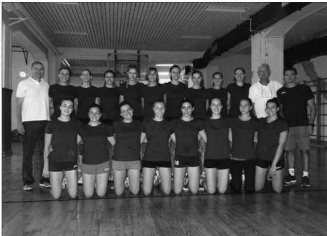
Нова сезона и нова екипа-ОК Гимназијалац на првом тренингу