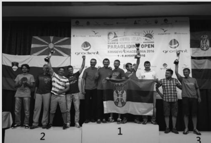
Прво и друго место освојиле екипе из Србије

Поред сјајних појединачних резултата Србија је остварила и фантастичан екипни пласман. У тимској укупној катего-