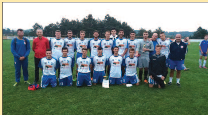
Спремни за зону-фудбалери краљевачке Слоге победници турнира у Рибници