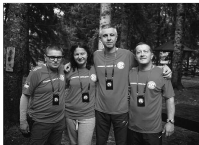
Успешно положили испит за планинарског водича

резултате постигнуте у спорту. А добили су и повељу „Капетан Миша Анастасијевић“ у организацији ПСК-а Србије и Медија