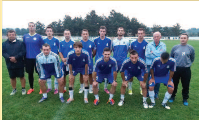
ФК Реал Подунавци најпријатније изненађење на турниру у Рибници

Утакмица за трофеј била је врло занимљива. Слога је преко Филиповића повела већ у 6. минуту и то је одлучило победника. Све после тога