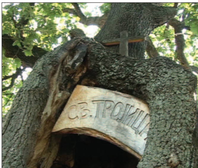
Унутар храста је црквица величине четири квадрата

Да тај знак крста који је урезиван у дрвећу буде наш чувар, рекао је свештеник Александар Јевтић.