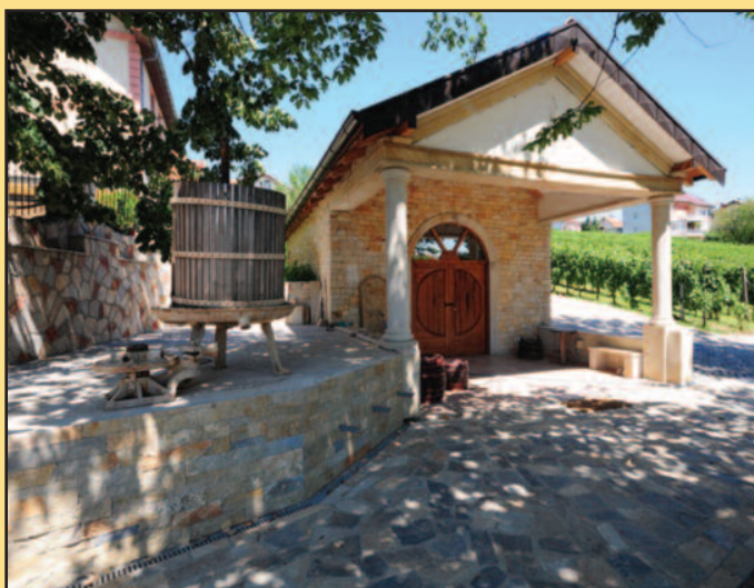
Винарија „Грабак“ употпуниће туристичку понуду Врњачке Бање

љубитељ вина зна да је тајна добродошлице вина у произвођачу. А да би чаробни нектар у вашој чаши заиста био чаробан, потребна је врхунска сировина, па због тога треба знати и када скидати грозђе с лозе, колико дуго га држати у бурету, колико дуго у флаши и на крају с којом храном га послужити. Да би то све било под конач