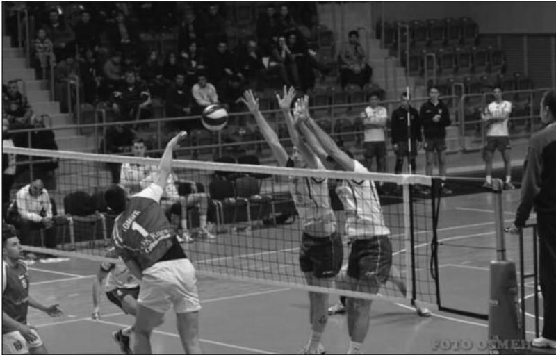
Рибница ће и ове године имати један млад тим

један млад тим, али и за годину дана старији што се тиче неког и тренажног и играчког искуства. Наш циљ и задатак је да и даље будемо у Супер лиги, да будемо у друштву најбољих. Сигурно је да немамо средстава да конкуришемо за она највиша места и пласмане у лиги, али исто тако имамо обавезу да Рибницу као клуб и Краљево као одбојкашки град задржимо у