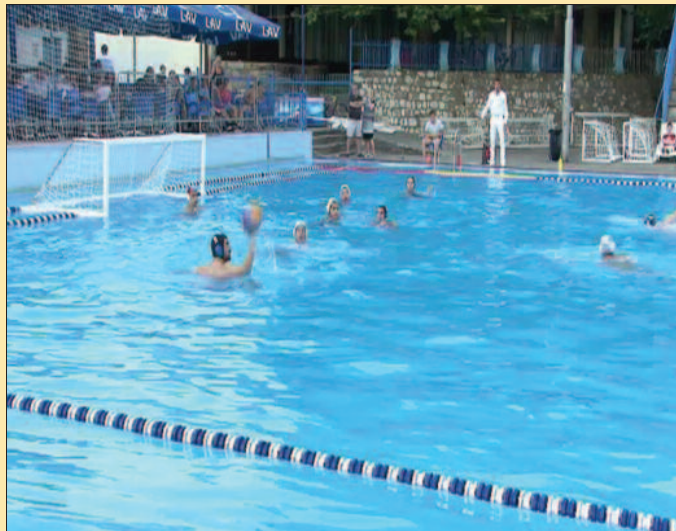
Начин игре није прилично играчима одређеног реномеа

„Нисам задовољан једном ствари, а то је да смо играли тотално безглаво и на један начин који апсолутно не приличи играчима одређеног реномеа, а искрено речено ни мени као тренеру. Знам да нисмо уиграли још увек и да су то играчи који су од скоро у Гочу, али требало је „стати“ на лопту и мислим да смо у односу на ових 11:7 много квалитетнија екипа него што то и сам резултат говори. Могу да разумем и нервозу, јер прва је утакмица у овој сезони, али мислим да је требало много више да се обрати пажња на ствари на које сам неколико дана пре ове