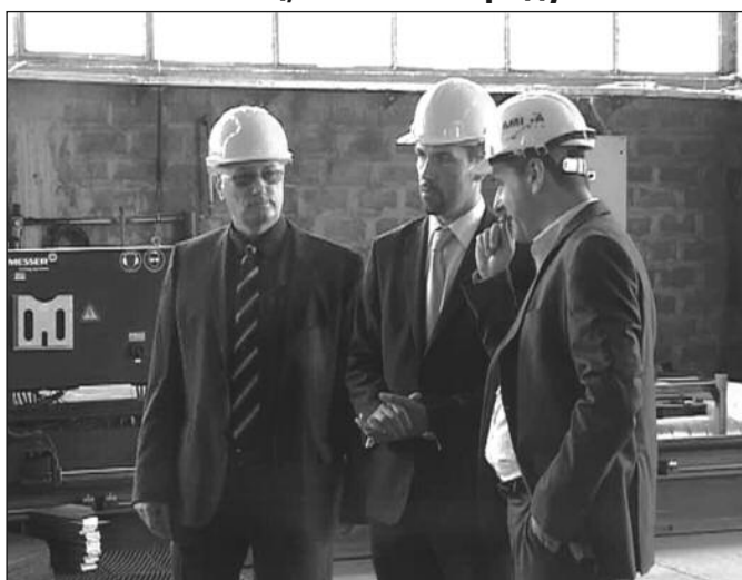
Град ће много већу пажњу посветити краљевачким привредницима

-У складу са мојом жељом за упознавањем производних капацитета краљевачке привреде обишао сам предузеће „Амига“ где сам се упознао са начином производње, а са власником „Амиге“ разговарају и о томе шта је план рада његове фирме у будућности. У наредним недељама и наредним месецима наставићу обилазак свих краљевачких предузећа која се баве производном делатношћу и оних предузећа која запошљавају велики број радника у