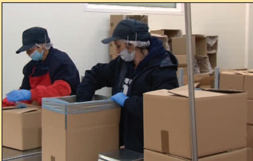
Малина са ушћанског подручја и у луксузним америчким хотелима

"Сикобери" заврши и у луксузним америчким ланцима хотела.