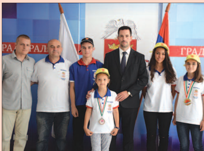
Приликом доделе средстава град ће значајније подржати ова два клуба

Чланове карате клубова ИПОН и СА ТА МИ који су и репрезентативци Србије, у новембру очекује и Европско првенство. Уколико да тада обезбеде финансијска средства, учествоваће на том великом такмичењу. У међувремену, наставиће са вредним радом и напорним свакодневним тренинзима како би остварили још добрих резултата на међународној сцени.