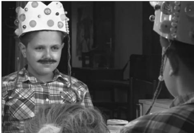
Млади Краљевчани показали изузетну креативност

Централна манифестација поводом прославе 160 година од рођења Николе Тесле у организацији Музеја Николе Тесле и компаније Самсунг одржана је на Калемегдану на дан рођења нашег најпознатијег научника. У оквиру изложбе која ће бити постављена све до 15. јула, први пут је изложен Теслин трансформатор, али и радови основних школа широм Србије које су учествовале на националном конкурсима "Буди као Тесла". Ова манифестација заокружује циклус активности у оквиру пројекта "Буди као Тесла" које Музеј Николе Тесле и Самсунг заједно са Заводом за вредновање квалитета образовања и васпитања континуирано спроводе од прошле године.