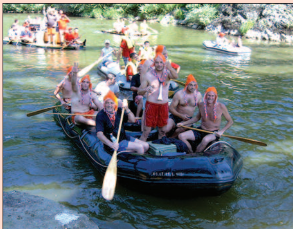
Спуст Ибром остаје у незаборавном сећању

Уочи „Веселог спуста“ по којем је Краљево постало препознатљиво широм Србије биће одржано и пар пропратних манифестација. У петак, 1. јула, на Градском базену ће у 18 часова бити одржане „Веселе игре“, а од 21 сат на Тргу српских ратника концерт ће приредити