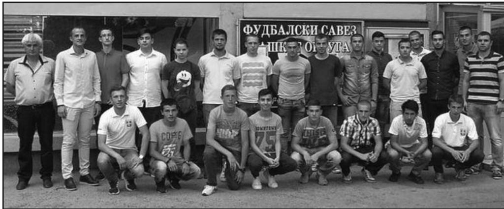
Полазници школе за фудбалске судије

начин осетити драж овог интересантног позива. Задовољни смо одзивом и надамо се да ће на прави начин схватити шта их очекује већ од јесена када ће добити прву прилику да одсуде праве мечеве - каже Трипковић.