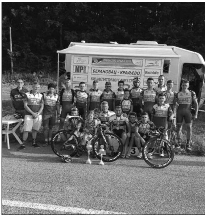
Одбранили титулу државног првака-бициклисти Металца

Само 24 сата касније, на аутодрому Берановац, одржана је друмска трка за државни