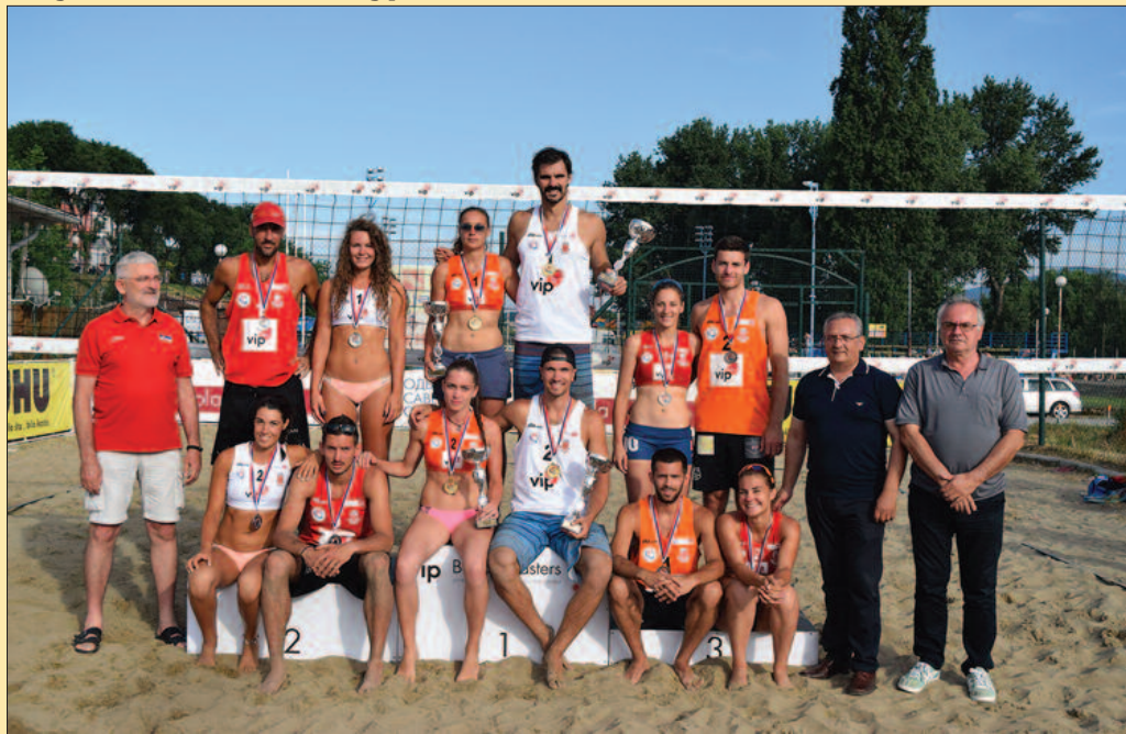
Заједничка фотографија победника, организатора и представника града

–Без драме очигледно не можемо. Финални меч као и онај у полуфиналу смо отвориле заиста