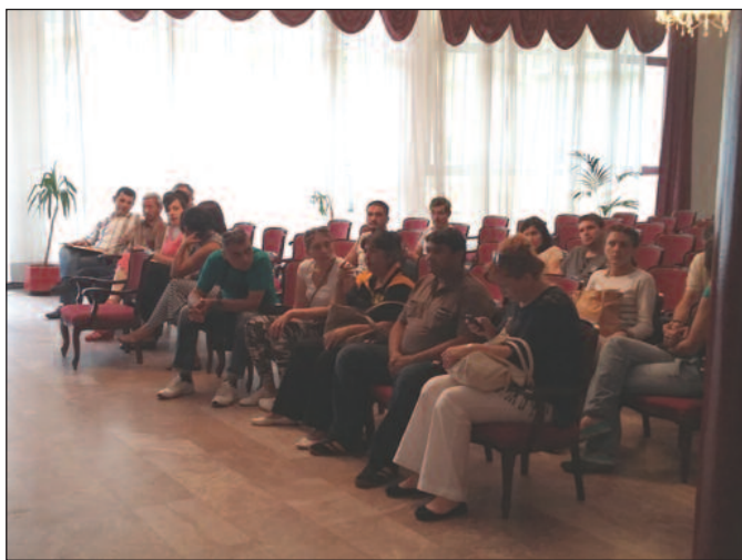
Потписници уговора већ су прошли пословну обуку

У оквиру пројекта „Смањење сиромаштва и унапређење могућности запошљавања маргинализованих и угрожених група становништва са фокусом на Ромкиње у Србији“ немачка организација "Хелп-Хилфе зур Селбстхилфе" у среду је потписала уговоре о донацији са 20 корисника грантова у опреми за самозапошљавање. Потписници уговора о донацији су 12 жена и осам мушкараца, од чега пет Рома и пет Ромкиња. Грантови у опреми се додељују за једну пољопривредну, 9 занатских и 10 услужних делатности. Између осталог подржани су кројачи, столари, фризерски, сакупљачи. По девет грантова је вредности 1.500 евра и 2.400 евра док су два гранта просечне вредности 3.600 евра.