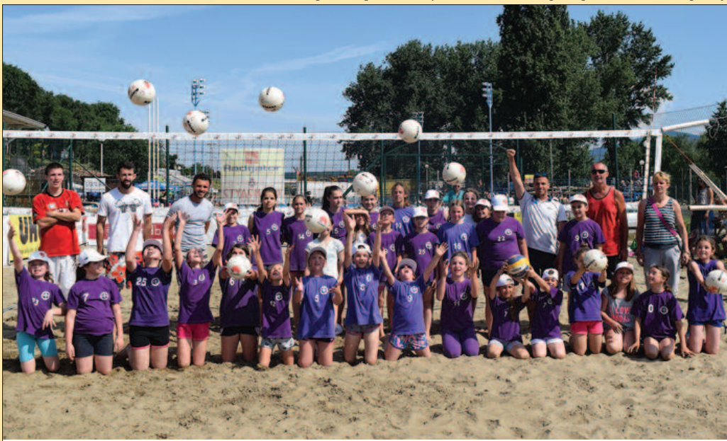
Школу одбојке похађало сто деведесет малишана