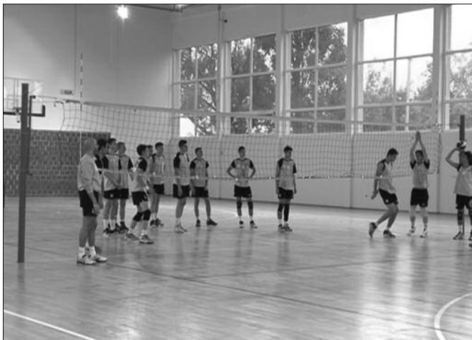
У Врњачкој Бањи одбојкаши имају сјајне услове за рад

- Планирани ток припрема овде у Врњачкој Бањи трајаће 10 дана, 16 момака је позвано из разних клубова из Србије. Ово је први пут да се ја као нов, први тренер кадетске репрезентације и момци који су већ имали учешћа, припремамо у Врњачкој Бањи. Овде тренутно имамо сјајне услове за рад. Нас очекује једно значајно првенство, које ће бити занимљиво, зато што је то првенство репрезентација у окружењу. Надамо се добром успеху. За сада план припрема тече у најбољем реду и онако како смо замислили. Што је најважније, момци су здрави, на тренингу јако ангажовани и мотивисани. Увек су игре за национални грб нешто што је посебно, истакао је нови тренер кадетске репрезентације Србије