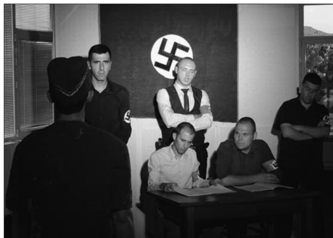
Чланови Бујановачког аматерског позоришта

Узбудљива, потресна и одушевљена прича о седмодневном суђењу командиру баракe 99 у којој