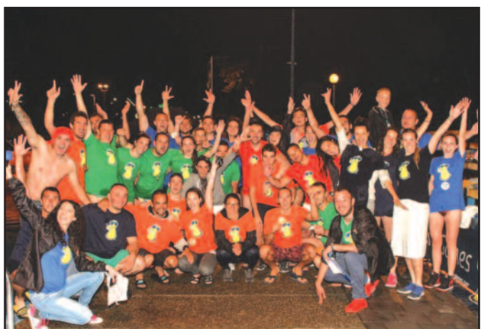
Поред Крагујевца у финале иду Краљево и Трстеник

припреме за финале на Златибору где ће бити одабана само