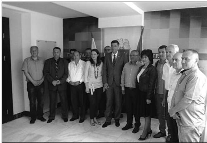
Чланови Градског већа у претходном сазиву

-Друга тачка дневног реда односила се на обезбеђивање средстава