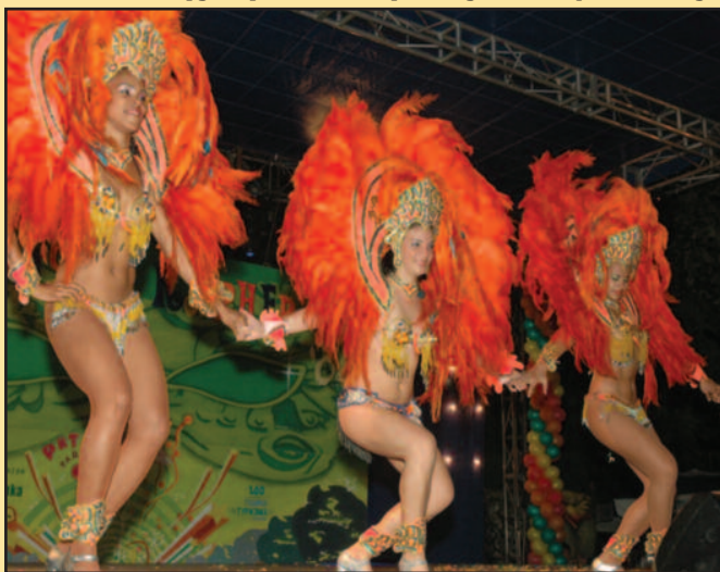
Бразилке ће бити прави доживљај за сећање

Централни догађај карневала је велика Међународна карневалска поворка која ће се одржати 16. јула са почетком у 10 часова, док је поворка за најмлађе резервисана за 13. јули са почетком у 19 сати,