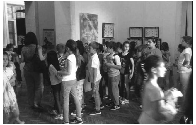
Најмлађи најбројнија и највернија публика

● У Врњачкој Бањи изложбу „Кроз свет инсеката Србије“ видело више од 2800 људи