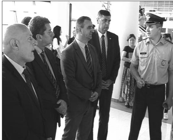
Циљ је да се пронађе модел који обезбеђује одржив развој

Аеродрома "Никола Тесла" није могла да буде раније, јер у овом тренутку ми најбоље финансијски стојимо. Направили смо најбоље пословне резултате. Аеродром "Никола Тесла" 2013. пословну годину завршио је са свега 120 000 евра у плусу. Данас има преко 26 милиона евра. Реализује се и лет за Америку што је велики резултат и успех ваздухопловства у Србији. Ми смо се сада окренули нашим пријатељима и дошли смо са конкретном помоћи. Следеће недеље мој технички директор, директор инвестиција ће бити овде, да