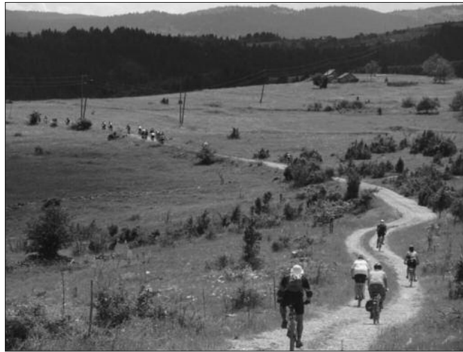
Бициклисти ће и ове године возити прелепим брдско-планинским пределима

- 30. јуна траса маратона се спушта до Пријепоља, где ће се, на платоу испред Дома културе, као промоција маратона, направити дужа пауза. Из Пријепоља траса се, преко Душманића и Ђуришића, пење на планину Јабуча, до граничног прелаза са Црном Гором. Од граничног прелаза траса се креће макадамским путевима преко Отиловића и манастира Свете