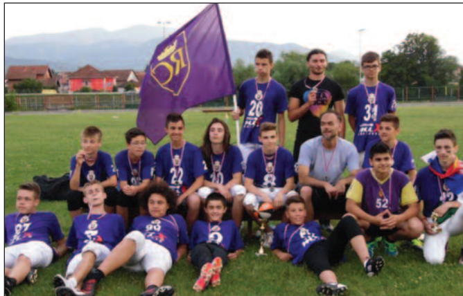
„Краљевске круне“ показале да су одлични домаћини

У последњем мечу се уједно одлучивало о титули. Инђија Индианс, од када се у СААФ игра флег фудбал су једини клуб чија се екипа пласирала сваке године на финални турнир флег лиге. Са друге стране Краљево Royal Crowns је клуб који од када се уопште у Србији игра флег фудбал, од 2007. године, није успео да се пласира само на један, прошлогодишњи финални турнир, због смене генерација, али ове године та нова генерација је дошла до финала. Ове сезоне флег тим