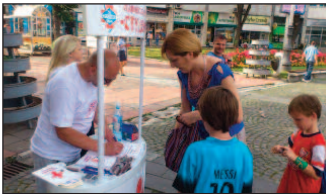
Потписано више од двадесет донаторских картица

живот", чланови Краљевских круна су још пре годину дана постали донатори органа, а су само наставили ову веома важну кампању.