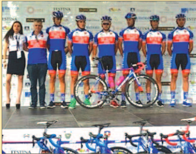
БК Металац из Краљева на трци кроз Србију