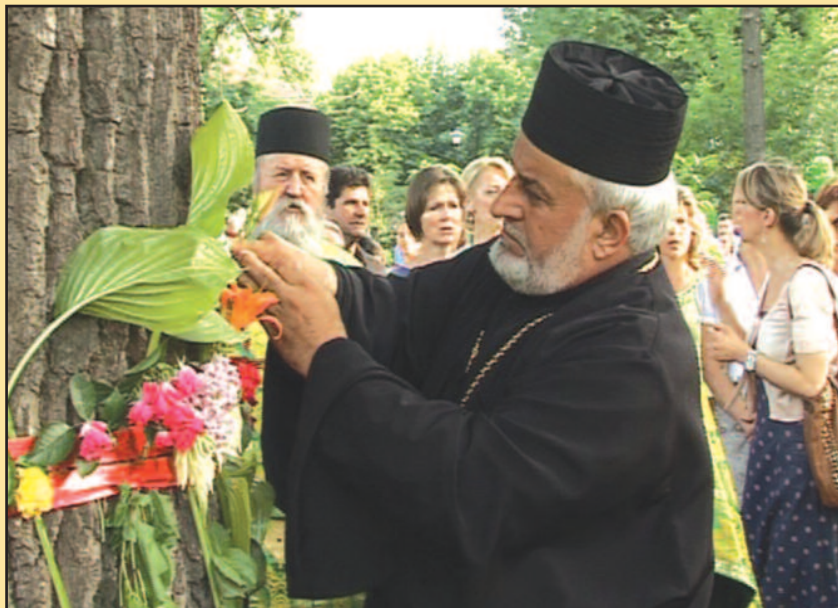
У дворишту Духовног центра освештан Запис-заштитник града

припадници Министарства унутрашњих послова који такође славе исту славу.