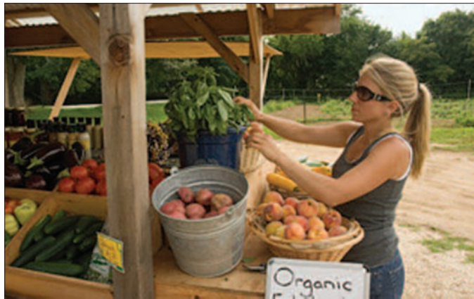
Под органском производњом ни пола процента коришћеног пољопривредног земљишта

Највише се извози воће ниског степена прераде – концентрати воћних сокова, сушена купина, вишња, малина, биље и печурке, као и смрзнута шљива, малина, купина, јагода, вишње и пире од дуња.