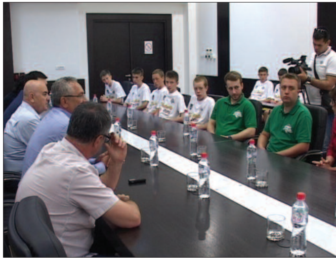
Гости одушевљени гостопримством и дружењем

Гости из Пољске веома су задовољни гостопримством и јако им се допада наш град. Посета Краљевоу ће им бити једно ново и