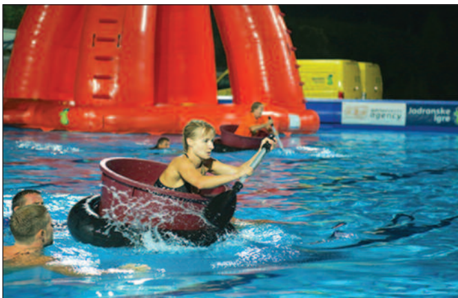
Такмичарске дисциплине нуде прегршт забаве и адреналина

Игре су основни садржај овог пројекта, а осмишљене су тако да забаве публику и такмичаре, али и да подстакну вредности попут