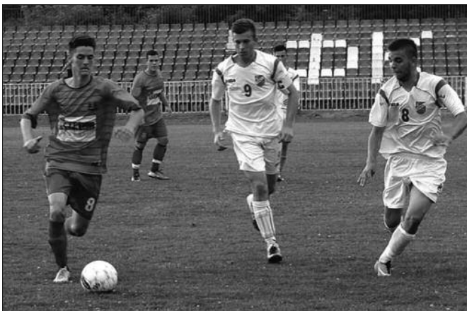
Детаљ са утакмице омладинаца Слоге и Радничког

Само пар стотина метара даље од Градског стадиона, на чувеном стадиону код Ложионице, одиграни су бараж мечеви за улазак у Квалитетну кадетску фудбалску лигу Србије. Кра-