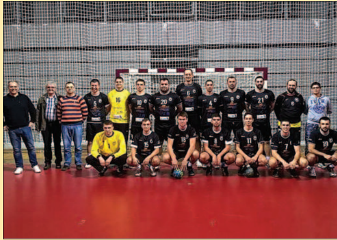
РК Металац завршио сезону и обезбедио опстанак

Металац је доживео и неколико несрећних пораза, иначе би пласман био и бољи.