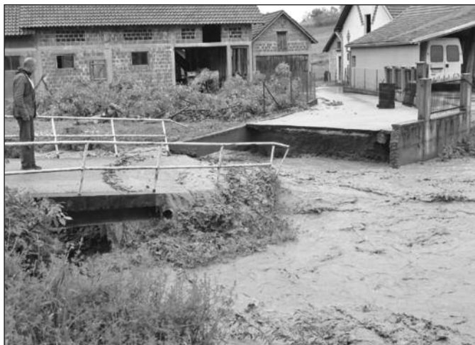
Нерегистрованим газдинствима нису помогле ни интервенције градоначелника

милиона динара. Велики број ораница нашао се под водом и то су углавном оранице које су и у мају 2014. године такође биле поплаване. Накнада за причињену штету је одређена и износи 12.000 динара по хектару. Под водом се у марту 2016. године нашло око 1.600 парцела. Међутим, само ће регистрована пољопривредна газдинства остварити право на накнаду штете.