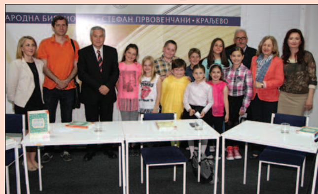
У зборнику и песме пет краљевачких писаца

У Цветнику су песме 190 песника, учитеља, васпитача, професора, доктора наука и библиотекара из Србије и региона, односно из Црне Горе, Босне и Херцеговине, Републике Српске, Македоније и