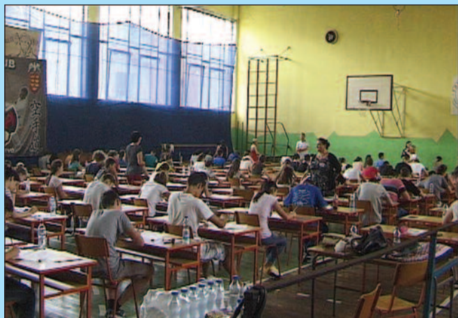
За десет дана мале матуранте чека велики задатак

• 30.05-10.06.2016: пријављивање у школским управама, ванред-