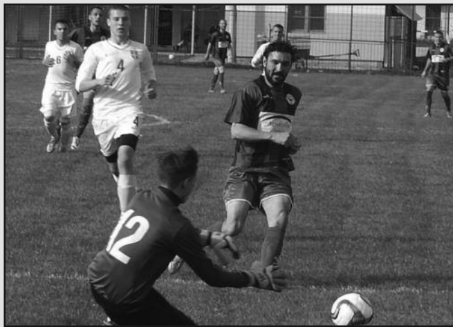
Детаљ са једне утакмице Карађорђа на Буњачком Брду