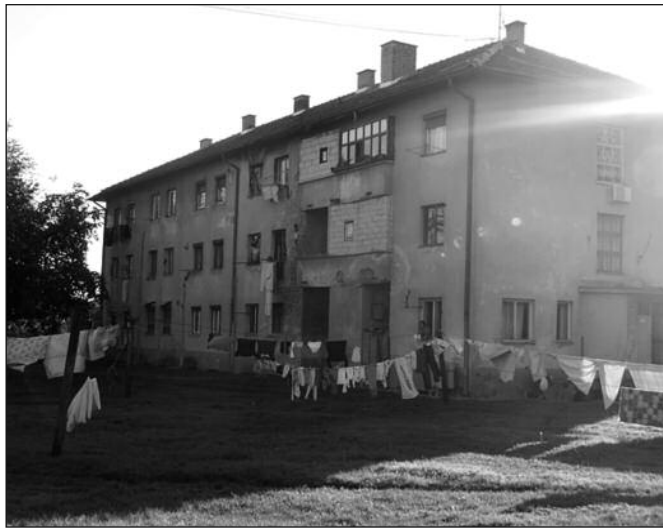
Прва зграда се гради на простору између постојећих објеката

До краја јуна јавности ће бити познати услови за расписивање јавне набавке, затим ће бити