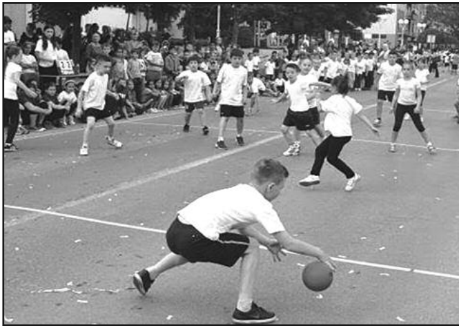
Победницима бесплатно путовање на првенство у Београду 2016

игара је 7. јуна у 9 сати и 30 минута на Тргу српских ратника – код Милутина. Спортски терени на којима се организују такмичења биће спортска дворана на кеју, отворени терени за кошарку и мали фудбал под обалом, просторије Шах клуба "Слога", ОШ „Димитрије Туцовић“ и сала Гимна-