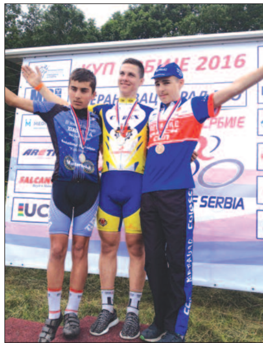
Млади бициклисти Металца на подијуму у Берановцу