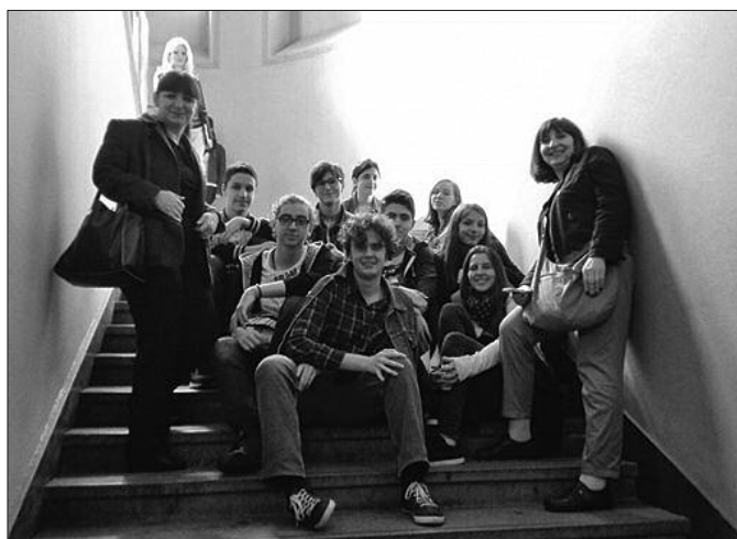
Гимназијалци желе и награде на такмичењу у Тршићу

- Књижевна олимпијада је специфично такмичење и теже је у односу на нека друга такмичења због извесне неодређености. Тачније, ученици никада нису сигурни шта ће добити од питања, јер у једном делу може да се постави и до 1000 питања. Али наши ученици су се изванредно снашли и постигли су изузетне резултате. Максималан