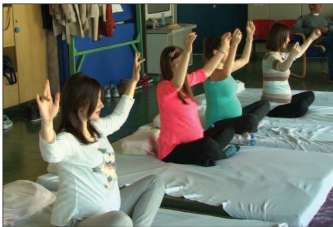
У рад Школе за психофизичку припрему укључен и психолог

- Служба за здравствену заштиту жена већ дуги низ година континуирано спроводи психофизичку припрему трудница, али до сада без стручне психолошке помоћи и активног учешћа психолога. Град Краљево је препознао потребу коју су исказале наше пацијенткиње приликом посете Саветовалишту за труднице, тако да је у рад Школе за психофизичку припрему укључен и психолог, који са трудницама ради по облицима групног, али и индивидуално-саветодавног рада и то како са трудницама у физиолошкој уредној трудноћи, тако и са трудницама у високоризичној трудноћи. Током овог пројекта планирано