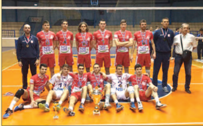
Јуниори Војводине НС семе прваци Србије

„Веома сам срећан овим проглашењем, а још више нашом титулом. Дошли смо у Краљево да будемо најбољи, да одбранимо трофеј и ушли смо у томе. Веома тешко так-