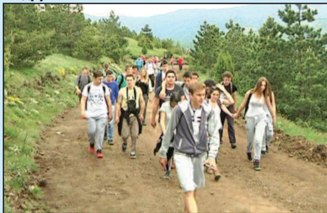
Највише је било младих, али је стазу савладао и један деведесетогодишњак

-Планинарско - еколошки клуб „Гора“ сваке године у оквиру својих активности доводи групу планинара