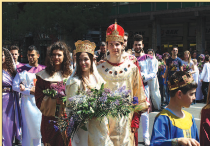
Манифестација у знак сећања на краља Уроша и принцезу Јелену Анжујску

Манифестација „Дани Јоргована“ почиње 21.маја у осам часова ујутру када се организованим превозом полази у манастир Градац, где ће се одржати културно уметничка манифестација на којој учествују чланови културно-