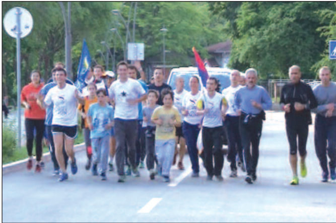
На путу по Србији бакља мира пронета кроз Краљево

-Ми трчимо по целом свету са упаленом бакљом која симболизује мир, хармонију, пријатељство, љубав, поштовање и толеранцију међу људима без обзира на расу, боју коже, припадност било политичку или верску. Ми покушавамо трачањем да послужимо као пример и да инспиришемо људе кроз стазу којом трчимо, а претрчимо доста миља и километара и да усмеримо све људе у правцу мира, јер мислим да је мир нешто што је тренутно на планети земљи најпотребније. Јер ако немамо мир, даба нам све. Прво, најважније је да свако од