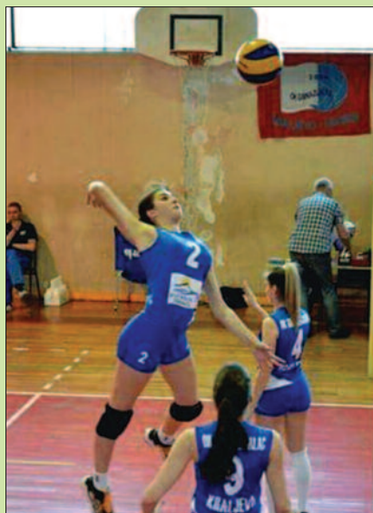
Одбојкашице Гимназијалца у акцији

ЈЕДИНСТВО (СП) – ВИЗУРА 3:1 (27:29, 25:14, 25:22, 26:24)