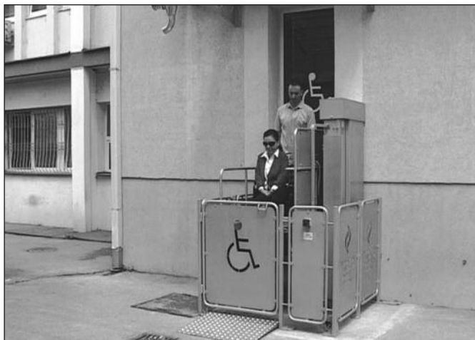
Особе са инвалидитетом без проблема могу да користе услуге краљевачког ПИО

-Све институције у оквиру овог Министарства морају да буду максимално доступне свим особама са инвалидитетом и њихов хендикеп не сме да буде препрека да остваре сва своја права. Очекујем да ће се