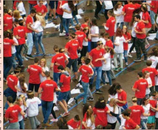
Овогодишњи матуранти били првачићи у време првог плеса

Краљево је први град у Србији који се 2005.године укључио у ову манифестацију и до сада су претходне генера-