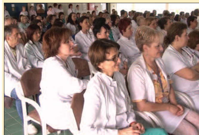
Награђене сестре сигурно ће оправдати најбоље оцене