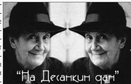
„На Десанкин дан“

Програм је одржан на Мосту љубави, који је био мотив да Десанка Максимовић приликом једног од