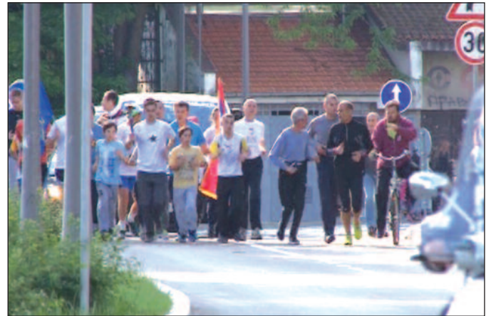
Ако трчимо у миру можемо да живимо заједно у миру и пријатељству

се 8. октобра у Риму у Италији. На путу кроз нашу земљу проћи ће кроз Нови Пазар, Рашку, Врњачку Бању, Трстеник, Крушевац, Про-