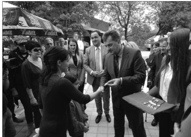
Начелник Округа Симовић уручује кључеве будућим станарима

– Висина закупнине за ове станове одређена је одлуком Градског већа и она износи у просеку 7 300 динара за један овакав стан. Суштина тог закупа јесте оснивање фонда из кога ће се даље зидати зграде, градити станови на новим локацијама и тако решавати потребе управо ове категорије становништа. Својина ових станова је јавна, станови остају у власништву града Краљева, наши станари су потписали уговор са ОСА на три године, уз могућност обнављања истих уговора сваке три године, нагласила је, предајући кључеве станова будућим стана-