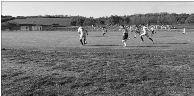
Детаљ са утакмице Слога-Железничар