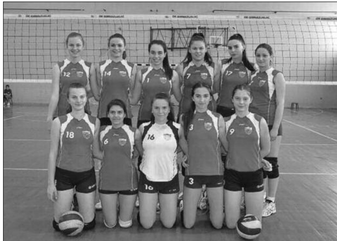
ОК Економца победник последњег градског дербија

инспирацију да слаavimo против градског ривала и новог прволигаша. Одиграли смо заиста добро и да смо у неким претходним утакмицама били овако расположени, вероватно би смо били у позицији да уђемо у Прву „Б“ лигу.