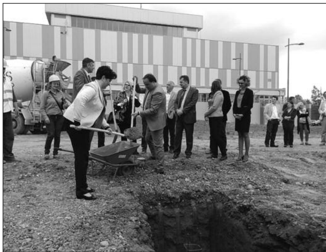
Постављање камена темељаца будућег затвореног базена

-Затворени базен је веома битан због здравог живота свих суграђана, поготово школске деце и омладине. Желимо да поправимо, да побољшамо квалитет живота у Краљеву са једне стране, а са друге нам је веома битан спортски туризам. Када повежемо нову дворану, сутра затворени базен, па спортско село на Гочу, које би у наредне четири године морало бити готово и Врњачку Бању, као тренинг базу најбољих српских ватерполиста и одбојкаша, онда добијамо једну целину, озбиљну спортску понуду на нову Републике Србије. Могао бих да кажем и региона, јер не треба заборавити аутодром Берановац и све наведено ће бити знак распознавања за овај крај, истинска спортска база. А спорт спада у пет најбољих привредних грана у свету. Рачуници изведите сами, са поносом је