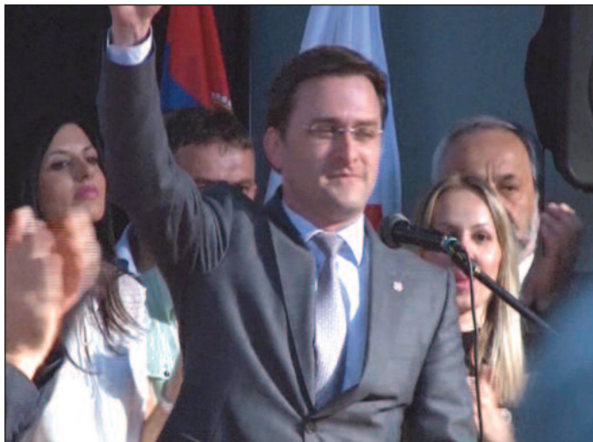
Никола Селаковић: Ви сте пробудили овај град