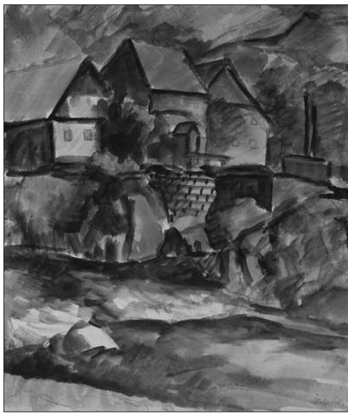
Пејзажима на изложби посвећена једна тематска целина

Михаило Петров се родио у Савамали 1902. године, основну школу и гимназију је учио у Београду, као и Уметничку школу коју је уписао 1919. године. Али, током краткотрајног похађања наставе, одбацио је класичан метод академског образовања као превазиђен. Сусрет са репродукцијама радова немачких експресиониста у авангардном часопису „Der Sturm“ је на њега оставио трајан утицај. Школовање је на кратко