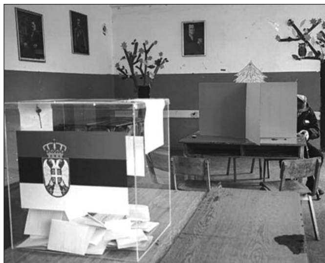
И овог пута у Краљеву ће бити отворено 129 ирачких места

- Републичка изборна комисија је донела одлуку о координирању и спровођењу парламентарних и локалних избора. Том одлуком је предвиђено да бирачки одбори у проширеном саставу именовани од стране изборних листа које учествују само на локалу, не смеју учествовати у утврђивању