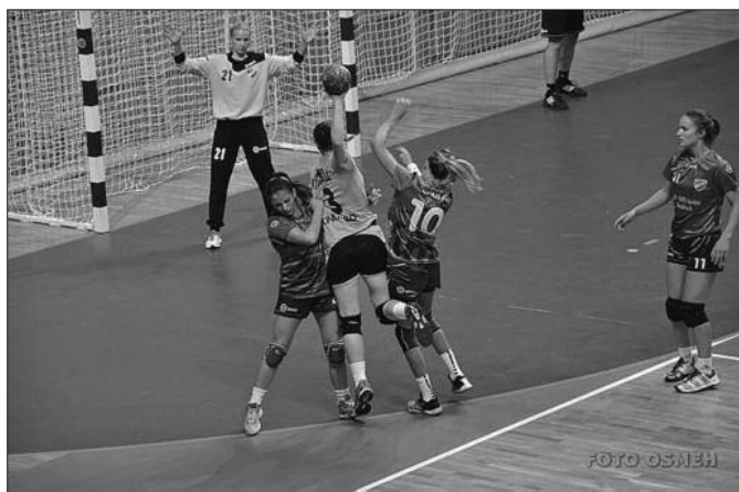
Детаљ са утакмице рукометашица