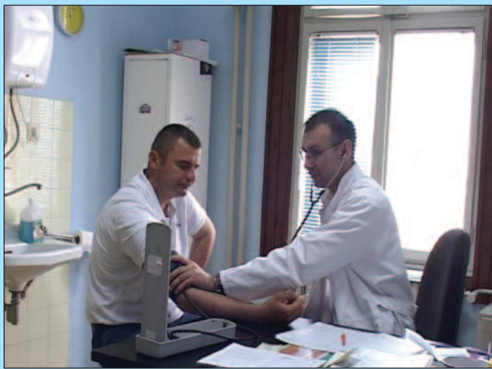
Друга смена радиће понедељком, средом и петком

Бројни мештани, који су се окупили испред амбуланта,