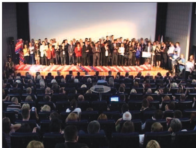
На републичкој и локалној листи велики број стручних младих људи

Присутнима се на конвенцији обратио и кандидат за народног