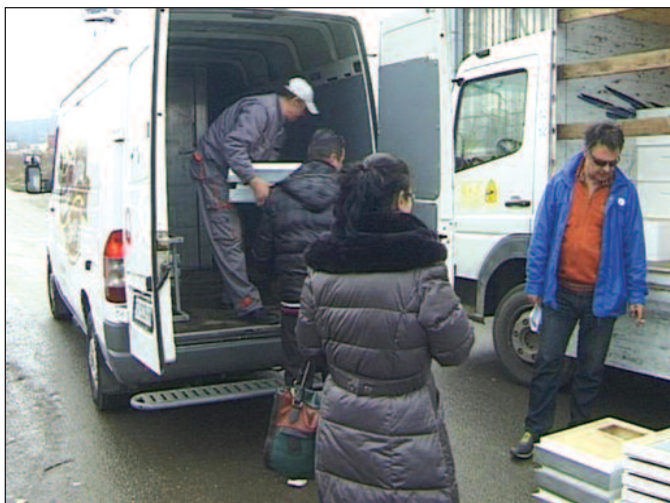
Помоћ пчеларима како би наставили да се баве пчеларством