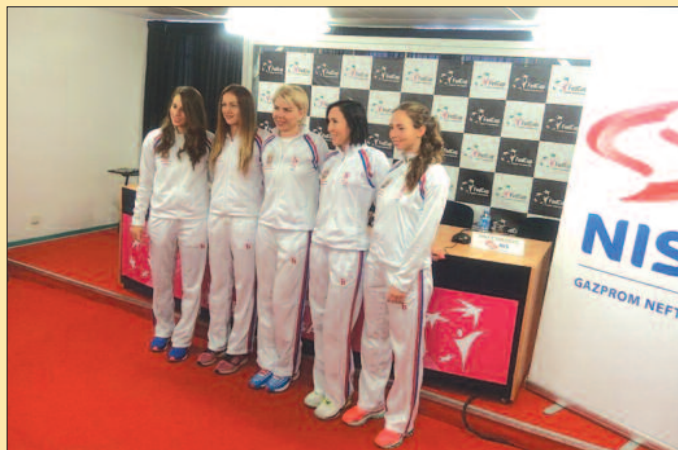
ФЕД Куп репрезентација Србије у пуном саставу

Тениска Србија се и овога пута брани у Краљево, нашим хероинама је потребна громогласна подршка са трибина. Баш онаква какву су имали Ноле, Виктор и Зики годину дана раније. Карте за ФЕД