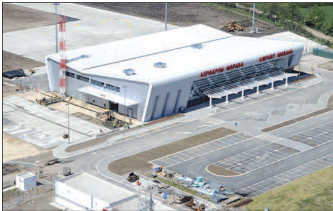
У опремање авиона до сада уложено десет милиона евра

цију, како би био пријављен за цивилне летове. Та одлука је донета