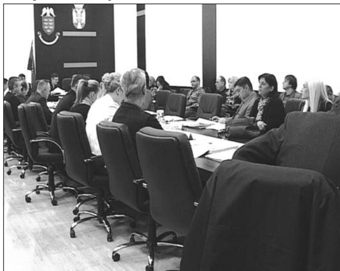
Усвојен предлог о накнади трошкова председницима савета месних заједница

- Ми смо ову одлуку поново донели и надам се да ће је Скупштина