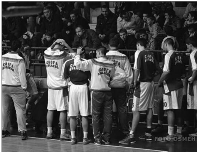
После Београда глава боли - кошаркаши Слоге на тајм ауту