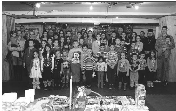
Прослава клубске славе Светог Саве у КК Реикон