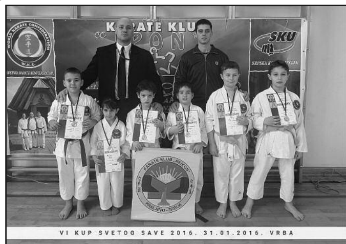
Освајачи медаља на такмичењу у Врби

Под слоганом „Браним себе, не нападам тебе“ краљевачки