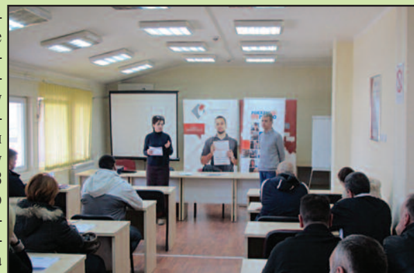
Бесповратна средства у износу од 240.000 динара

На евиденцији кра- љевачке Филијале НСЗ налази се ве- лики број незапосле- них лица који имају жељу и намеру да по- крену сопствени посао и постану предузетници. НСЗ кроз обуку „Пут до успешног предузет- ника“ и доделу сред- става за самозапошљавање излази у сусрет својим корисницима