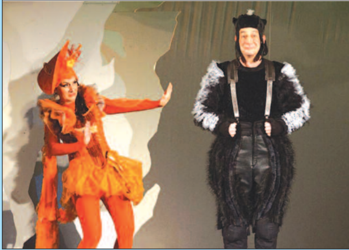
Детаљ из представе „Ивица и Марица“

Једна од најбољих домаћих драма 20. века и представа која траје