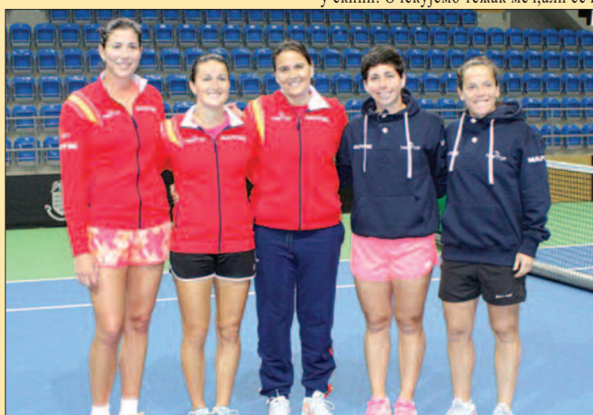
Слове за фаворите - тенисерке Шпаније на тренингу у Краљево