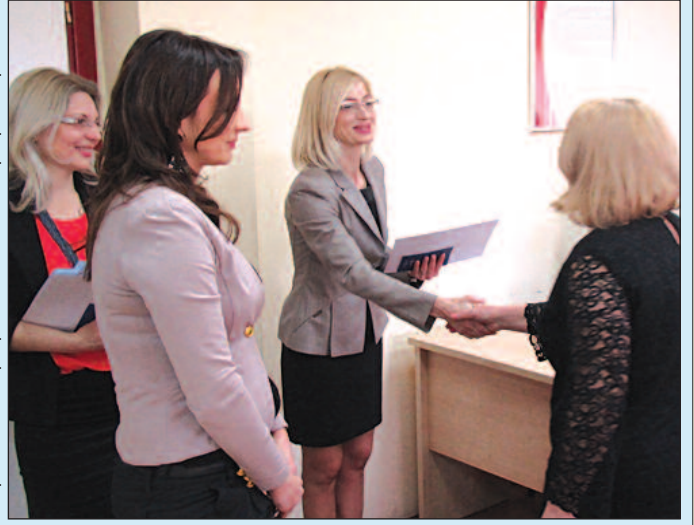
Свечана додела сертификата о завршеној обуци

Организовање обука за тржиште рада је стандардни део актив- ности Националне службе за запошља- вање. Анкетирањем по- слодаваца на терену, приликом свакодневних контаката саветника за запошљавање и наших клијената, добијају се информације о траже- ним занимањима, зна- њима и вештинама цењених на тржишту рада. У циљу подизања компетенција незапо- слених лица и повећања њихове запошљивости, Филијала Краљево је ор- ганизовала у 2015. години 4 обуке за тржиште рада на територији града Кра- љева. На тржишту рада у Краљеву постоји већи број текстилних предузећа, а већ дуже време Краљево нема текстилни смер у школама, тако да се осећа дефицит тек- стилних кадрова. Десет незапослених лица добило је прилику да се обучи за посао кројача и шивача. Оно што послодавци који послују са иностранством нарочито цене јесте познавање страних језика и рада на рачунару. Десет лица је похајало обуку за немачки језик нивоа А2, а осам лица ен- глески језик нивоа Б2. За најугроженију