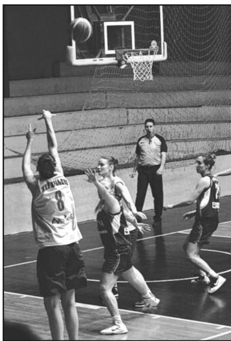
Малене без пардона - детаљ са утакмице кошаркашица

-Искрено, мало сам се прибојавао овог меча, јер Врбас је стварно добра и искусна екипа. У првом делу сезоне су нас убедљиво победили, тако да смо прилично