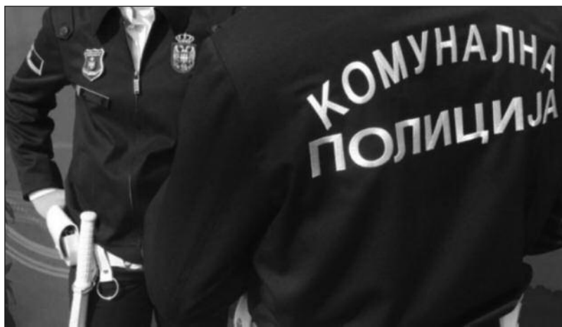
Комунални полицајци ће убудуће моћи да раде и у цивилу

- То се односи на делове где није било могуће спроводити неке одлуке града са униформама и ознакама на униформама. Тако да ће се у цивилу лакше решавати проблеми. Измене и допуне закона предви-