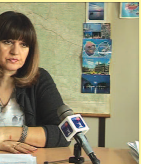
ник Одсека за заштиту животне средине

јајављују постављање шест нових киштри за одлагање биће набављено 70 контејнера који ће бити размеш- раљево ће, заједно са још 4 града, конкурисати код о би се регулисало управљање отпадом