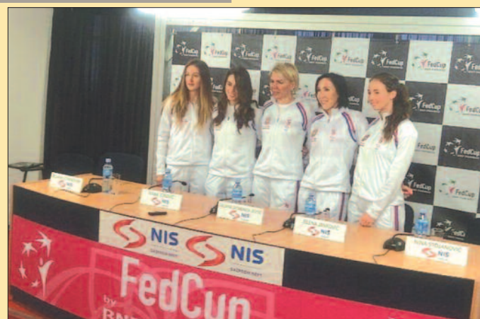
Пуне оптимизма: тенисерке Србије

-У Аустралији сам имала руптуру рамена. Било ми је баш лоше, нисам могла никако да се спремам. Надам се да је та повреда прошлост, на петом континенту сам и почела праве тренинге, овде наставила и верујем да ћу бити у стању да одиграм најбољи тенис и помогнем репрезентацији да оствари тријумф. Атмосфера у нашем тиму је сјајна, сви дишемо као један и заиста сам оптимиста – нагласила је у првом