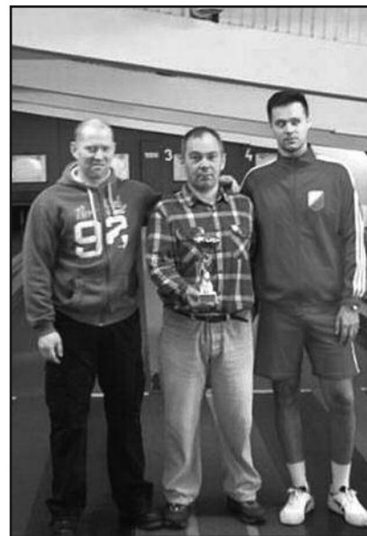
Најбоља тројица са Божићног турнира

да покушамо до јесени да нешто урадимо са кугланом, али како сада ствари стоје, не надамо се бољем.