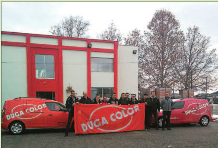
Две деценије успеха - радници Дуга колора