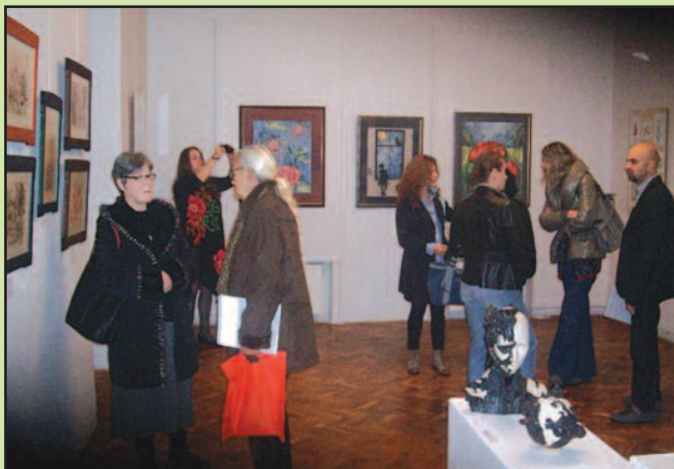
Подсетник на 2015 - Врњачки ликовни круг

Музички програм се реализује од краја априла до краја октобра, због услова грејања објекта, мада је ове године умерена сезона на крај децембра, организовањем новогодишњег клави-