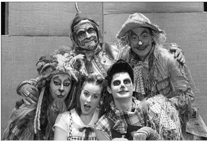
Глумци краљевачког позоришта у представи „Чаробњак из Оза“

Божји фестивал Крушка – Крушевачко позориште (са представом Чуvari природе); Фестивал професионалних позоришта Србије ЈОАКИМ ВУЈИЋ ШАБАЦ (Чаробњак из Оза), на коме је стручни жири доделио награду МАЛИ ЈОАКИМ за најбољу представу у целини; Херцегновске априлске позоришне свечаности ХАПС – Херцег Нови, Црна Гора (Чуvari природе, Да ли је то била шева); Међународни фестивал