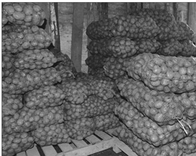
Опасност – ускладиштени кромпир

Губици током складиштења се односе на тежину и квалитет. Степен губитка се може смањити редовном контролом влажности и температуре у складишту. Ово зависи од сорте кромпира, појаве болести, руковању кртолама приликом вађења и др. Најбољи начин чувања је у бокс-палетама. Предност бокс-палета је у приступачности свежег ваздуха, лакше манипулације, кромпир се боље чува и слично. Кртоле кромпира у просеку садрже 80 одсто воде. Након