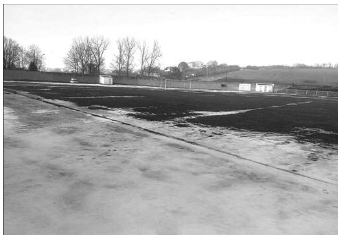
Нема тренинга на леду - терен градског стадиона