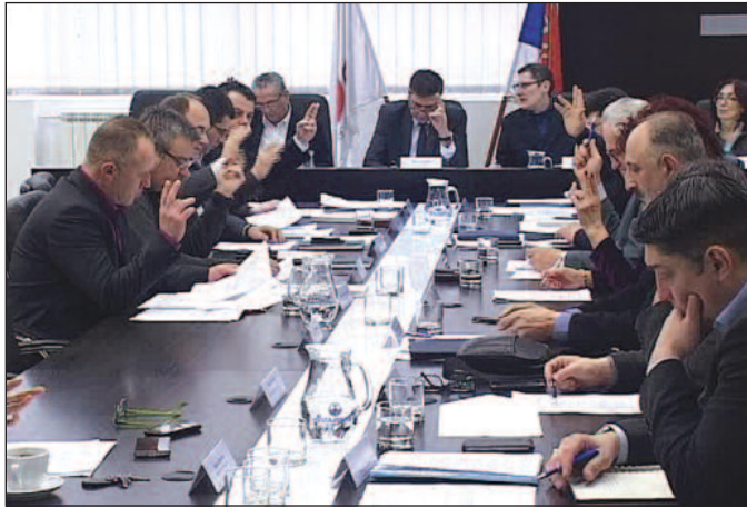
Премијерна седница Градског већа у 2016. години

-Ми смо требали да израдим пројектни задатак како би се кренуло у јавно - приватно партнерство. Међутим, пошто је било сукоба интереса и