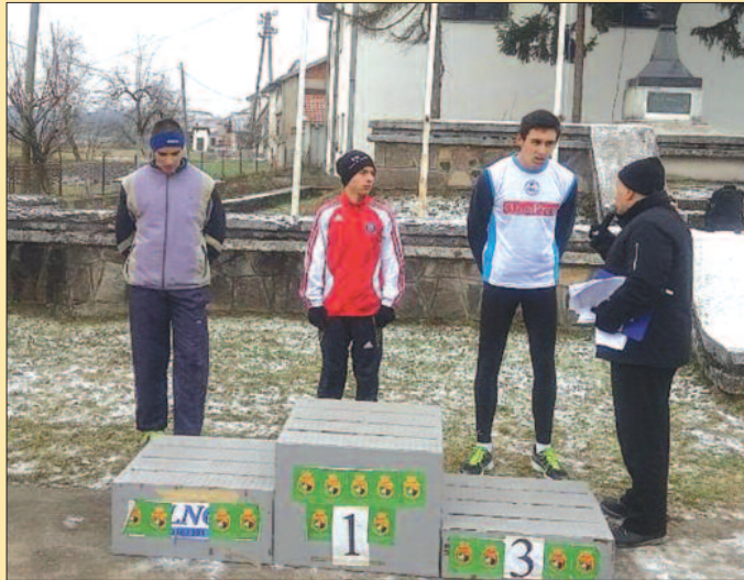
Три најбоља сениора у Мрсаћу

-Веома хладно је било, врло тешка трка, добра конкуренција, али је постављена тактика са променом ритма у последња три круга уродила плодом. Веома сам задовољан наступом, сада имам и мотив више да у мојој правој дис-