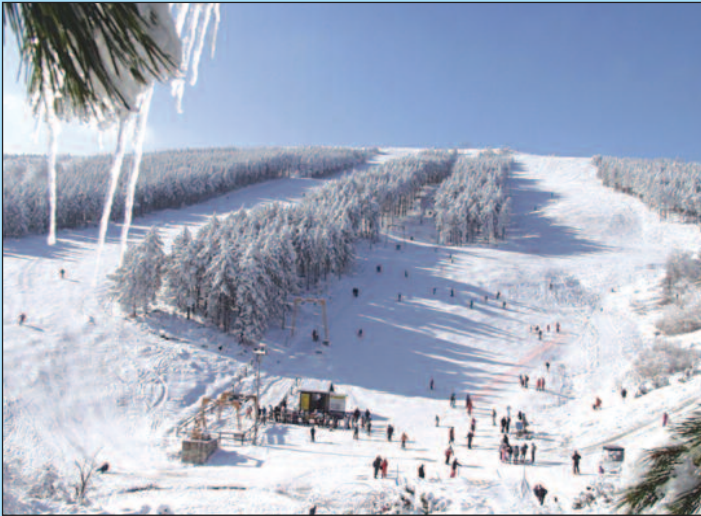
Ски стаза на Гочу

-Планина Гоч је од Врњачке Бање удаљена само 9 киломе-