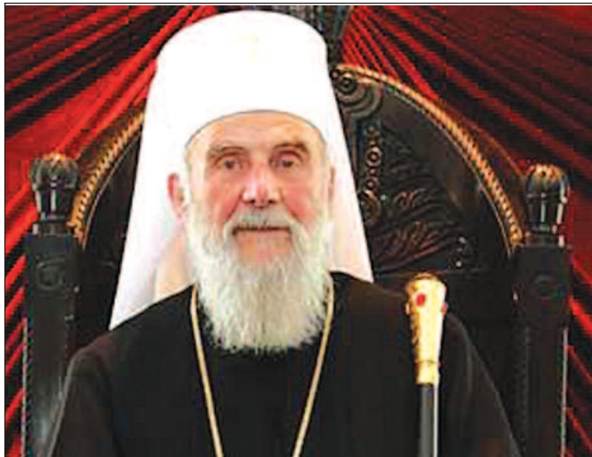
Чувајмо јединство вере - Патријарх српски Иринеј

...У овој празничној радости поздрављамо све вас, нашу духовну децу и светосавску браћу и сестре широм света, у отаџбини и расејању. Поздрављамо вас и позивамо вас: помиримо се са Богом и међусобно и будимо деца Божја и Народ Божји! Развијмо и покажимо добру вољу међусобно и према свим људима око нас!