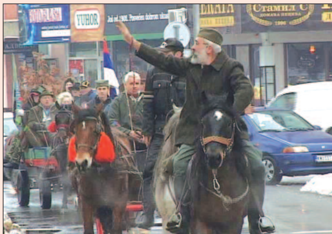
Божићна поворка улицама Краљева

Коњења љубитељи коња "Столови" већ осму годину заједно у вожњу фијакерима и запрегама за Божић • Већина коња слободно живе на Столовима • Овој манифестацији учествовали најмлађи суграђани, јер су се у фијакерима возили градским улицама.