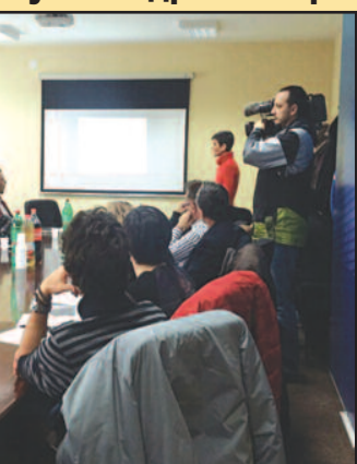
Израмо квалитет хране и воде

ју субјекти локалне самоуправе, а најпре и да спремно дочекају имплементацију ову животну средину и здравље, нагласио је јавно здравље Краљево