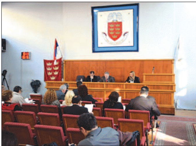
Опозиција незадовољна што се на реализацију пројекта дуго чека

-У току су разговори са старинама на који начин ће се они усељавати у те објекте кад се заврше, а рачунамо да ће то бити 2017. или 2018. године. Помиње се цифра од 600 еура по квадрату, опозиција говори као да је то превелика цена, али лепо пише „не више од 600 евра“. Дакле, може бити и знатно