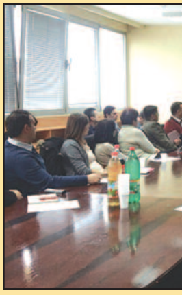
Својим понашањем кре

-Протокол о води је документ који се базира на принципима Светске здравствене организације, а које је прихватила Европска унија и као такав биће имплементиран у локалним срединама. Зато је циљ трибине, односно округ-