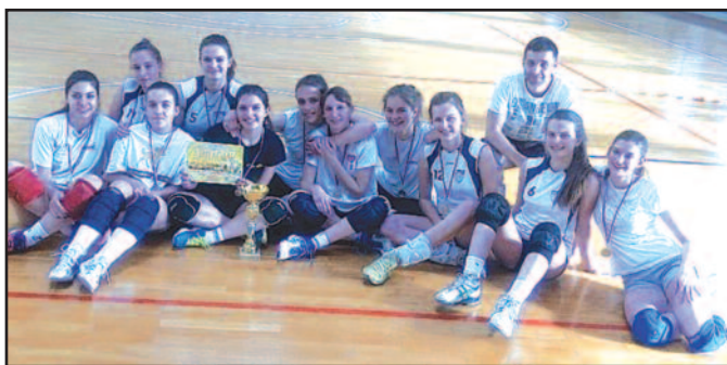
А сада правац школска олимпијада - одбојкашице Медицинске школе

шице Медицинске школе су победиле Гимназију из Аранђеловца, победника Шумадијског округа, а у финалу Гимназију из Чачка, победник Моравичког округа, без изгубљеног сета.