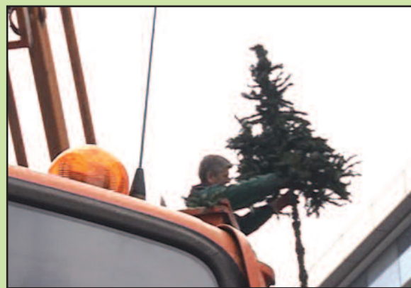
Ове године нешто богатија новогодишња расвета

Када се погледа како су окићене улице већих градова у Србији, онда наше улице за новогодишње празнике не делују најрепрезентативније. Морамо рећи и да се за кићење у другим градовима одваја већа свота новца и да су украси и светиљке јако скупи.