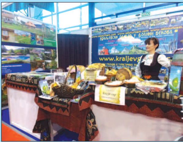
На најбољи начин представљени потенцијали сеоског туризма

-И ове, као и претходних година, трудили смо се да на што бољи начин представимо посетиоцима потенцијале нашег града, а пре свега сеоског туризма територије града Краљева.