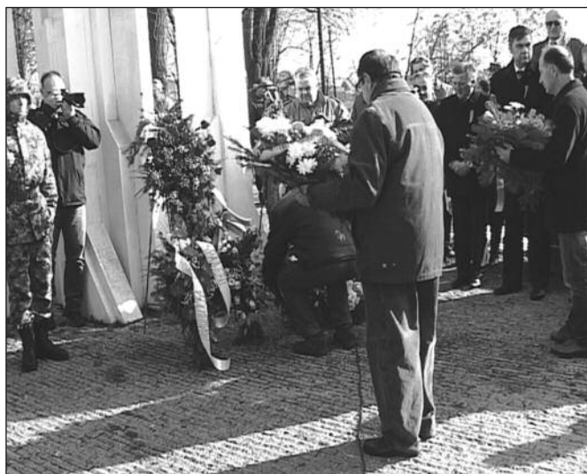
Пошта одата борцима НОВ-а и црвеноармејцима

- Током Другог светског рата у Србији је вођен и грађански рат, а ослобођењем окончани су и ти сукоби у којима је пушку упирао брат на брата, пријатељ на пријатеља, комшија на комшију. Краљевчани су крај најстрашнијег догађаја у историји човечанства дочекали с ра-