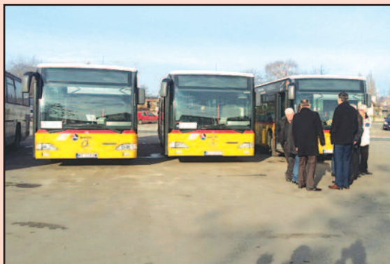
Нископодни аутобуси капацитета до сто путника

Са нама ту је и конзорцијум од 4 приватника који су задржали своје линије и раде свој посао. Договорили смо се са њима да и они