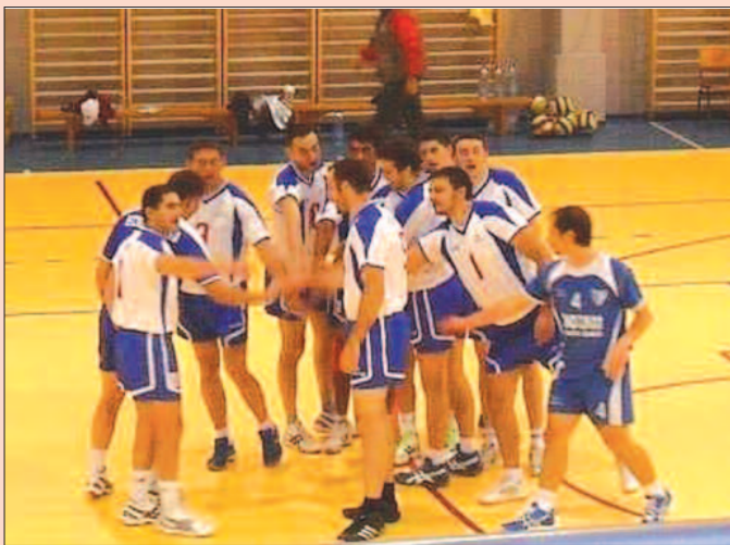
Сви за једног: одбојкаши Грачаца

Партизан 2012 из Вранеша је код куће поражен од имењака из Липљана максималним резултатом 3-0 (25-23, 25-23, 28-26). Иако је пораз максималан, одбојкаши из