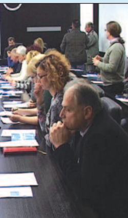
Ступа фондовима ЕУ

ве код нас како би видели на чему приступити не само ЕУ фондови и претприступним фондовима свакако циљ, казао је Томислав Илић.