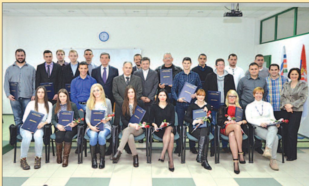
Дипломе су им највеће достигнуће и до сада највећи капитал

-Моја порука студентима којима су данас уручене дипломе јесте да су стечена знања на овом факултету компаративна и релевантна за њихово запошљавање не само у нашим срединама, него и изван наше земље.