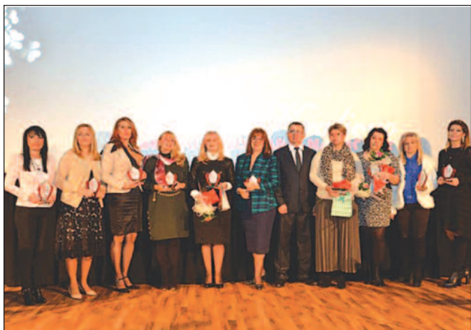
Признање их све радује, али их и обавезује

• У оквиру пројекта „Дама регион 2015.“ додељена признања успешним женама из различитих области рада • Манифестацији присуствовао и Александар Вулин, министар за рад, запошљавање, борачка и социјална питања