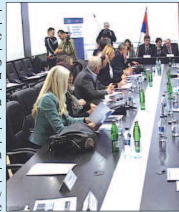
Упознавање са начином при

-Управо ово је сарадња локалне самоуправе и парламента Републике Србије где