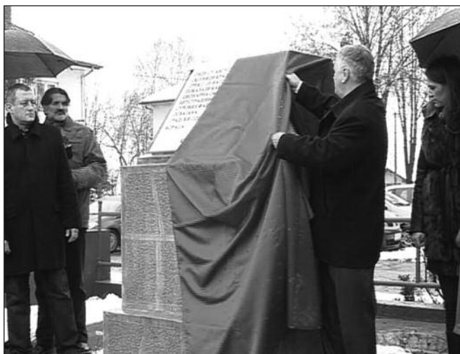
Сретен Јовановић открива обновљено спомен-обележје на Сењаку

-Омладинци су у знак отпора према окупатору запалили ово сено изразивши на тај начин