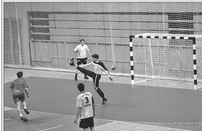
Детаљ са утакмице рукометаша Металца

У Првој лиги група „Запад“ за рукометаше завршен је први део првенства. У редовном 11. колу Металац је у Краљеву победио Тречу из Косовске Митровице резултатом 27-18 (14-8). Краљевчани су максимално озбиљно пришли овом сусрету, на почетку меча су повели 6-1 и више није било дилеме коме ће припасти бодови.