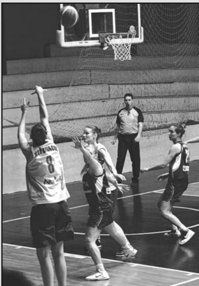
Малене немају пардона - детаљ са утакмице кошаркашица

После победе у Новом Саду имали смо две недеље времена, због обавеза националног тима у квалификацијама за ЕП, да се добро припремимо за овај меч. Радили смо добро, није било проблема и то се показало у сусрету са комшиницама из Крагујевца. Само у првој четвртини је резултат био егал, али када смо први пут повели са десет поена предности, више није било