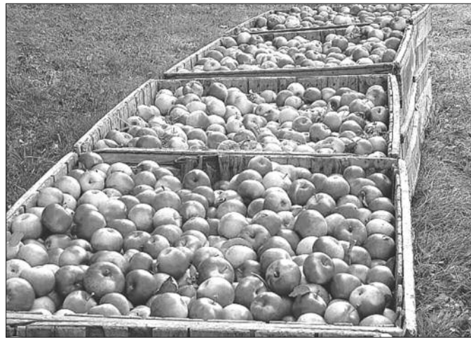
Пажљив однос према воћу у свим етапама његовог премештања

ледни паразити. Они су способни да продру у плод само кроз повреде кожице или кроз њихове природне отворе. Пажљив однос према воћу у свим етапама њего-