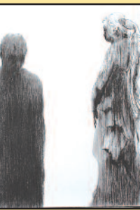
та тачку додира тела. Интердисциплинарним