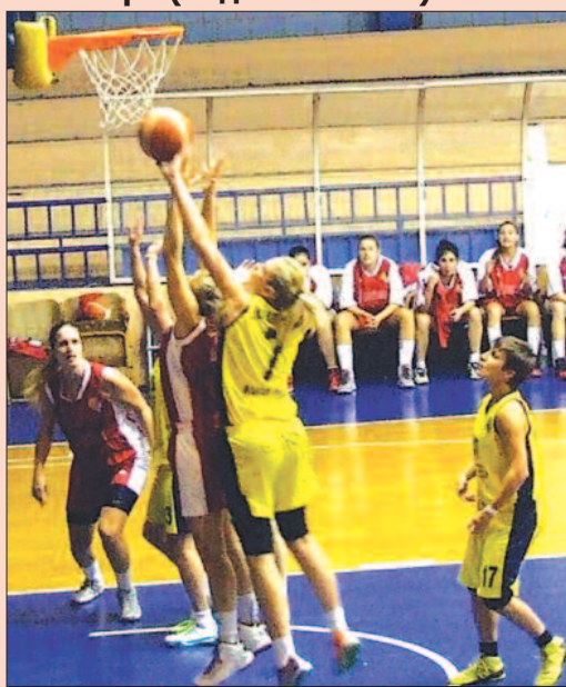
Велика борба под кошом - детаљ са утакмице Слога - Војводина