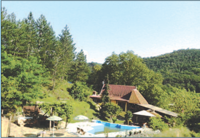
„Оаза мира“ - интересовање било веће од смештајних капацитета

–Резултати показују да је, када погледамо два пријављена сеоска домаћинства која се баве туризмом, остварено скоро 50 права на