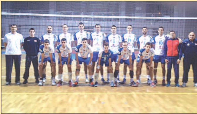
ОК Рибница у новој сезони