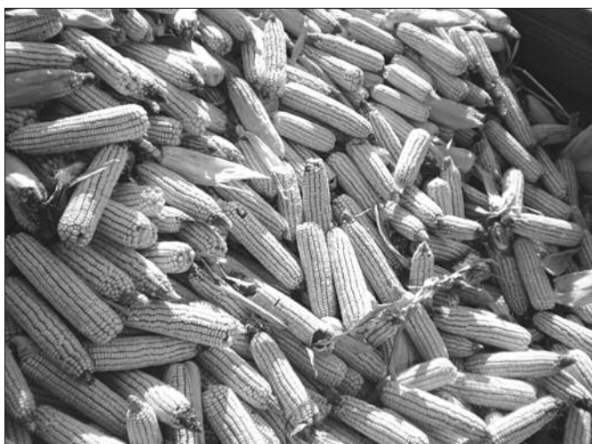
Клип кукуруза напада двадесет пет различитих врста гљива

- Фузариозна трулеж клипа је једна од најраспрострањенијих болести кукуруза, а изазивају је врсте F. proliferatum , F. verticillioides и F. subglutinans , које најчешће захватају појединачна зрна или групе зрна распоређених местимично по целом клипу.