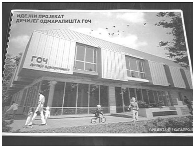
Ако не буде у јануару, биће у септембру. Ако не у септембру...

године, али павиљон ће свакако бити завршен у 2016. години. Након завршетка тендера и избора најповољнијег извођача почеће ра-