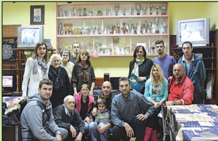
Нови рачунар ће унапредити организацију свакодневних активности

„Желим да Вас обавестим да су у октобру запослени у филијали Војвођанске банке и у вашем граду, у Краљеву, за-