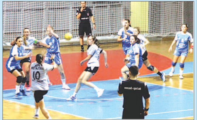
Детаљ са меча Металац - Пожаревац