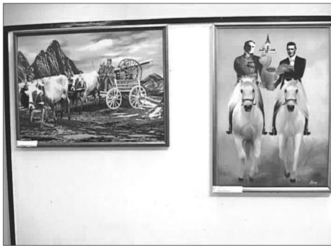
Великани којима много дугујемо

-Ја сам урадила негде око 70 слика које су посвећене Првом