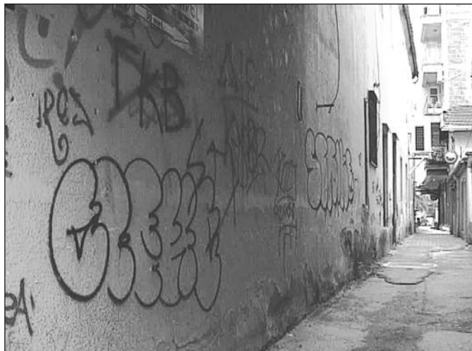
Изградња пасажа код „Југославије“ планирана је за идућу годину

Кажу да идеја о обнови и изградњи нових пасажа у граду Краљево датира неколико година уназад. Међутим, никада ова ставка није уврштена у планска документа града Краљево. Два пасажа који се налазе у самом центру града су у запуштеном стању, а постоји реална опасност и по пешаке. ИН су већ писале да је једна девојка сломила ногу када је пропала у шахт који се налази у пасажу поред хотела "Југославија". Из Дирекције за планирање и изградњу најављују да ће пасаже у центру града кренути да обнављају следеће године.