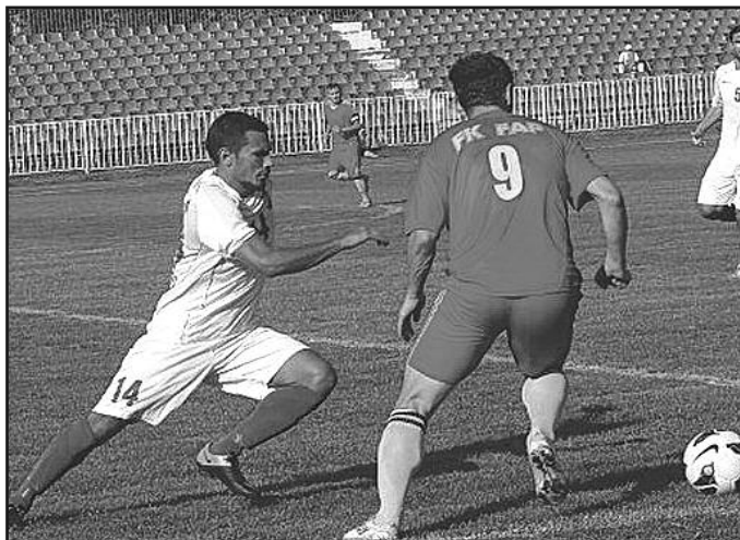
Детаљ са утакмице Слога-ФАП

Утакмица са ФАП-ом за нас је била од велике важности. После серије лоших резултата, а поготово после срамног издања против Шумадије из Аранђеловца у