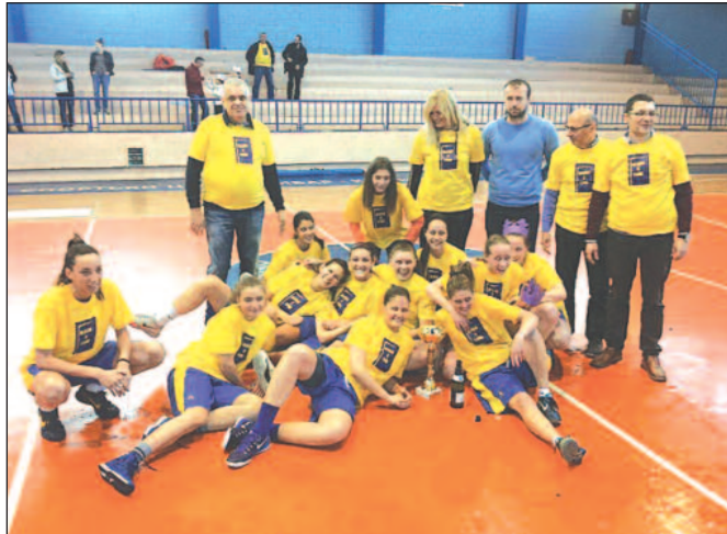
Кошаркашице Краљева спремне за нова славља

-Највеће појачање је останак девојака које су изнеле терет прошле сезоне. То је већ уигран и формиран тим са којим