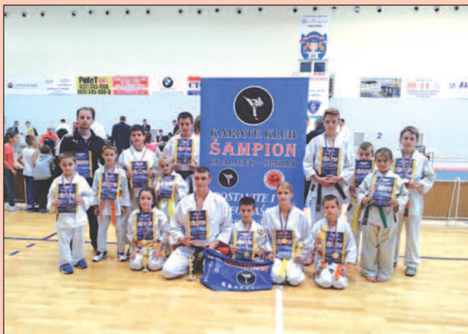
КК шампион из Краљева