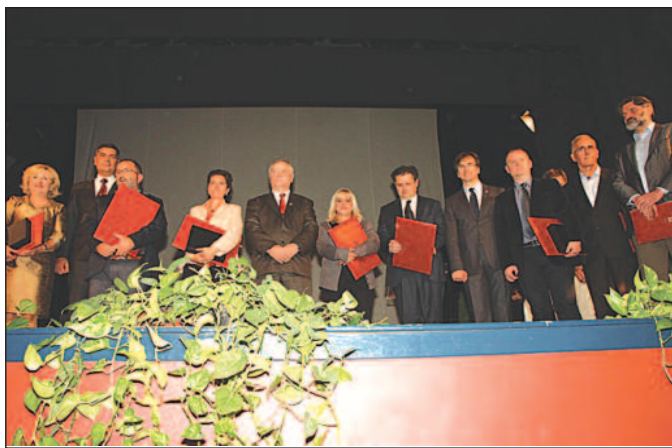
Добитници највиших признања града Краљева

За вишедесетогодишње успехе у позоришној уметности Краљевачком позоришту уручена је диплома