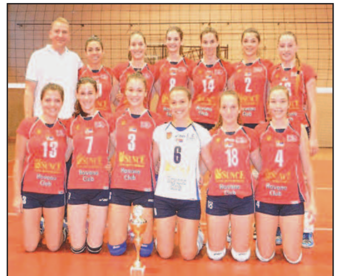
Оdboјкашице Гимназијалца победнице Купа Западне Србије