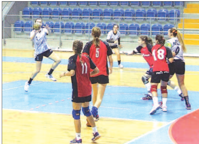
Детаљ са утакмице Металац-Раднички