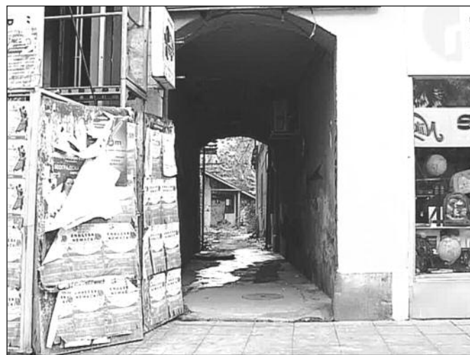
Пролаз код „Папирпромета“ није у власништву града

Дакле није да владајућа коалиција не може и нема ингеренције да утиче да се ругла града уреде, него једноставно не стижу од других пречих по-