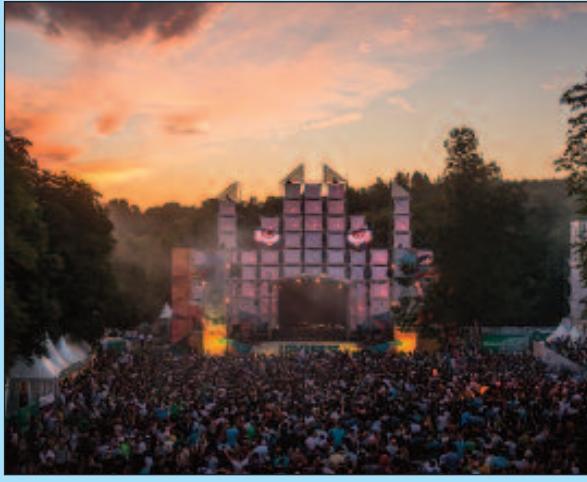
На фестивалу било више од 70.000 људи

Хрватски бенд Хладно пиво обележио је последњу фестивалску ноћ на Jack Live Stage-у Јац, а