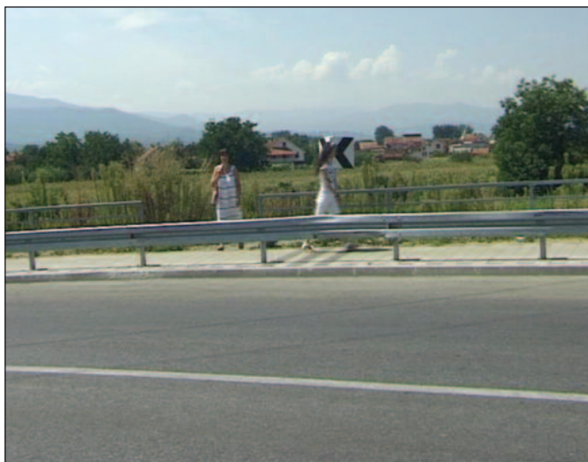
Са рибничке стране урађено приручно степениште

- Како смо најавили, тако смо урадили, па је у Програму уређивања грађевинском земљишта за 2015. годину, под делом који се односи на техничко одржавање и поправке, прецизирана ставка реконструкције и санације косине изнад шеталишта на левој обалотврди реке Ибар од Дома технике према Чибуковцу. Идејни пројекат је завршен, а главни пројекат очекујемо да буде готов сваког дана како бисмо расписали јавну набавку на неких 2.000.000 динара. Мало је то, превасходно ће бити искоришћено за радове на понирним бунарима испод парка. Ако