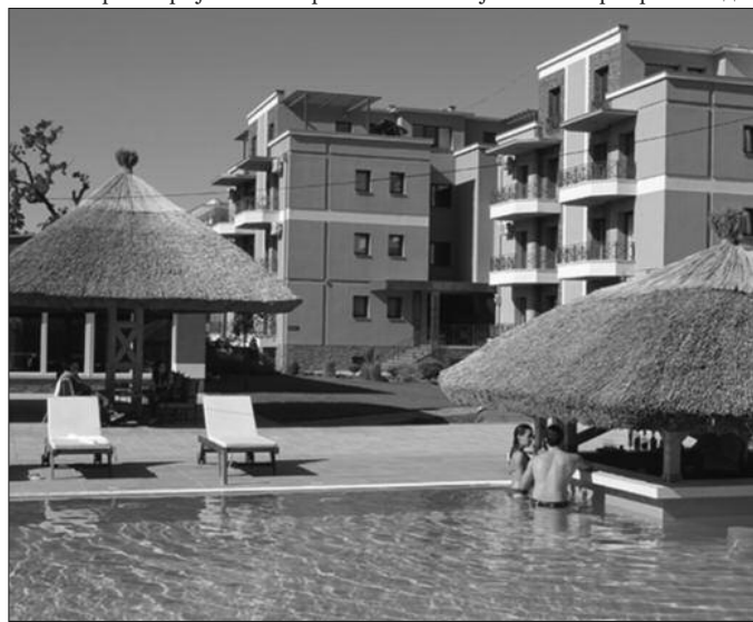
Базен у хотелу Соларис Ресорт

Треба напоменути да је у Бањи, у хотелу „Звезда“ тренутно теквондо камп са више од 260 полазника, који се обучавају уз надзор људи из теквондо клуба Галеб и наше златне олимпијке Милице Мандић, која је у освајање света пре три године кренула баш из Врњачке Бање.