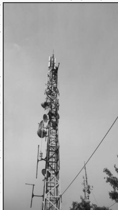
Са стуба скинуто десет антена

Припадници Полицијске управе Краљево извршили су у среду увиђај и истрага је у току. Ово је још један покушај да се онемогући објективно извештавање и слобода говора, по налогу оних који сами себе проналазе у проблемима на које Телевизија Краљево свакодневно указује. Колико су налогодавци оваквих кривичних дела свесни да на овај начин неће моћи „да нам ставе фластер на уста“ да ће објективно новинарство остати синоним ове куће док по-