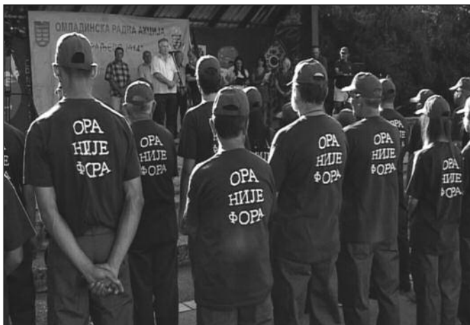
Афирмација добровољног рада и ентузијазма младих

-Прошле године Краљево нам је узело душу, а ове године ћемо оставити и срце. Краљево нас је