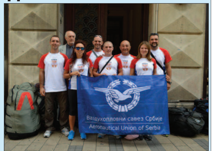
Репрезентативци Србије најављују борбу за медаље

-Најављујем борбу до последњег атома снаге, јер желим да одбраним