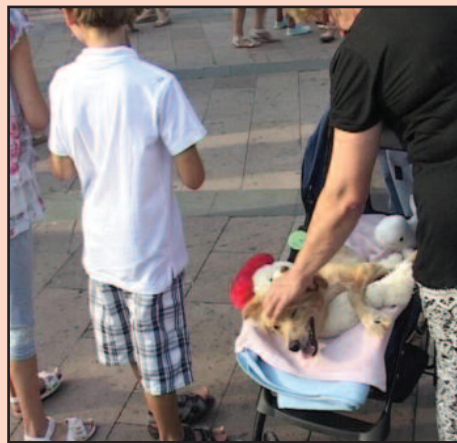
Болесне псе не можемо оставити на улици

желимо да сарађујемо са њима, да нађемо заједничко решење. Ми тренутно нисмо у могућности да нађемо други објекат, али ако нам они понуде неку другу варијанту ми ћемо са волонтерима преместити псе и наставити бригу о њима као до