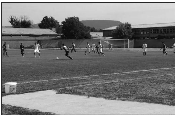
Детаљ са утакмице Слоге и Напредка