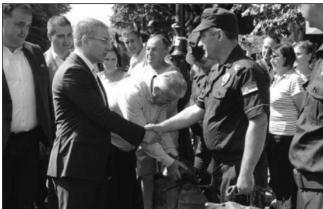
Стефановић: полиција је уз свој народ на сваком месту

Врњачка Бања је данас једна од најзначајнијих туристичких дестинација Србије, али и место где се многи туристи из