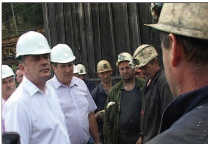
Рудник борних минерала отвара хиљаду радних места

Истраживање борних минерала изводи канадска фирма Балкан Голд која је ставила „шапу“ на ово налазиште. Новинаре је занимало због чега ни једна домаћа компанија није до-