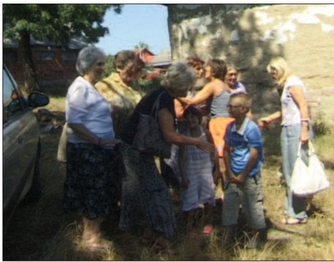
А сад треба скупити паре за мању монтажну кућу