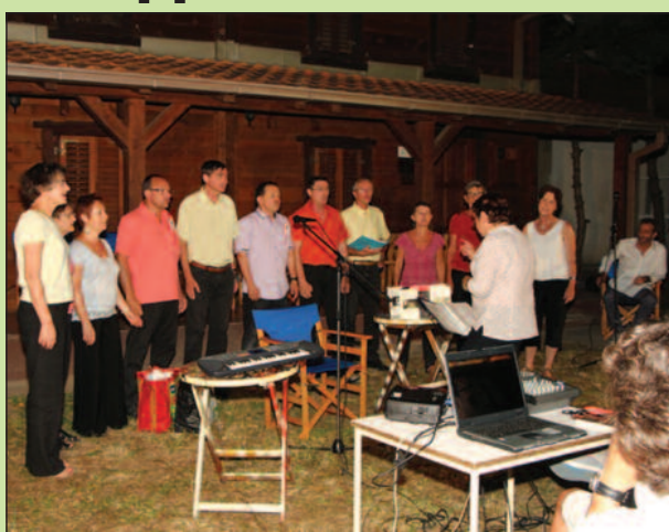
Певачка дружина „Шантфабл“ извела популарне шансоне

Програм је уприличен поводом сарадње између краљевачке библиотеке и Француза која траје десетак година. Лионци су и овога пута