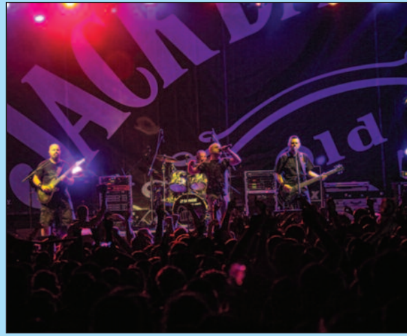
Хрватски бенд „Хладно пиво“ обележио последњу фестивалску ноћ

био веома збуњен и пререћан, а до краја сета на ногама је држао препун