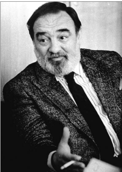
Данило Бата Стојковић