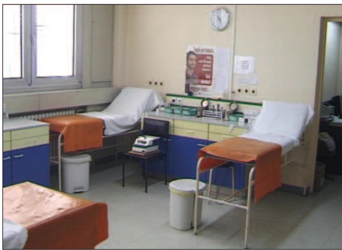
Трансфузија увек спремна за добровољне даваоце