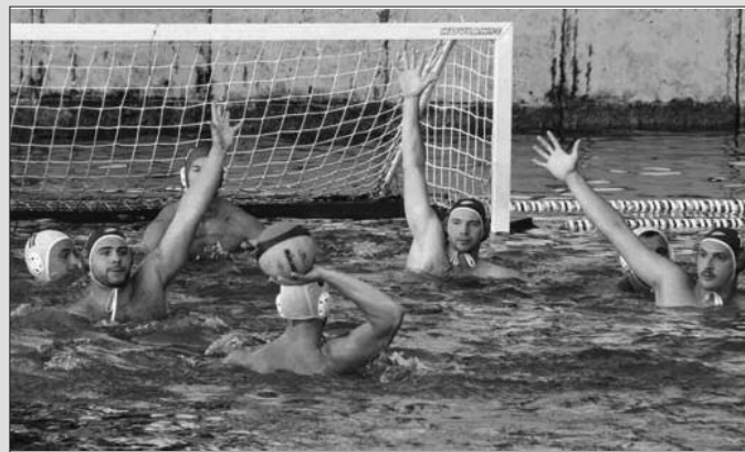
Довиђења до наредног лета - детаљ са једне ватерполо утакмице у Краљевићу

„ВПК Краљево је сезону окончао на 3. месту у овој групи са 9 бо-