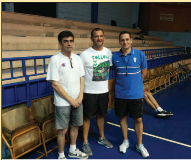
Стручни штаб КК Слога Краљево

Вратио сам се у Краљево да помогнем клубу у коме сам одрастао. Посла има много, али најважније да верујемо да можемо, да сањамо сан да ће Слога да буде