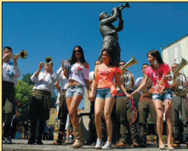
Нема журке као што је Гуча

у свету. Организатори манифестације су Центар за културу и спорт у Гучи и