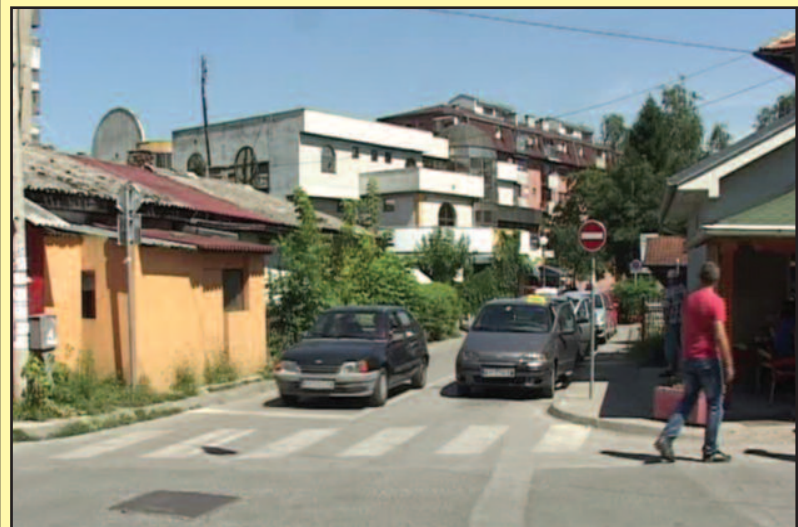
Нико не зна ко је променио саобраћајне знаке у Улици Драгојла Дудића

Из одељења за урбанизам, грађевинарство и стамбено комуналне делатности на увид су нам доставили план према којем је очигледно да је неко свесно и на-