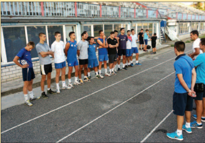
Први тренинг на атлетској стази - одбојкаши краљевачке Рибнице

Одбојкашки клуб Техничар из Краљева одлично ради са млађим селекцијама, имамо дборо сарадњу и нови играчи су стигли из овог клуба. У питању