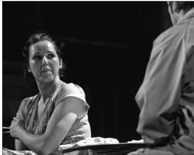
Као старија Доли у представи „Хиперболични параболоид“

шла на пријемни и имала сам велику жељу да будем код ње на класи. То је био диван период,