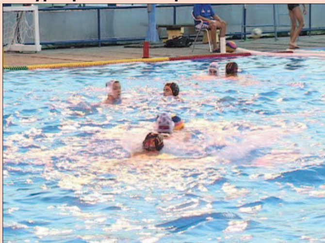
Промоција ватерпола и афирмација младих играча