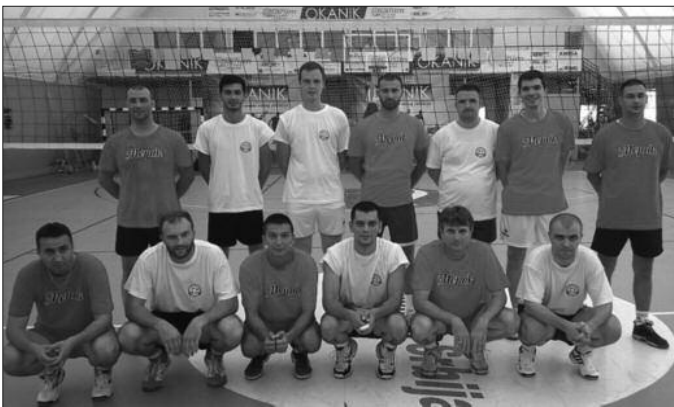
Нишлије и Краљевчани - финалисти турнира одбојкашких судија