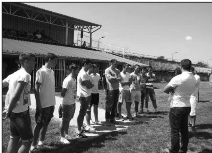
На прозивци само тринаест фудбалера

–Свесни смо тежине тренутка у коме се налази клуб, али нисам имао ниједног тренутка дилему да ли да се прихватим посла. За фудбал и од фудбала живим, на окупу ћу имати претежно младе и неафирмисане играче са којима је милина радити, јер чим су овде верујем да поседују одређени квалитет, иако их не познајем лично, тачније знам староседеоце углавном. Радом на