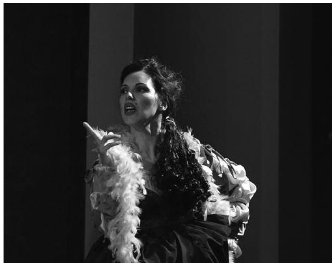
Као Лукреција у представи „Да ли је то била шева“

Много сте везани за Народно позориште Кикинда. Како сте отишли у Кикинду?