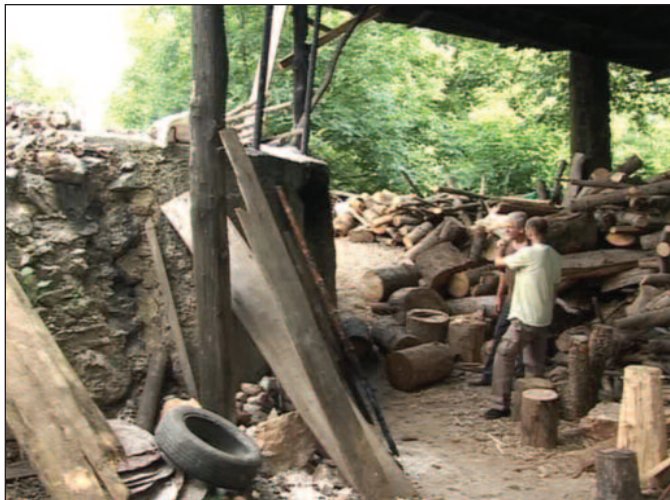
Једна од ретких породица која се бави производњом креча

дио од мог тате и чувам је већ 45 година. У воденици смо радили ја и моја супруга. Воденица ради нон стоп, јер има доста помелара, а ово је једина воденица у околини. Само сам