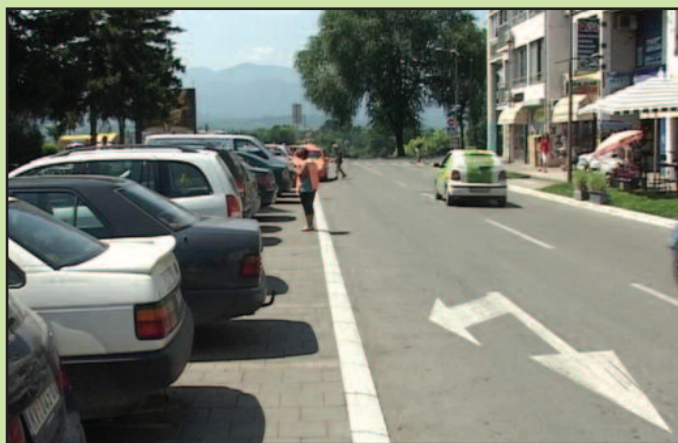
Инкасанти ипак остали на послу

-Законом о буџетском систему из децембра 2013. године уведена је забрана запошљавања у јавном сектору. Истовремено тим законом је предвиђено да сви корисници јавних средстава могу ангажовати раднике преко уговора, али да њихов број не прелази десет одсто од укупног броја запослених. У том смислу ми смо имали већи број од тог предвиђеног, али све је било по закону. Наиме, истовремено са доношењем поменутог закона Влада је донела и уредбу којом је одложила примену тог члана закона на шест месеци. У наредном периоду