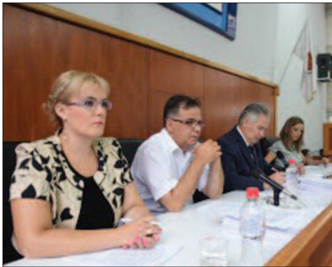
Обиман дневни ред „услови“ дводневно заседање

Првог дана заседања најжурстрије коментаре опозиције извао је Предлог одлуке о начину поверавања превоза у градском и приградском саобраћају на територији Краљева. Опозиција је критиковала што је приликом решавања ситуације око избора превозника заобијена скупштинска процедура, а није им био ни јасан начин избора превозника ако није било тендера. Градоначелник је објаснио да је