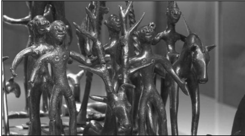
Приказани изабрани филмови са међународне смотре археолошког филма у Београду

комплекса настављен је филмовима: „Монументални комплекс Светог Орса у Аости од