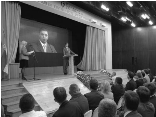
Нећемо одзволити да грађани Србије буду покрадени

-Није ме срамота када помињете Владу Србије, јер јесмо доста помогли Врњачкој Бањи и помоћи ћемо још више. Али, не би ми помогли ни упола толико да нисте имали упорне људе из општине који су обигравали око Владе, око сваког од нас. Људе који су се борили да извуку сваки динар, који су тражили и покушавали да добију што је могуће већу подршку државе.