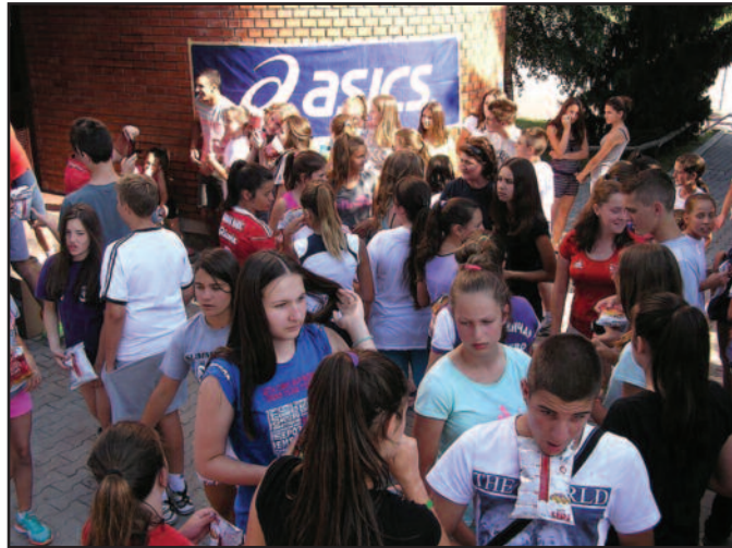
Спремни за искушења - полазници прве смене одбојкашког кампа у Митровом Пољу

-Следеће године имаћемо десето издање и сигурно је да ћемо покушати да на прави начин обележимо тај јубилеј. Ове године, у првој смени је заводан број деце, углавном млађег узраста, дошло је до очекиване смене генерација, али и то има чари, стигла је у Митрово Поље нова лепота. Радићемо као и до сада на шест терена, два пута дневно, користити благодети лепог времена, базен, организовати посету Александровцу и одиграти већи број тур-