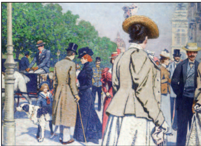
Улица која је изглед града променила заувек

Изградња бечке улице Рингштрасе почела је одлуком цара Франца Јозефа 1857. године, да раскрчи старо војно утврђење које је успешно бранило Беч од опсаде Турака 1683. године. Уређивањем ове тврђаве са истуреним артиљеријским терасима, бедемима, и местимично и до 450 метара широким, истуреним, неизграђеним травнатим појасом, тзв гласијом, планирано да се успостави веза између центра Хабсбуршког царства и света који га окружује. Рингштрасе је свечано отворена 1. маја 1865. међутим, овај велики