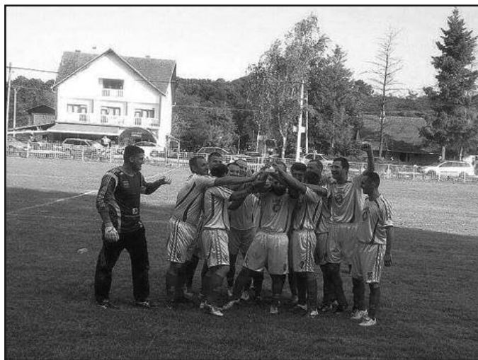
Шампиони са пехаром - фудбалери Младости из Врдила

имала ни једна екипа у овом пети тим који је у својој тренерској каријери увео у виш