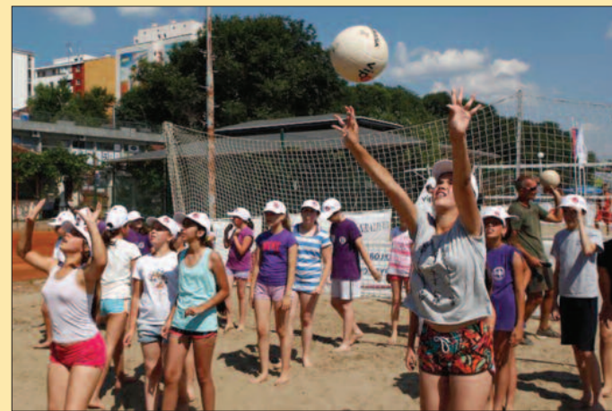
Најмлађи су најважнија одбојкашка база

овдашњој одбојкашкој школи. - Краљево је велики одбојкашки центар Србије, један од најзначајнијих у региону и као такав се мора поштовати. Погледајте број репрезентативаца и тренера који су потекли крај Ибра и све ће вам бити јасно. Турнир се показао као пун погодак, посета је била одлична, а ту је било још спортских и културно-туристичких манифестација, због којих је град на Ибру био права мала престоница Србије. Увек се радујем дружењу са децом, то је наша најважнија база, јер њих треба да задржимо у одбојци, ако ништа