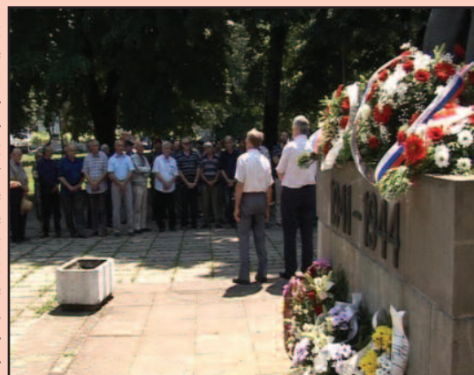
Венци положени на Споменик отпора и победе

Дан борца, који је називан и „празник устанка народа Југославије“, обележавао је годишњицу сед-