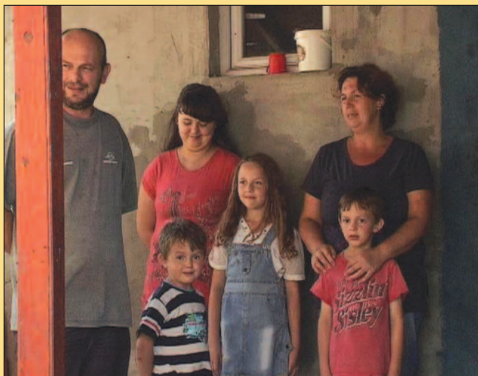
Рајица отишао у Русију да заради, вратио се без руке

-Живим са супругом и петоро деце у двадесет једном квадрату. Не радимо ни она ни ја, живимо од моје инвалидске пензије која је 4 800 динара, примања из центра за со-