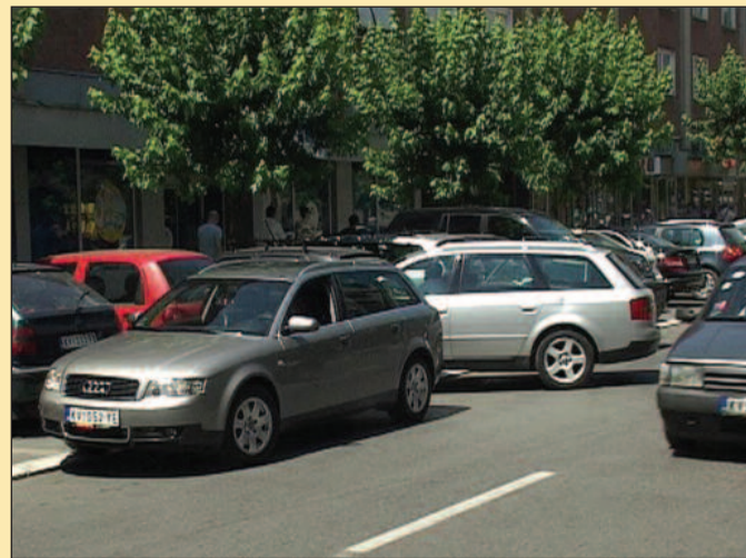
Лакше добити на лутрији него наћи паркинг место

• Јавно комунално предузеће „Чистоћа“ не издаје резервације за паркинг места у Краљеву, већ то раде службе Градске управе • Потенцијални корисници паркинг места могу да, уз прописану надокнаду, обезбеде месечне паркинг картице које омогућавају слободно паркирање, али не и резервацију