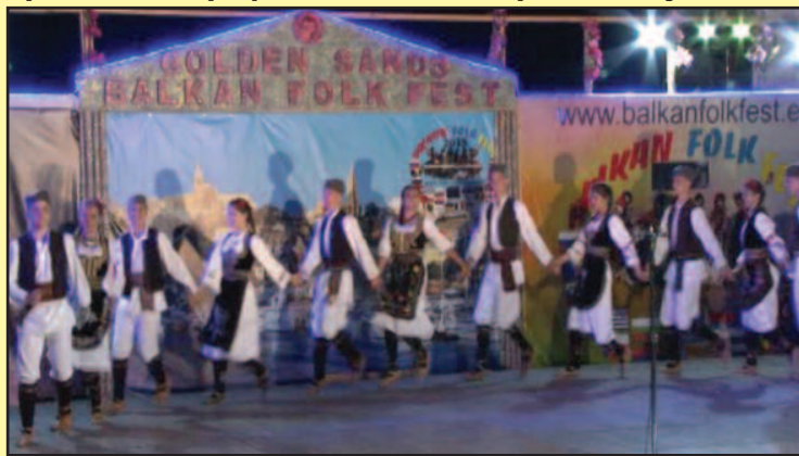
Чланови „Карановца“ оцењени одличном оценом

обале, највеће летовалиште на северу Црног мора, на мање од 20 километара од града Варне. Због дугих пешчаних плажа и ниских цена, Златни Пјасци су данас популарни подједнако и међу туристима Европске уније и међу туристима са Балкана. Ово место је атрактивно и због климе која је пријатна и блага захваљујући ветру са Црног мора и непосредне близине националног парка и бујне вегетације на западу. С друге стране, море је топло, са просечних 27°C током лета.