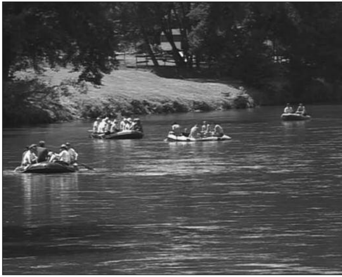
Последњих неколико година све је мање спусташа

дина заредом. Спуст је прошао одлично и добро смо се забавили. Жао нам је што ова манифестација из године у годину назадује и што је сваке године све мање људи. Организатори би требали првенствено да осмисле неки садржај под Магличом, а не да се све организује у Бањи и Краљеву. Доћи ћемо и следеће године, рекао је члан посаде „Гусари са Тимока“ из Књажевца.