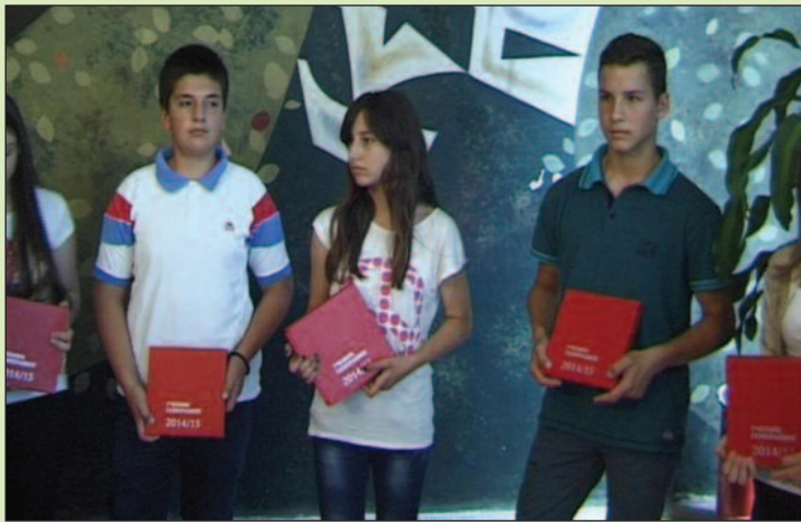
Ђаци генерације морају бити препознати и мотивисани

Вредна признања примили су ученици из 21 основне школе из Краљева, односно по 4 из Рашке и Врњачке Бање. Међу средње школе у питању, златнике су примили ученици из 10 краљевачких, плус музичка и специјална, односно по два ученика из Рашке и