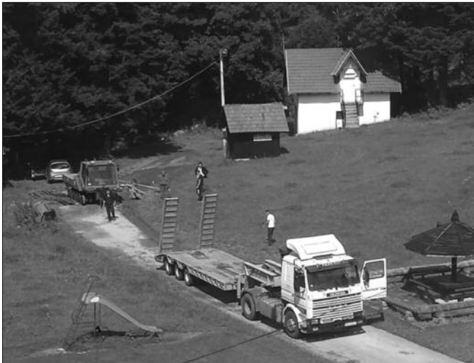
Стари табач одвозе са Гоча, са нови нема пара

нису дуговале само плате него да 5-6 месеци нису били плаћени ни доприноси за плате. И тај део смо измирили чим смо дошли да би могли даље да функционишемо и исплаћујемо плате, јер су ова два радника код нас радила још годину и нешто дана.