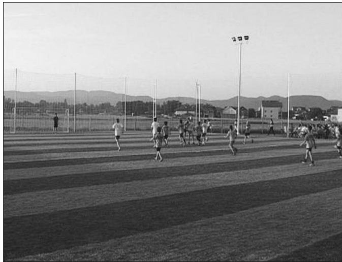
Овакве услове немају ни прволигаши

У овај пројекат инвестирано је око 650.000 евра, а Петровић објашњава и шта је конкретно урађено, као и колико ће то значити свима који ће нови, вештачки терен користити у бу-