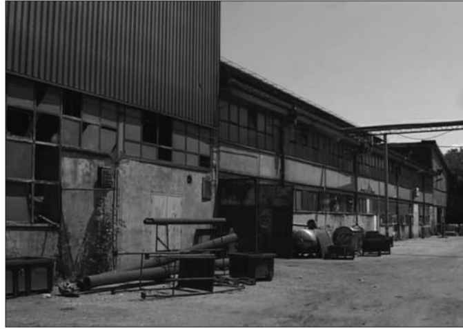
Ливница има посла и тржиште, али ће потонути заједно са Фабриком вагона

виђен опоравак, већ ће се продати као имовина.