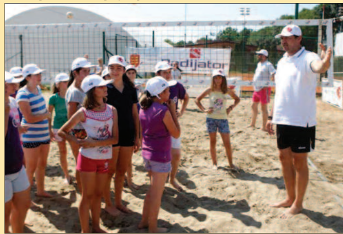
Полазници пажљиво слушају савете Владимира Грбића