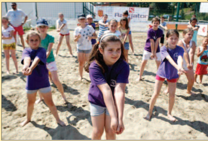
Децу треба на прави начин „инфицирати“ одбојком

Веома срећне смо због победе. Поново смо биле најбоље и на другом турниру, иако нисмо имале неки генерални план шта очекујемо и чему се надамо у овој сезони. Договор је да идемо од меча до меча, од турнира до турнира, па докле стигнемо. Испоставило се стигли смо до победничких пехара на оба одиграна турнира. Сјајно! Следи нам међународни наступ због кога нећемо играти на наредном турниру у Бачу, али се надамо да ћемо задржати овај ниво форме у наставку сезоне. Ове године, за разлику од прошле, бич волеј лига је изузетно јака, нема лаких мечева и заиста треба много енергије и рада да