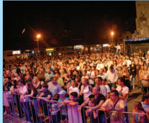
Публика је ове године испунила централни гр

носи смо и на квалитетне музичке концерти су били