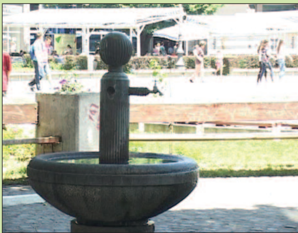
Чесма у полукругу изгубила стари сјај

-Уређење комплетног терена у граду, нарочито улица и оно што припада улицама је под јурисдикцијом Дирекције, с обзиром да је то власништво града. Што се тиче одржавања чесама и фонтана то припада Дирекцији. Ми само дистрибуирамо воду и зато смо уградиле свуда водомере, што је по критеријумима и по новом закону из 2011. године, где се каже да свака јавна чесма и фонтана мора да има свој водомер како би се мерила потрошња. ЈКП „Во-