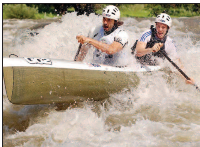
Кротитељи речних букова - кајакаши на дивљим водама

Овог викенда на програму је друго коло Купа млађих категорија у кајаку на дивљим водама, такође у Нишу.