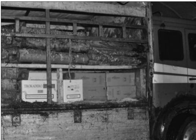
Цигарете се често шверцују са подручја Косова и Метохије

Оно што је евидентно је да имамо један пад када су у питању активности на превенцији пушења. Иако је проценат свакодневних пушача 2013. године мањи у поређењу са 2000. годином, запажа се значајно повећање у односу на 2006. годину. Наравно разлози за то су комплексни и многобројни. Основни је недоста-