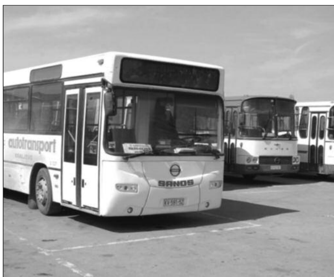
Губитке на линијама од општег интереса да надокнаде општине

–Мислим да је овај уговор од стране града раскинут много раније. Град је по уговору презео обавезу да омогући несметан рад превозника и да створи услове да тај превоз буде профитабилан. Тај превоз одавно није профитабилан, сведоци смо да се свакога дана у превоз