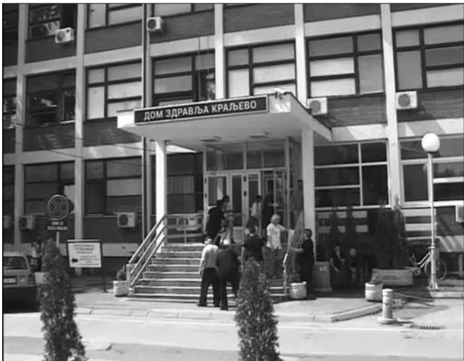
Очекује се долазак педесет представника највећих европских земаља

Пројекат Европске уније под називом „Smart care“ започет је у Дому здравља „Краљево“ крајем 2013. године, а уз подршку Министарства здравља Републике Србије. Реч је о пројекту који повезује социјалну и здравствену заштиту. Краљево је, уз девет других тзв. пилот-локација, учесник пројекта који је намењен развоју конкурентности и иновативности у коришћењу информационих технологија, а партнери Дома здравља су Центар за социјални рад и предузеће „Белит“ из Београда. „Smart care пројекат“ кроз информатички сервис омогућава повезивање и размену информација између Дома здравља, Центра за социјални рад и самог примаоца неге или чланова његове уже породице. Прва конференција по-