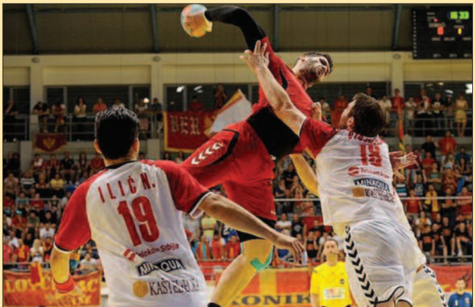
Детаљ са утакмице Црна Гора - Србија

Србија ће у последњем колу квалификација за ЕП 14. јуна у Краљеву дочекати