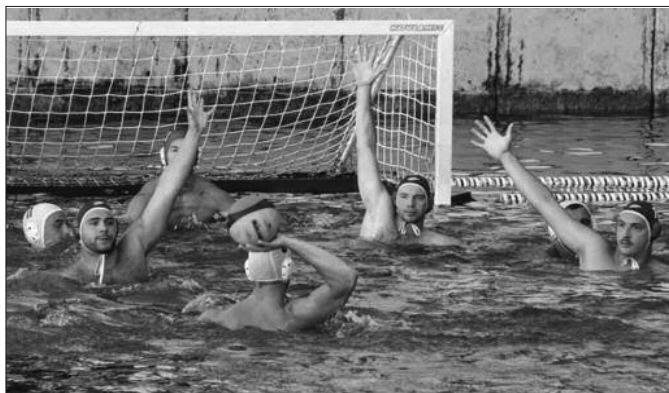
Подмлађени у нову сезону - ватерполисти Краљева

делфини су слободни, а у другом колу крај Ибра гостује Језера из Беле Цркве (18. јули). Подсећамо ватерполисти Краљева бране титулу првака Друге ватерполо лиге Србије.