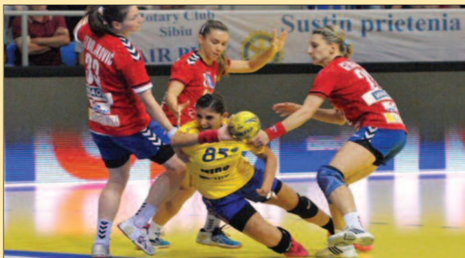
Незаустављиве Румунке - детаљ са меча баража за СП