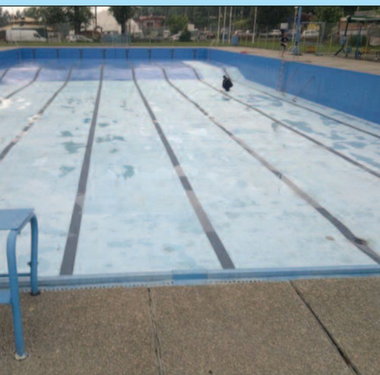
Базен почиње од 15. јуна - краљевачки базен

на захтев око анга-лаца на базену. За-н још у фебруару одговора нема, а , без спасилаца не У ишчекивању по-ења овог неочекива-у, у СЦ „Ибар“ су ет суграђанима када ена карата за базен. епромењена као и 150 динара дневна, аде динара сезонска