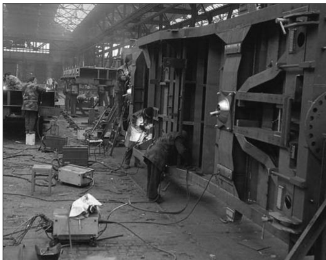
Некада било - из погона Фабрике вагона Краљево

Осванули су тешки дани за све запослене у "Фабрици вагона Краљево", који су задњу плату примили августа месеца 2012. године. Дан након што се Фабрика вагона није нашла на списку од 44 предузећа у реструктурирању који би наредних 5 месеци били заштићени од принудне наплате поверилаца, на капији фабрике јуче су се појавили приватни извршитељи који су желели да плене имовину. Спречени су од стране 100 запослених који су се самоницијативно окупали. Заступник капитала "Фабрике вагона Краљево" сазвао је хитну конференцију за медије на којој је желео да упозна јавност са одлуком државе и Министарства привреде да их остави на цедилу као и да нису благовремено обавештени о одлуци да се некадашњи гигант не нађе на списку заштићених предузећа. У ред за принудну наплату стали су радници и бивши власници ове фабрике из Украјине.