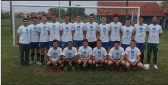
Омладинци ФК „Рибница“, Јовац