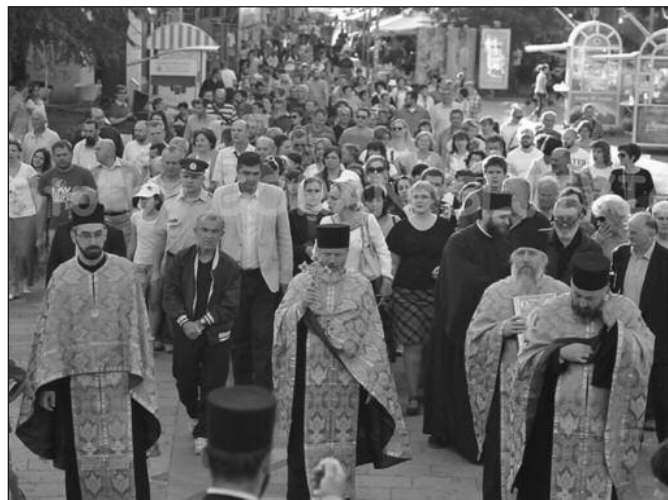
Велики број грађана прославио Свете Тројице

в" где је освештан запис, који је према веровању заштитник града, затим до Трга српских ратника и Споменика српским ратницима палим за слободу отаџбине од 1991. до 1999. године, након чега су се