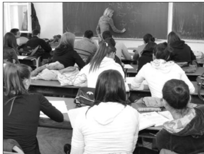
Лето у клупама - основци пред завршни испит

биће довољно места за све ученике јер је 200 слободних места више, него што је ученика. Сва три дана завршни испит ће почети у 10 сати и трајаће по 120 минута.