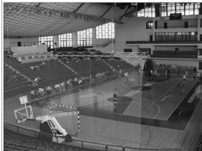
Порез или катанац - један од српских спортских центара

• Функционисање спортских центара умногоме је отежано услед одлуке Управе јавних прихода којом би спортски центри требало да плате порез на имовину који је увећан за више од 40 пута • Спортски центар "Ибар" у Краљеву за сада нема ту бригу, јер има статус јавне установе и финансира се из буџета града