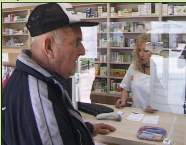
Бољи услови за бољу услугу - аптека „Рибница“

• Апотека "Краљево" преместила је испоставу из Амбуланте "Рибница" у нов и комфоран простор у Дому културе у Рибници • Ова установа располаже мрежом од 30 својеврсних филијала широм краљевачке општине, а ускоро ће оспособити још једну у селу Витковац