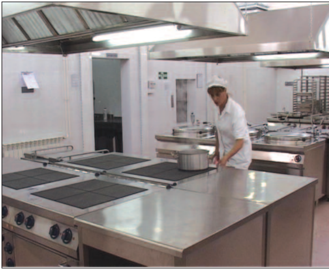
Коначно прорадила - кухиња у вртићу на Ратарској капији