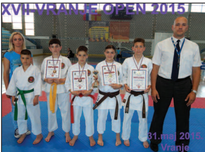
КК Реикон са такмичења у Врању

Поред карате секција у ОШ Јован Цвијић у Сирчи и ОШ Милунка Савић у Витановцу, које успешно раде већ скоро две године, КК Реикон недавно је отворио још