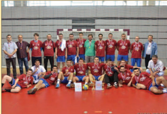
Шампиони - рукометаша краљевачког Металца

Пре две године Металац је испао из прволигашког друштва неславно, са само