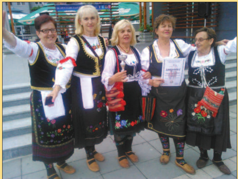
Женска певачка група „Рибница“

Женска певачка група "Рибница" освојила је прво место на 9. Сабору изворног народног стваралаштва одржаном у Пожеги. Ово је један од већих успеха током вишедеценијског постојања ове певачке групе, јер је остварен на такмичењу у Западној Србији, регији која негује висок ниво изворног певања.