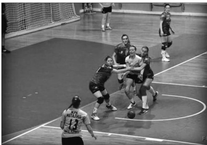
Детаљ са утакмице краљевачких рукометашица

То ће бити друга утакмица женске екипе у новој дворани и