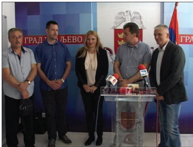
Некомплетни - народни посланици у сусрету са новинарима

Анкетирање грађана, регионална телевизија Краљево обавља случајним узорком на различитим локацијама града Краљева, па не можемо да се отмено утиску да народни посланици покушавају да утичу на уређивачку политику и слободу говора. Анкета, коју смо спровели одмах након састанка, показала је да су грађани листом незадовољни радом краљевачких народних посланика.