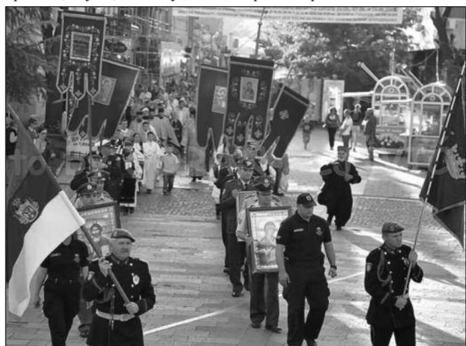
Литија улицама Краљева

вић", где је освештан запис, који је према веровању заштитник града, затим до Трга српских ратника и Споменика