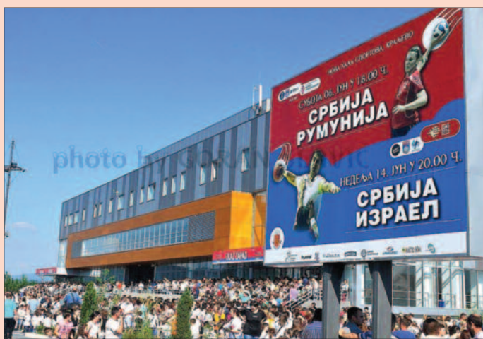
Сви за Србију

Окупили смо се пред две бараж утакмице са Румунијом. Надам се да