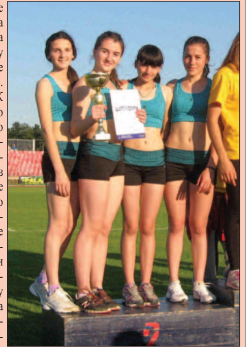
Младе јуниорке АК Краљево