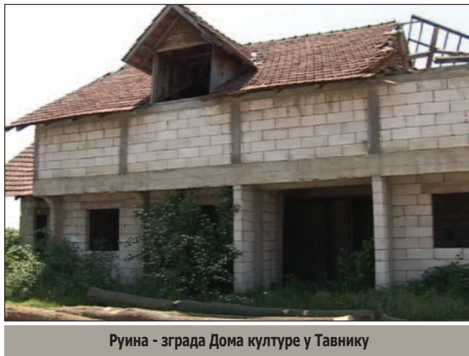
Руина - зграда Дома културе у Тавнику

за извођење радова на сеоским подручјима директно одговорна за овај проблем. У селу има потребе и за асфалтираним путевима, а по прописима, Дирекција може у једном једном селу да уради нешто више од 200 метара асфалта. Мало, зар не? Дирекција и град