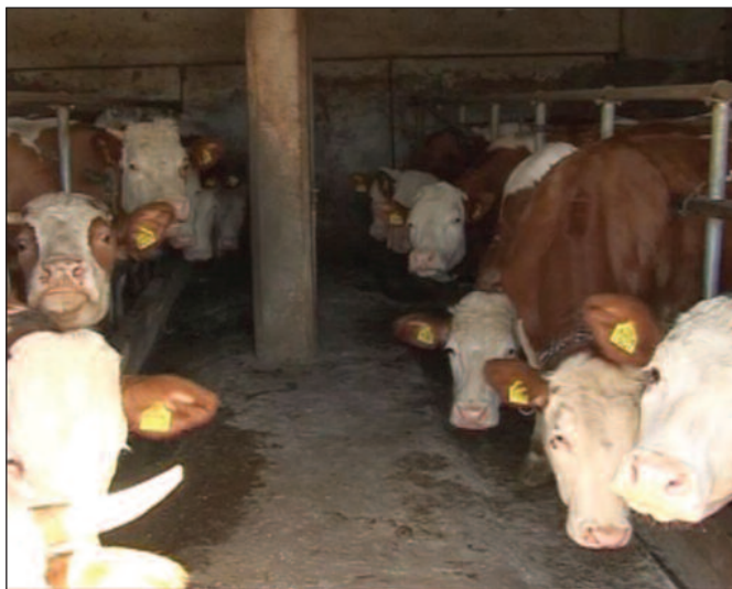
Потребна већа улагања у пољопривреду

- Пријавиле су се три банке са којима ћемо разговарати и потписати уговор, а реч је о суфинансирању камата. Пољопривредни