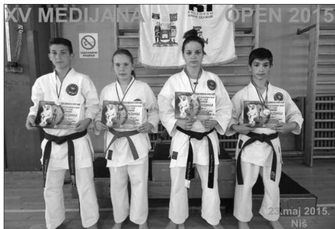
Са медаљама из Ниша - каратисти Рейкона

Ниска медаља каратиста Рейкона освојена је и на "Цариброд