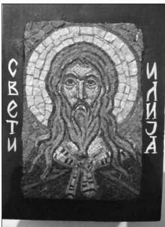
Милица Стошић - Свети Илија

Изложене иконе рађене су у мозаику, старој сликарској техници која се изводи слагањем разнобојних, мање или више правилних, коцкица камена, обојеног стакла или глазиране керамике. Уситњене коцкице се утискују у свеж малтер, цемент, или масу на бази дисперзије природне и вештачке смоле и разних лепила. Њиме се осликавају подне, зидне и сводне површине. Заступљене су две врсте мозаика чија се подела заснива на уједначености каменних коцкица и ве-