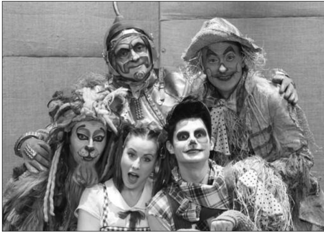
Доминирали - представа, "Чаробњак из Оза" краљевачког позоришта