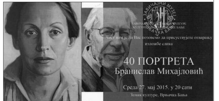
Изложба која је привукла пажњу

Циклус „40 портрета“ настао је у периоду од 2010. до 2014. године део је једног обимнијег пројекта од преко 200