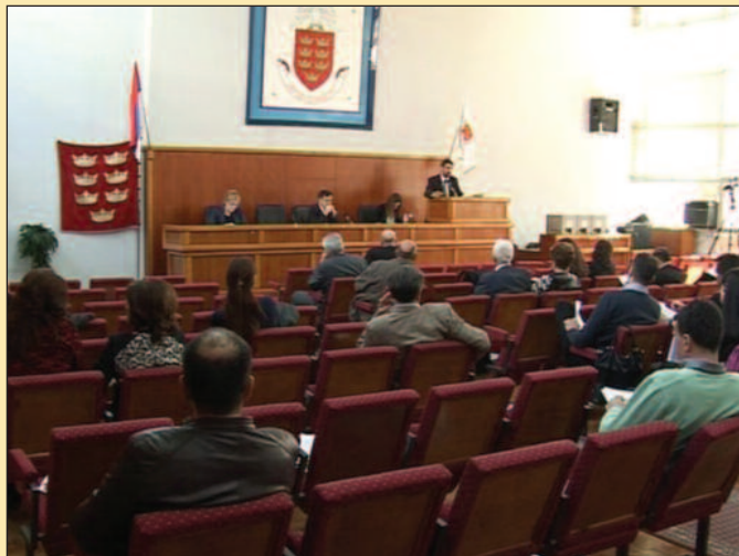
Одборници нису усвојили дневни ред - са седнице скупштине града

Из Демократске странке су скренули пажњу на други радни закључак који је владајућа већина предложила, а из кога се, како кажу, види да иако су три године на власти не знају шта је у Дирекцији до сада урађено по