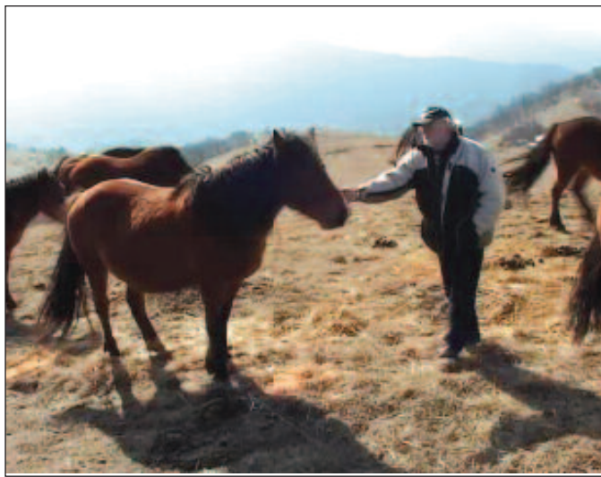
Ово су питоми коњи и сваки има свог власника

хране. Уз помоћ људи из града Краљева овај пројекат би могао брже да се реализује. Међутим укидање субвенција од стране државе за власнике коња 2011.