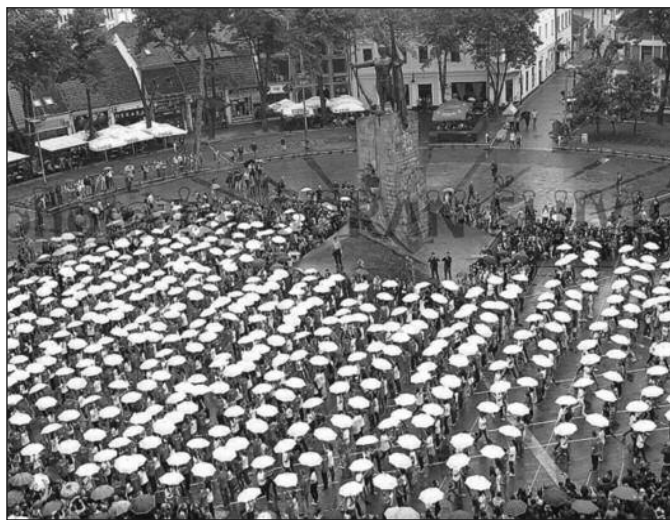
Киша није покварила догађај - плес краљевачких матураната

Веома сам срећна што могу да учествујем у матурском плесу. Једни смо од ретких градова у Србији и уопште у Европи који могу да се похвале оваквом традицијом. Планирам да упишем Војну Академију. Своју будућност видим у Србији и мислим да има места за све нас младе људе - рекла је краљевачка матуранткиња