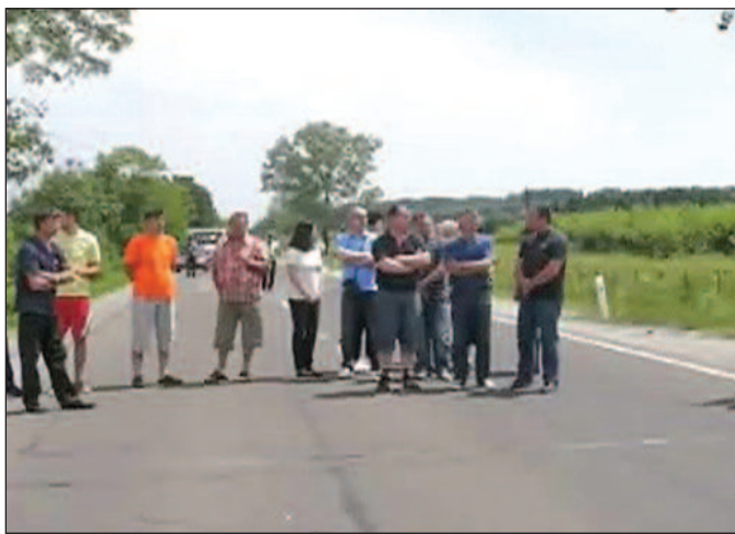
Огорчени - мештани блокирали магистралну

добро, имала је операцију и сада је добро. Придружио сам се овом спонтаном окупљању како би се коначно нешто решило и обезбедио овај део пута за децу и у