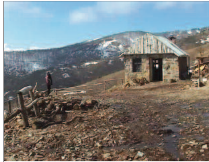
Чланови Удружења сопственим средствима изградиле камену кућу

њихов дом већ скоро три деценије. Број грла би могао и да се увећа када би политичари имали довољно слуха, јер коњи су јако корисне животиње. Њихов боравак у природи унапређује биодиверзитет и помаже очувању угрожених и елиминацији инвазивних врста којима се коњи хране, па представљају праве чистаче пашњака. Још једна добит могла би да буде туристичко оживљавање Столова. Потребно је да се путна инфраструктура поправи како би и туристи из иностранства уживали на нашој планини. Са Столова поглед сеже далеко и види се