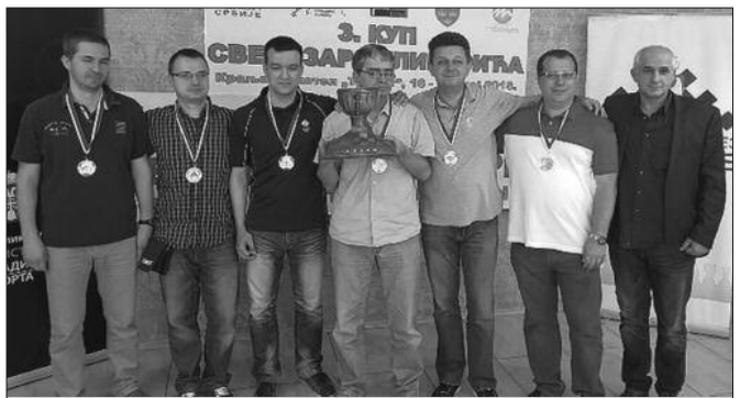
Новосадски шах клуб ДДОР победник Купа