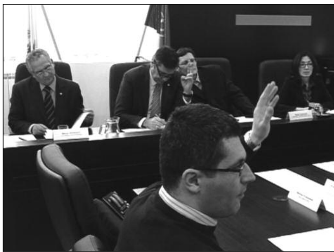
Одобрена исплата једнократне помоћи за два домаћинства у Адранима

-Требало је подржати јо нека удружења, али због недостатака документације, због неправдања средстава у претходном периоду, али и због самих предлога које су доста-