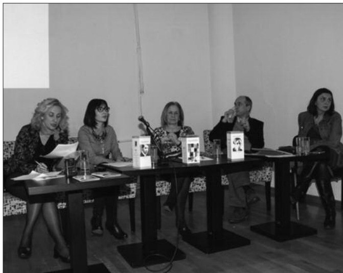
Краљевачки библиотекари у Студентском културном центру