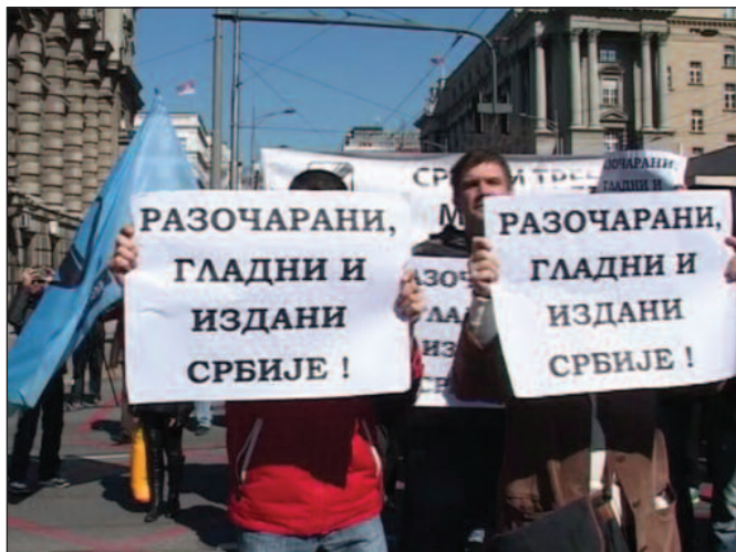
Протест у Београду није изнедрио договор

Реакција на то биће потпуна обустава рада у понедељак, ако се не деси неко чудо па у петак добијемо пуну плату, а од уторка радићемо само оно што је обавезно по Закону. То значи да ћемо само држати редовне часове од 30 минута и обављати поправне и ванредне испите. Али неће бити допунске и додатне наставе, такмичења, нема