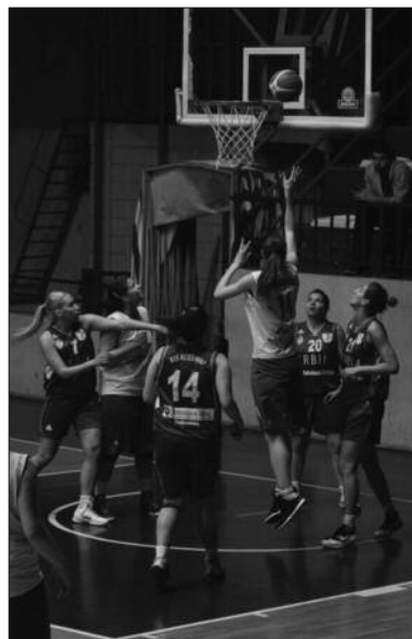
Риплијевских 103 разлике у Ужицу - детаљ са утакмице кошаркашица Краљева

–Циљ је да победимо све до краја, а видимо да свака наредна утакмица је нови мотив. Да се победи убедљивије, да испишемо нове странице историје клуба.