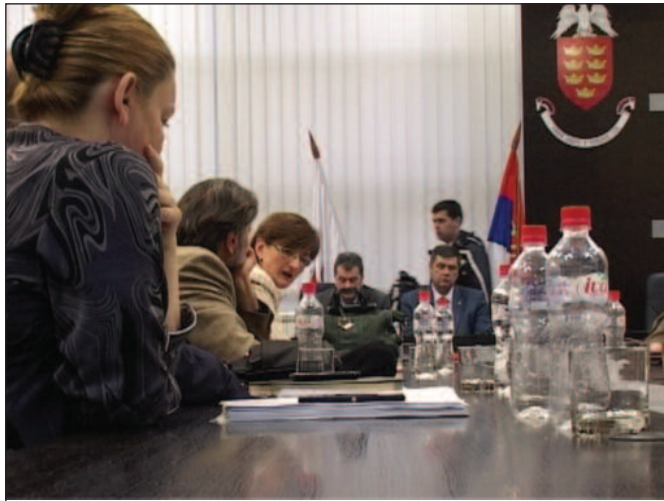
Такву промоцију на ЦНН и ББЦ Краљево никад не би имало

Симовић је додао да је свечану вечеру у Холету „Турист“ организовао и финансирао Тениски савез Србије, што је и пракса када је Дејвис куп у питању, те да је по особи цена била од 20 до 25 евра. „Дане тениса“ пратили су бројни културни, музички и забавни садржаји, али и за краљевачке услове велики привредни сајам са 37 излагача из Рашког, Расинског и Моравичког округа. Овакви догађаји, на-