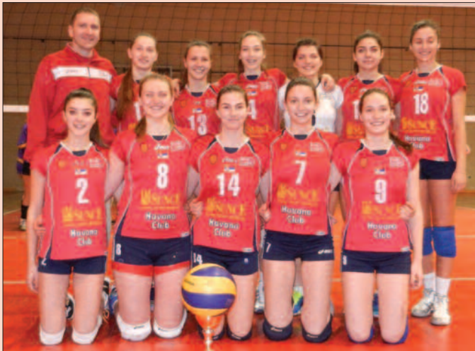
Без пораза у 2015. - одбојкашице Гимназијалца

-Могуће да буде тако, али пре тога ми морамо да одиграмо још