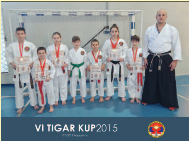
VI TIGAR KUP 2015

нове у карате школу понедељком, средом и петком од 19 сати у карате вртић Колибри (од 3 до 6 година) и почетничку групу (од 7-107 година) у улици Цара Лазара 62 Т.Ц (преко пута Медицине рада).