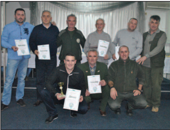
Захвалнице ловцима, организацијама, тв кућама

Централну прославу и дружење организовали су Ловачко удружење »Краљево«, Ловачко друштво »Столови« и домаћин - секција Драгосињци, под окриљем Ловачког