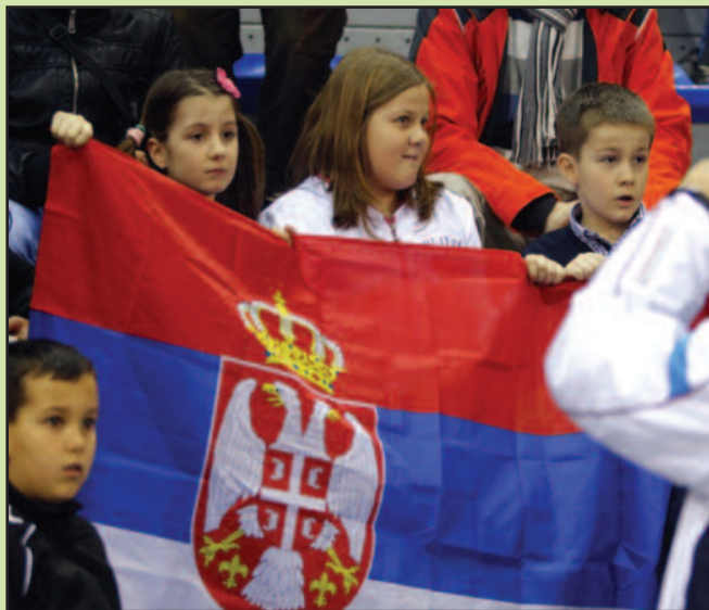
Увек имати на уму тениско ферплеј понашање

Забрањено је: - уношење хране и пића у дворану - уношење професионалних камера и фотоапарата - уношење предмета који могу од стране редарске службе бити окарактерисани као опасни (мотке за заставе и слично) - уношење пиротехничких средстава - забрањен је улаз особама у видно алкохолисаном стању - забрањено је истицања парола и натписа било какве политичке садржине или парола и натписа који