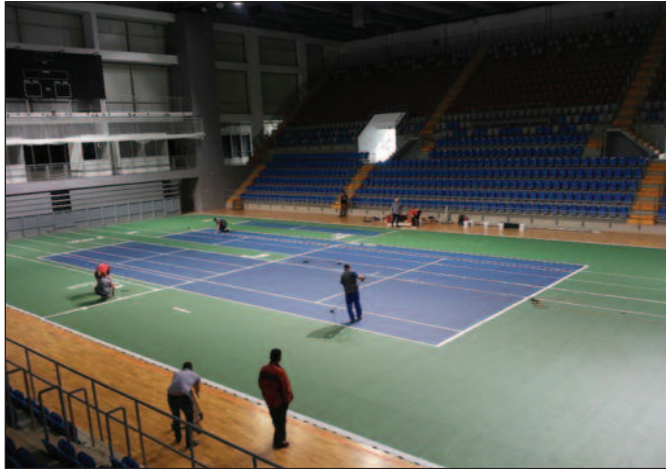
Терен у новој дворани у Краљеву

Саставни део сваког тенског меча су и деца задужена за скупљање лоптица. У пратњи родитеља деца са простора целе Западне Србије и Шумадије имала састанак са органи-