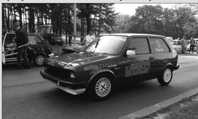
Шампионски аутомобил из АМСК КВ рејсинг тим