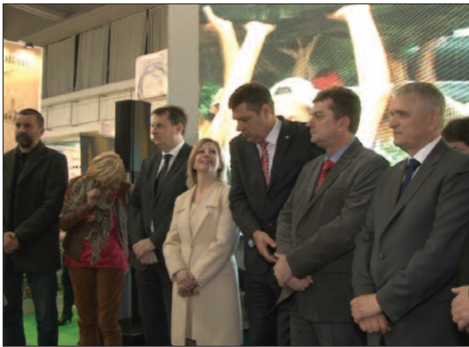
Интересовање за Дејвис куп меч искоришћено за комплетну промоцију Краљево

Од меча деценије у Краљево очекује се и повољан утицај на привреду града на Ибру.