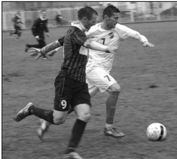
Детаљ са меча Слобода-Слога у Ужицу

У међувремену, имала је и Слога своје прилике. У два наврата Анђелковић је могао озбиљније да угрози гол-