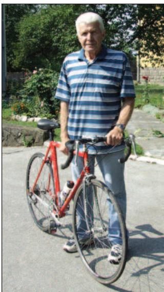
Увек са бициклом

Том приликом евоциране су успомене на старе, славне дане. Друштво је остало