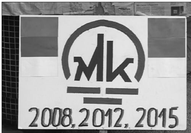
Никада се нисмо одрекли 20 одсто зараде, тврде радници

Суноврат гиганта „Магнохром“ отпочео је 2006. године. „Краљ челика“ и четврти човек на листи најбогатијих људи на свету, Индијца Лакшмија Митал, купио је „Магнохром“ 21.7.2006. године. Како је стекао богатство тако га је и увећао, сечом високих пећи које је касније прето топио у челик. Компанија „Глобал стил“ на чијем је челу Индијца није плаћала раднике, па су протести радника против тадашњих власника кренули у Краљеву. Агенција за приватизацију је реаговала прекасно и раскинула је уговор после 2 године пељешења „Магнохрома“, а Индијци су отишли кућу са „новчаником“ увећаним за 1,7 милиона евра покраденим од „Магнохрома“. За то