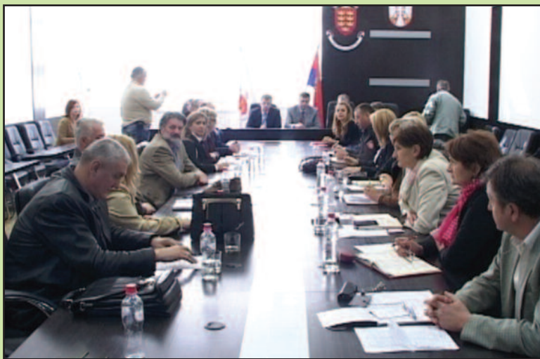
Свима треба да покажемо дух домаћина из Шумадије

Надлежне градоначелници града су саопштили да је Краљево спремно да представимо у најлепшем светлу. Ово је догађај свих нас, свих грађана и морамо као добри домаћини да покажемо