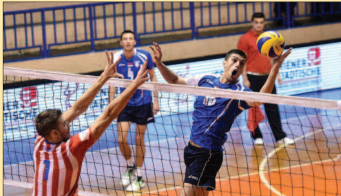
Мускетари спремни за шумадијски дерби - детаљ са утакмице Рибница - Ц.Звезда

Јако добра, тешка и више него узбудљива утакмица. За разлику од неких ра-