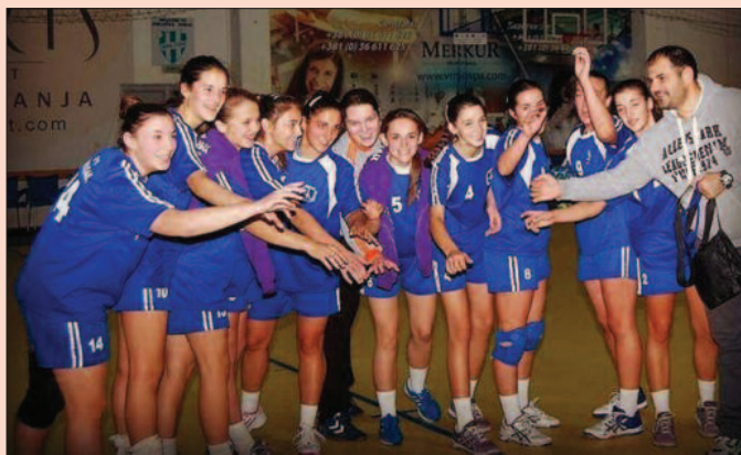
Осмех и на старту другог дела сезоне - рукометашице Металца

месту на табели и у наредном колу чанског Кушутњака.