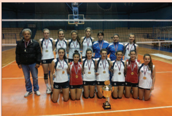
А летос се славило данас последње - одбојкашице Економца са пехаром првака Друге лиге

Економица је остао на зачељу табеле, без победе и са само једним освојеним бодом. У наредном колу Економица гостује у Крагујевцу екипи Радничког (субота 18ч).