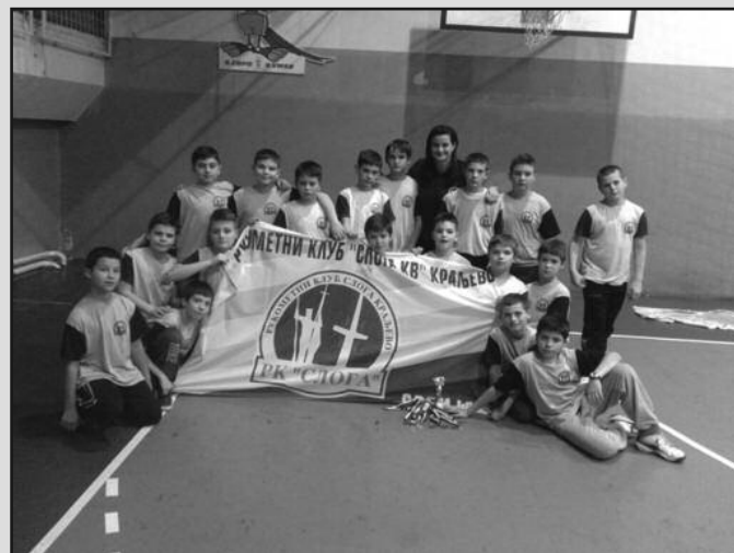
Будући асови: млади рукометаша краљевачке Слоге