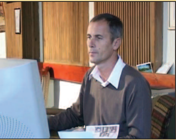
...тко Бечки, новинар у краљевачком дописништву РТС-а

...р дописништва РТС-а у Краљеву, добит- ...де фестивала „Прес витез“ за ТВ ми- ...рудна“