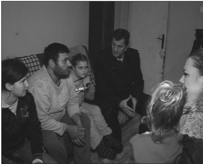
Основна идеја била је помоћ социјално угроженима

школа, Градске управе, политичких и других организација), бројна удружења грађана, установе, предузећа, као и више десетина