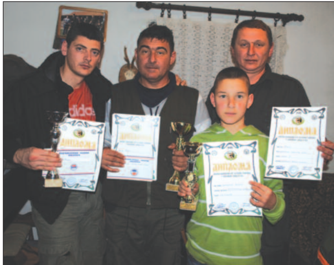
Ловци-такмичари који су сакупили највише бодова