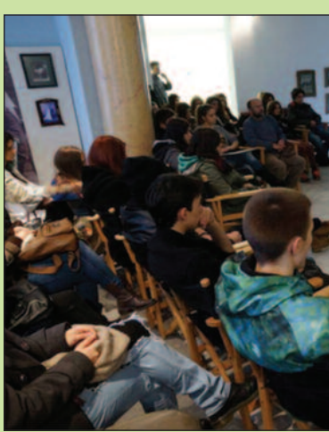
Изложба и предавање у Народ

сликарке, породице Гаталовић, којој се придружила и Галерија САНУ, девети децембар, датум њеног рођења, обележен је широм Србије. Наиме, идеја је да се удруже