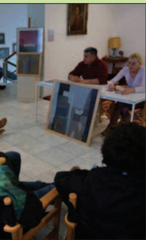
...дном музеју у Краљеву