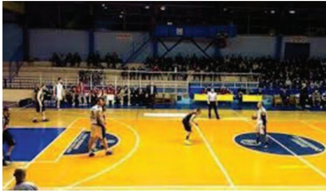
Детаљ са утакмице у кутији шибица

У наставку Панчевци су одржавали предност, а највећа је била у 18. минуту (20:34). Ипак другу четвртину овог меча гле-