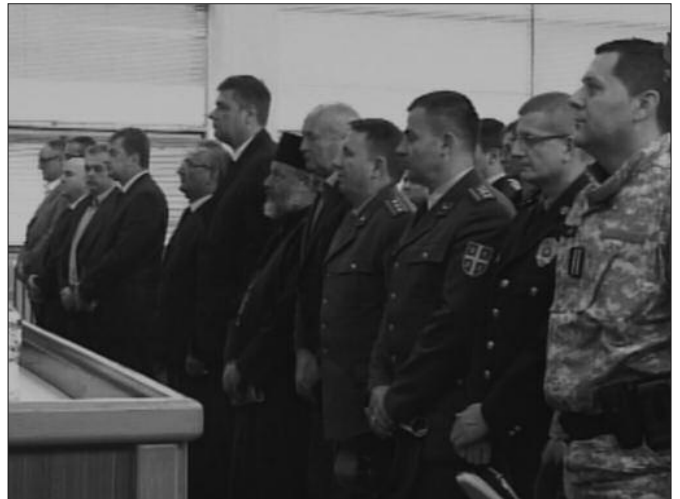
Минутом ћутања одата пошта невиним жртвама

Хапшење и стрељање је трајало 16 дана. Немачка пресуда је изречена без суда.... Острашћени, и нељуди у лику људи, али и лишени минималног обележја људскости, нису правили селекцију жртва. Сваки становник Краљева који се тог дана нашао на улици постао је жртва - жене, деца, инвалиди, болесни, стари, млади, људи различитог порекла, образовања. Само им је било заједничко то што су се тих дана, тог тренутка, затекли у Краљеву и на том месту.