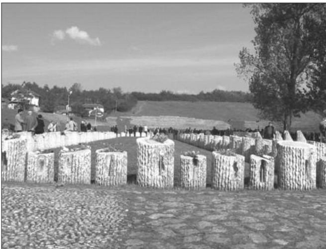
Најтрагичнији догађај у историји Краљева

Град Краљево и његови житељи претрпели су од 14. до 20. октобра највеће страдање у својој историји. Жртве су били цивили, хришћани, над којима је извршена одмазда од стране окупационе власти немачког Вермахта, сатављене углавном