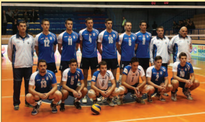
ОК Рибница у новој такмичарској сезони

иницијативу и резултатску предност. Једна потпуно нова екипа Рибнице, још увек недовољно уиграна, са чак 25 поентерских грешака (!), ниједног тренутка није могла да их угрози.