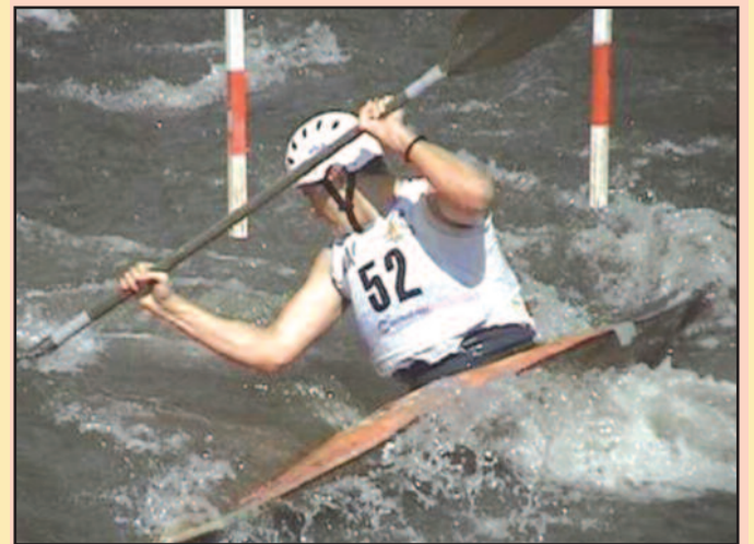
Искористили михољско лето: кајакаши на дивљим водама

ска манифестација са најдужим стажом у граду окупиле је најбоље дивљоводаше из Србије чиме је спуштена завеса на ову такмичарску сезону. Такмичари краљевачког Ибра и Студенице из Ушћа остварили су запажене резултате.