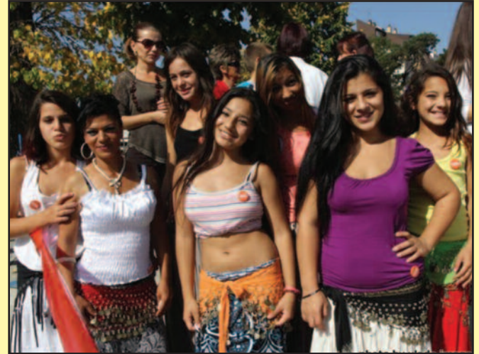
Лепо је видети осмех на лицима младих

највећи када је најпотребније. Манифестација „Оживи осмех“, хуманитарног карактера, окупила је и ујединила све у намери да се помогне онима који немају, чији су домови уништени у поплавама. И да, успели смо, вратили смо осмех на лица свих. Акција „Оживи осмех“