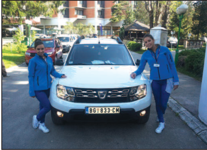
Дачија Дастер - хит на овогодишњем „Дачија каравану“

Посетиоци из Врњачке Бање и околине, али и из других градова