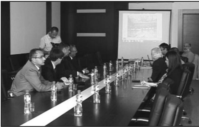
Конкретни договори градског руководства и стручњака ЦИП-а

- Познато ми је да је Влада Србије формирала четрдесетак тимова који је