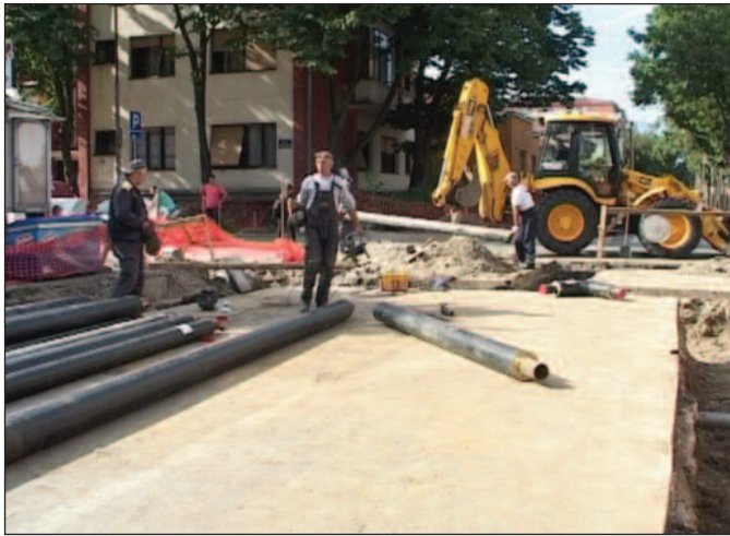
Завршава се замена магистралног топловода

-Ја мислим да се неће мењати цена грејања. Претпостављам да