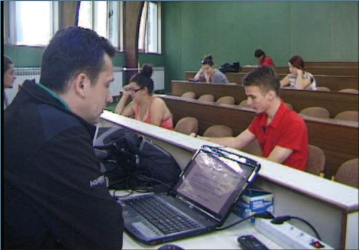
За студенте обезбеђен смештај у студентском дому

Конкурсни рок је отворен до 4. септембра, а пријемни испит из математике одржаће се 5.