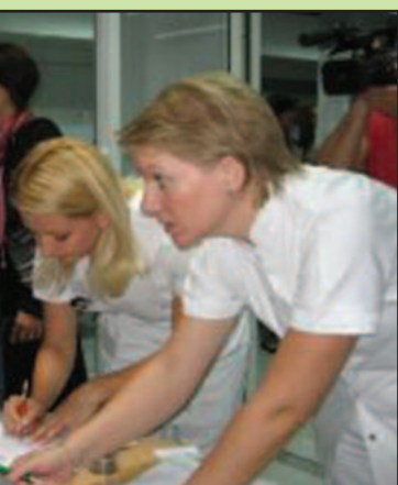
х картица у ЗЦ „Студеница“

теклих 5 година потписало донорске картице, а у Краљеви више од 2000 охрабрујуће бројке које указују да се свест грађана променила када су у • Потребно је око милион и по донорских картица да би Србија приступила тиме би се знатно смањила листа чекања на трансплантацију