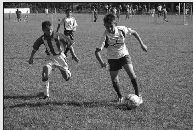
Детаљ са једне утакмице „Трофеја Карађорђе“

њачког Брда већ су почели осми „Трофеј Карађорђе“. А.Д.