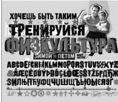
Насловна страна новог броја „Повеље“

повеља Часопис за књижевност, уметност и културу 2. 2014.