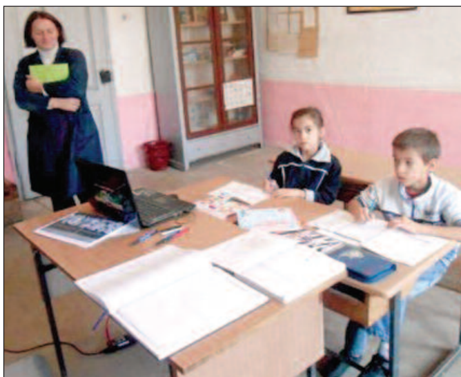
Скоро 35.000 наставника нема пун фонд часова

Живановић је навео пример Земунске гимназије којој је дозвољено да расписује конкурс за наставника историје