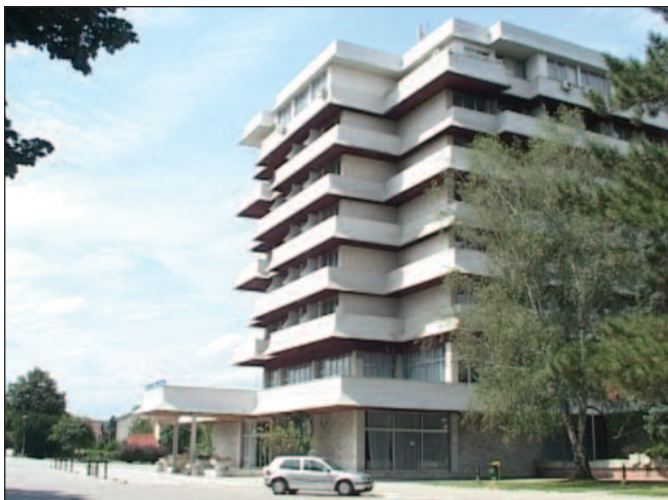
Матарушка Бања више не привлачи пажњу туриста

-Број гостију у Матарушкој Бањи мањи је између 25 и 30 одсто, док је у Богutowачкој Бањи мањи за негде око 20 одсто. То ће се наравно финансијски одразити на предузеће, али ми успевамо на неки начин да сервисирамо наше основне потребе. Редовно отплаћујемо рате за кредит, који смо узели још у 2012. и 2013. години. Тај кредит ће следећег месеца бити потпуно исплаћен, тако да смо