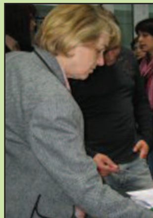
Потписивање доносних картица

- Почели смо 2009. године бојажљиво и са стрепњом да ли ће то уопште заживети у нашем граду. Ево сада, после 5 година, има 2015 потписаних доносних картица. Трансплантација као метод лечења је већ прихваћена у нашој земљи. Данас се код нас трансплантације бубрега раде рутински, буквално као што се оперише слепо црево. Свест се веома брзо развила у последње 2 године, а захвалност дугујемо ме-