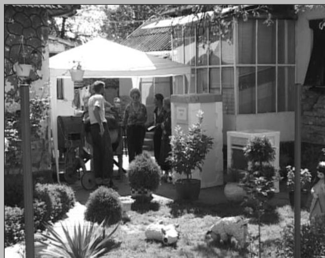
Помоћ за породице са већим бројем деце

„Критеријум је био једноставан - вишечлане породице и породице са већим бројем деце које су претрпеле штету од поплава, што се уклапа како у политику Српске братске помоћи, тако и у политику Покрета Двери. Ми увек истичемо да нам породице морају бити на првом месту и да морамо помоћи породицама са више деце, нагласио је Бошко Обрадовић из покрета Двери