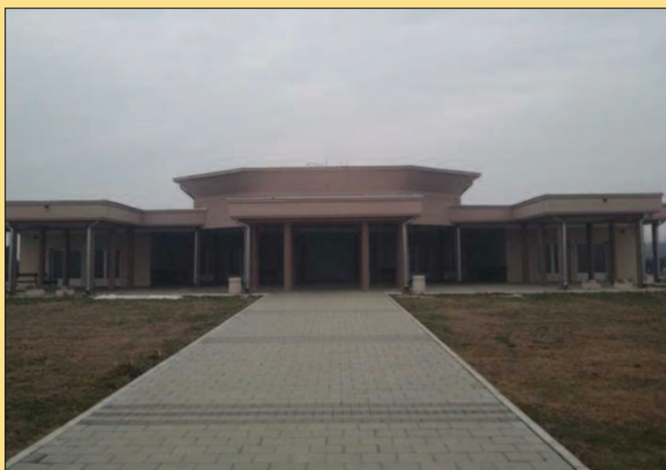
Нова капела на „Барутани“

Површина новог градског гробља износи 5.5 хектара, а са отварањем две нове парцеле „Барутана“ ће се попуњити у наредне две године, а после тога тражиће се решење за нова гробља. Како незванично сазнајемо, планирано је да то буду локације у Јарчујаку и на Буњачком брду.