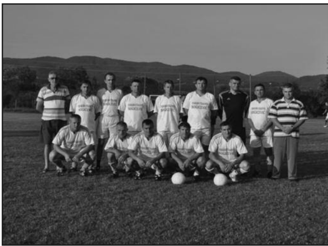
Ветерани ФК „Борца“ из Адрана

Ф.К. "Борац", снаге су одмерили су Ф.К. "Орловац" из Мрчајеваца и „Амига-Огрев“ из Краљева. Ветерани „Амига-Огрева“ победили су колеге из Мрчајевца са 1:0.