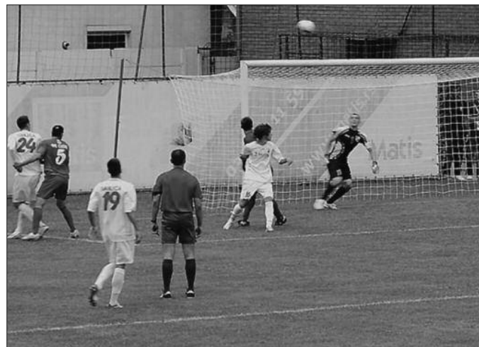
Домаћи бели победили у смирају меча: детаљ са утакмице између Јавора и Слоге

зато се спремасмо за меч са Бачком као да је квалификациони. Морамо да победимо и то можемо урадити ако пружимо игру на нивоу и изнад могућности нашег тима. То очекујем од играча. Бачку уважавам, новајлије су у лиги и чињеница да су били прваци Српске лиге „Војводина“