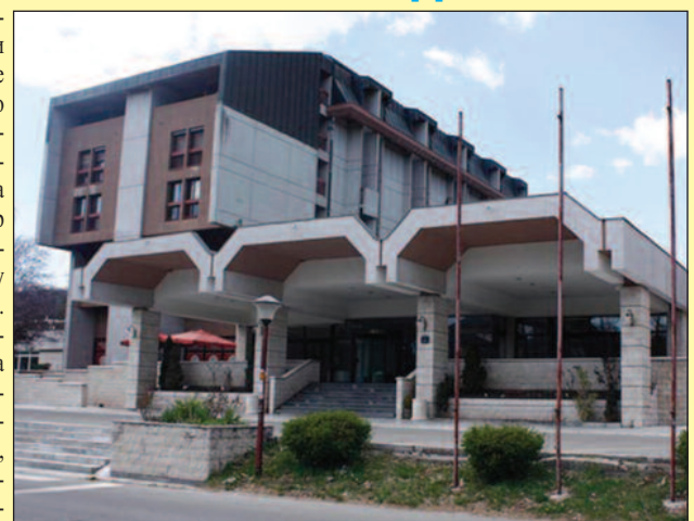
Хотел „Гранд“ има и затворен базен