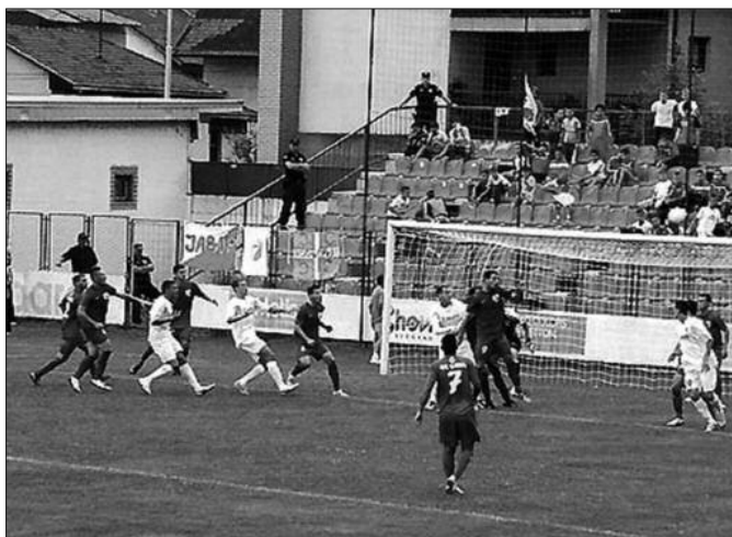
Гужва пред голом Слоге: детаљ са утакмице у Ивањици

- Играчима не замерам и нисам незадовољан. Напротив,