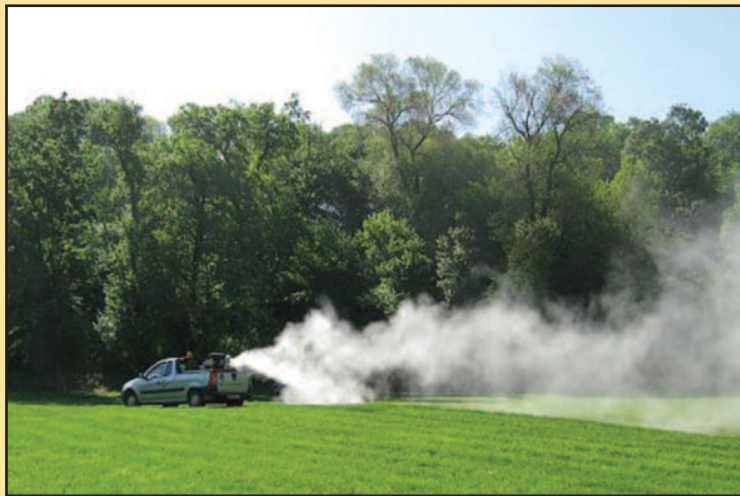
Због кише нека подручја се третирају и пет пута

-Наш задатак је да попу- лацију комараца држимо под неким толерантним бројем, а то радимо честим третирањем појединих подручја, без обзира што нису угово- рена. Постоје подручја у граду која су четири, пет пута третирана, рекао је мр