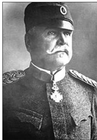
Генерал Степа Степановић

ном Граду. На другом месту, Аустроугари су успели да одбију српску 3. армију, терајући је да изманеврише једну од својих дивизија како би заштитила прилаз Ваљево, коме је претила 42. планинска дивизија.