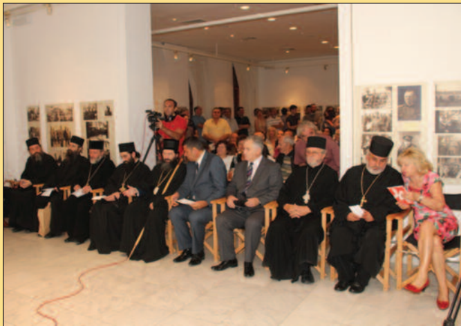
Најзначајнија преображењска манифестација у Србији

Чекају нас велики и важни послови, пре свих, да санирамо последице непогода које су нас недавно снашле и унесрећенима помогнемо да зиму дочекају под својим кровом. Све ће то бити знатно лакше и ефикасније ако будемо сложни и чврсти у тој намери, вољи, хуманости и пре-