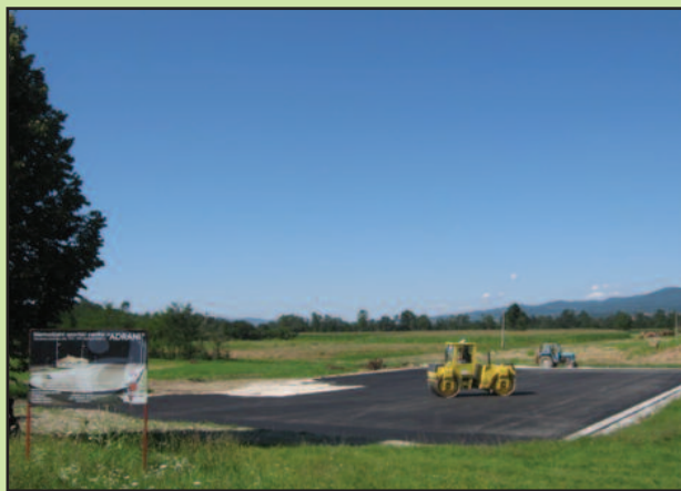
До краја године осветљење и амфитеатар