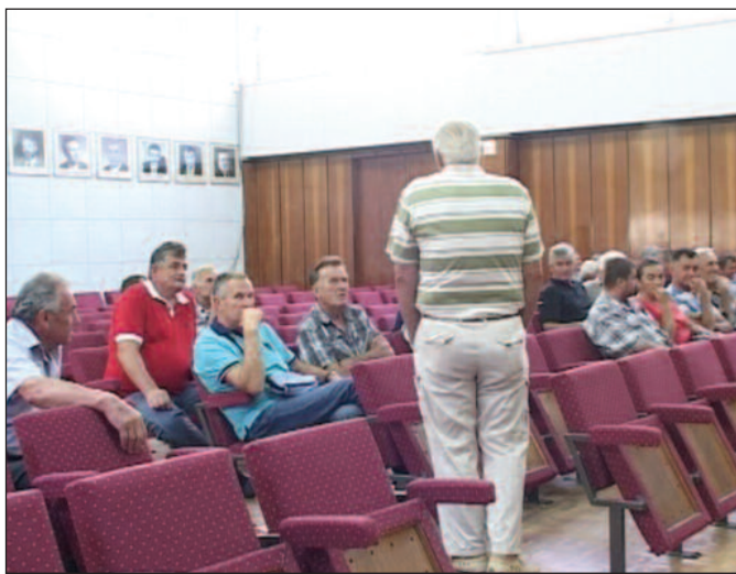
Није нам јасно шта се ту дешава

-Окупили смо се да би смо изразили незадовољство и затражили помоћ, ако неко још може да нам помогне. Неко је затајио, мислим у локалној самоуправи, јер Републичком фонду за подстицај пољопривреде нису предати спискови домаћинстава из краљевачког краја, пострадалих у поплавама. У руци држим списак 122 домаћинства из Заклопаче и Врбе од којих је само пет добило помоћ, остали ништа. Сами нешто да учинимо не можемо, јер оно што смо у земљу инвестирали, у