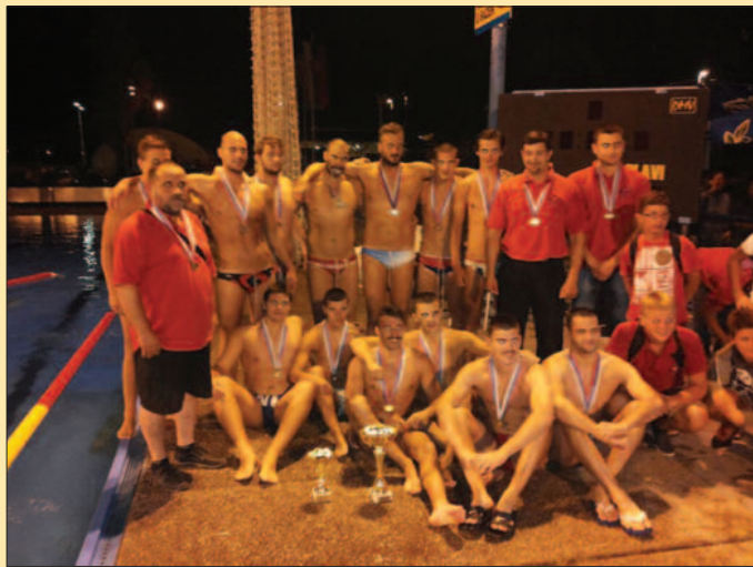
Ватерполисти Краљева прваци Друге лиге за 2014. годину