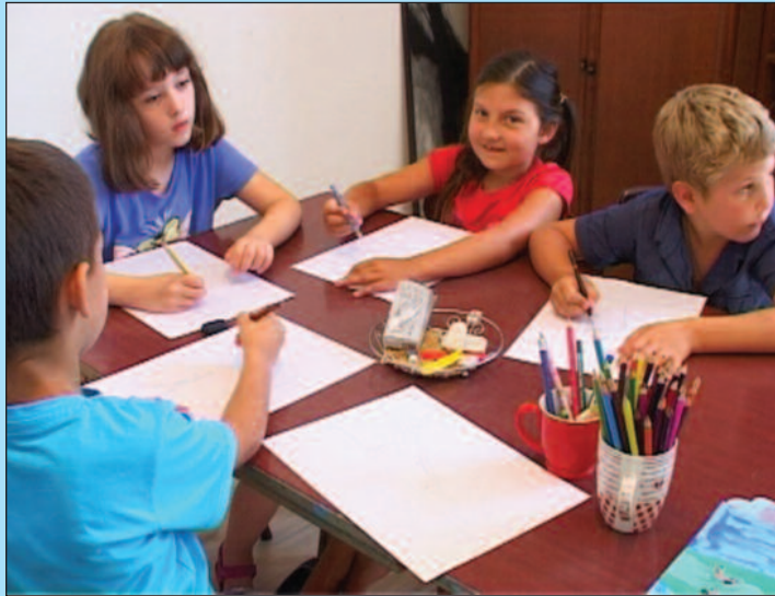
Уче да правилно цртају, правилно гледају и сликају

- Уписала сам се пре неки дан. Много волим сликање, то је био мој сан. Кад порастем бићу сликарка. Овде је прелепо,