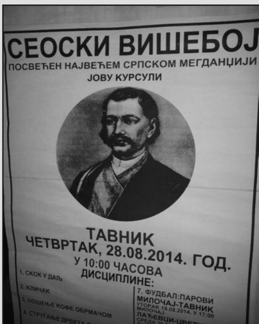
Позив на мегдан - најважније сеоског вишебоја у Тавнику

Прошле године одржано је прво такмичење сеоског вишебоја, а домаћин је било село Цветке. Такмичење посвећено највећем српском мегданцији Јовану Курсули показало се као пун погодак, окупило је сва села подно Котленика, а први победник постало је село Тавник.