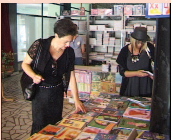
Одличан асортиман по повољним ценама

Тако комплетан и изузетно квалитетан основни школски прибор у књижарама пред- узећа „Ласер“ у Краљеву кошта од 6 до 8 хиљада ди- нара. Цене свезака А 5 фор- мата крећу се од 14, 90 до 60 динара, свезака А4 од 29, 90 до 120 динара, најјефтинији ранац кошта 800, а најскупљи 3900 динара, пернице су од 30 до 850 динара, темпере од 160 до 450 динара. Ту су и црвене бојице по цени од 70 до 320 динара, гумице од 5 до 30 динара, фломастери од 100 до 350 динара, графитне