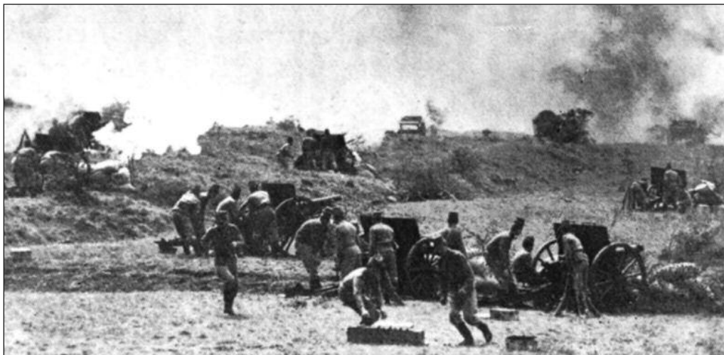
Српска победа која је задивила цео свет

Други српски команданти су такође изјавили да су аустроугарске снаге починиле бројне одмазде у српским селима током битке.