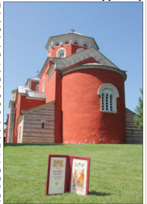
Узори у историјској баштини