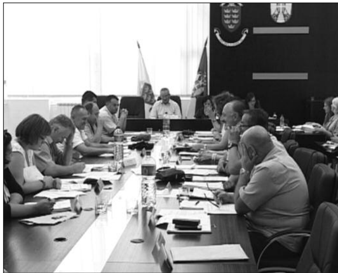
Ускоро ће се директори јавних предузећа бирати на конкурс

-Град Краљево ће наставити и даље, по усвојеним критеријумима, за оне који их испуњавају, да исплаћује средства за санацију од поплава. На то неће утицати одлука Владе и евентуална исплата тих средстава, дакле настојаћемо да обештетимо и помогнемо сваком суграђанину који је претрпео штету од пролећних поплава. Одлучили смо, такође, да још облажимо поменуте критеријуме како би уважили свако домаћинство које је претрпело било какву штету, а у коме је живела нека породица, закљу-