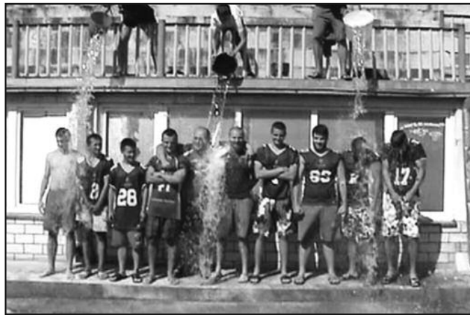
Краљевчани прихватили ледени изазов

сти или колективи на себе излију канту ледене воде, а притом донирају новац и изазову следеће три особе које то исто треба да направе