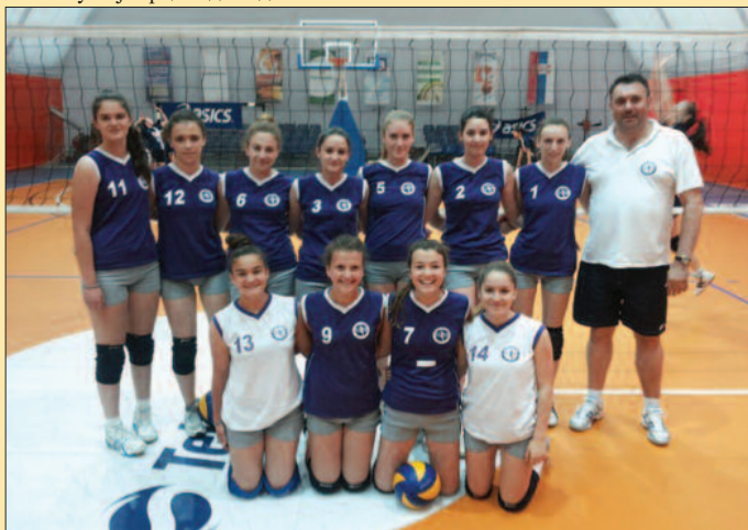
Техничар 1 победник турнира у ОКЕНИКУ

велики број пријатеља које смо стекли за кратко време колико Техничар постоји. То говори да смо на добром путу, да добро радимо, да смо поставили стандарде испод којих нећемо. Уосталом, једини смо клуб у Краљеву који организује током године неки турнир, тако да и то даје одређену величину. Жеља нам је била да се деца и сви ми који радимо у клубовима дружимо, да проведемо један дан у хаскању, добром расположењу, да победи одбојка и види се да смо у томе успели. Такође, Техничар је представио на једном месту 36 играча у мушкој и женској конкуренцији и сигурно још