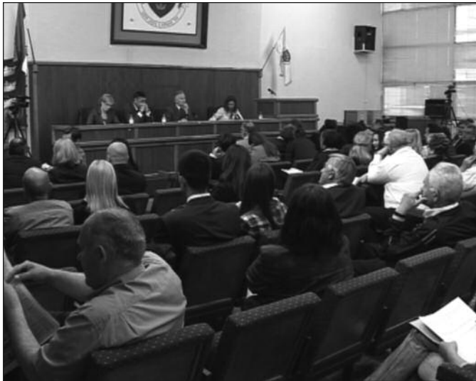
Опозиција тражила и исцрпан извештај о градоначелниковом двогодишњем раду