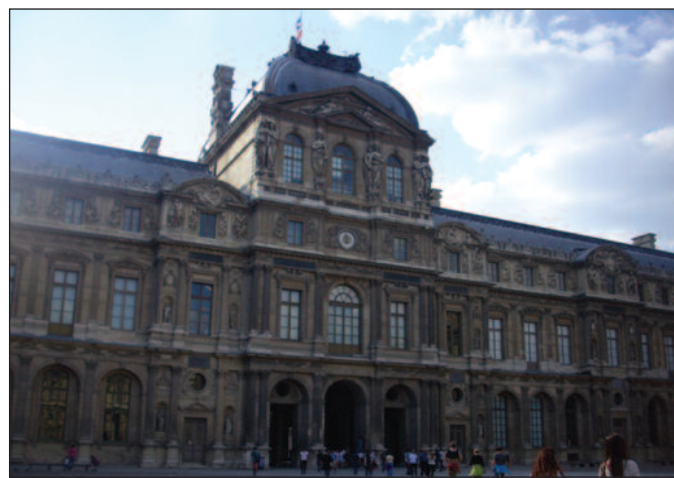
Лувр - најбогатији музеј на свету

са богатим ратним пленом. Након његовог пораза нека уметничка дела су враћена, али је већина остала у власништву Музеја. Из-