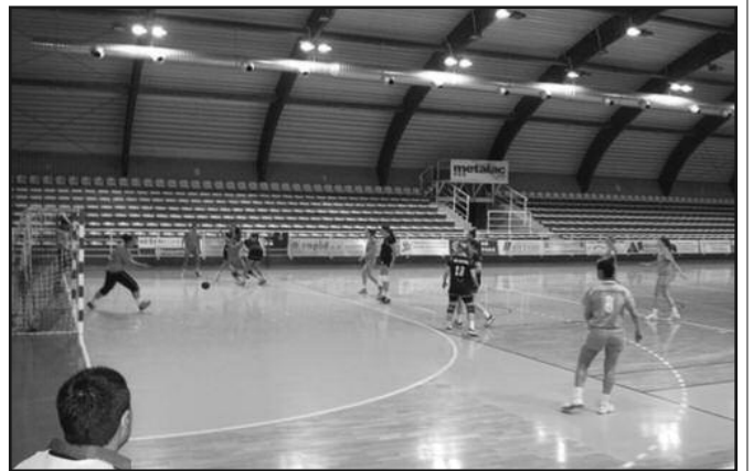
Детаљ са утакмице рукометашица

И пред почетак мини лиге сам рекао да је Металац у овој конкуренцији најслабији и да ће сваки бод за нас бити премија. Нисмо освојили ниједан, али вредно скупљамо искуство за наредну сезону која је историјска за наш клуб, јер ћемо коначно играти у Краљеву, у новој дворани и верујем успети временом да стигнемо до елите. Сада је