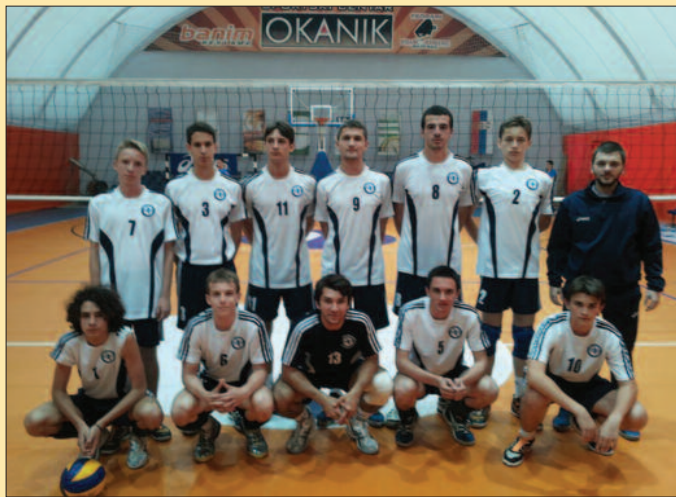
ОК Техничар победник турнира одбојкаша у ОКЕНИКУ

цео један тим из оправданих разлога није могао да буде у „ОКАНИКУ“. То је велико богатство, велика база из