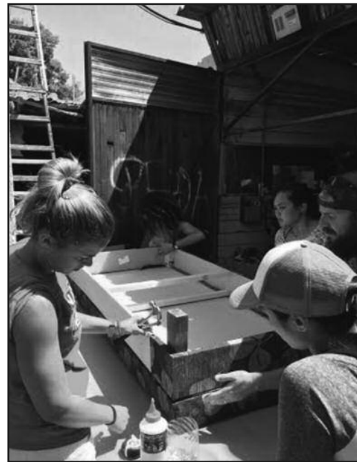
Купили материјал и направили кревете

Након повратка из Обреновца, наставили су са пружањем помоћи у Краљеву. Организован је пројекат прављења кревета, једне од најпотребнијих ствари људима који су настрадали у поплавама. Прикупљена су средства за израду