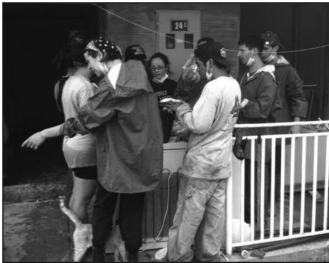
Краљевчани и Хавајци у Обреновцу

Краљевачки клуб америчког фудбала је организовао прикупљање и дистрибуцију хране, хигијенских средстава, обуће и одеће страдалима, као и у санирање последица поплава на терену. Амерички студенти су са играчима клуба помагали тамо где је било најгоре - у Обреновцу. Само дан после апела Америчке амбасе у Србији, „Круне“ и Хавајци су се организовали и стигли Обреновчанима у помоћ. Иако нигде нису же-