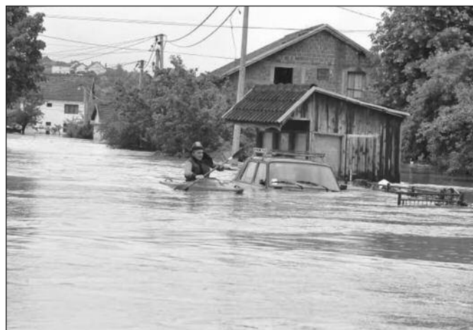
Помоћ се даје власнику за једну породичну кућу

Захтеве за једнократну помоћ угрожена лица могу поднети на шалтеру у приземљу Градске управе, а рок за подношење захтева је до краја идуће недеље. Подносиоци захтева потписиваће изјаву да ће једнократну помоћ користити само у сврху отклањања штете од поплава. Право на новчану помоћ, према прелиминарном списку, за сада су остварила 423 лица.