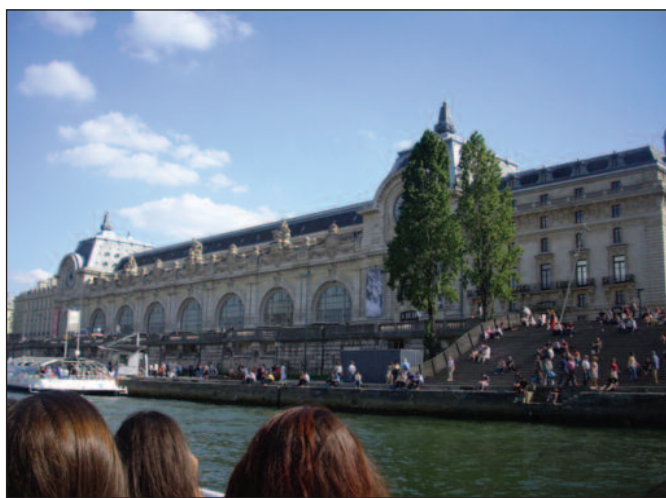
Музеј Орсеј, један од најлепших у Паризу

Сеном се плови поред најзначајнијих знаменитости Париза. Пловили смо поред Лувра, музеја који годишње посети осам милиона туриста и који изгледа импозантно, затим поред једног од најзначајнијих музеја импресионизма у свету - Орсеја, који је смештен у згради некадашње железничке станице. Овај музеј многи сматрају за један од најлепших у Паризу. Са брода се још може видети Консијержије, направљен као краљевска палата, а за време француске револуције служио је као затвор са најпознатијим затвореником, Маријом Антоанетом, која је касније осуђена на смрт и гиљотинирана. У Консијержијеу гиљотина је постојала