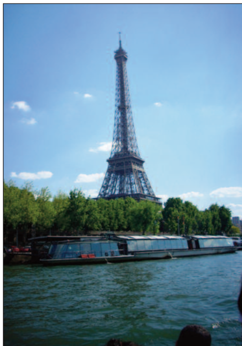
Ајфелов торањ - поглед са Сене

бродом. Туристички бродови на Сени још се зову и „бродови мушица“, названи по облацима инсеката које привлаче рефлектори на броду. Укрцавамо се на један такав брод, а све карте опет су платили наши домаћини. Разгледање града на овај начин не пропушта готово ниједан туриста. На реци Сени налази се 37 мостова. Неколико од њих има занимљиву причу. Постоји Мост љубави са катанцима. На њему се налази толико катанца да мост прети да се сруши под њиховом тежином. Па, мост Понт Мари. При проласку испод овог моста путници зајмуре, замисле жељу и пољубе првог сапутника до себе уколико желе да им се жеља испуни. Најстарији мост на Сени је Понт Неуф, а најлепши је мост Алек-