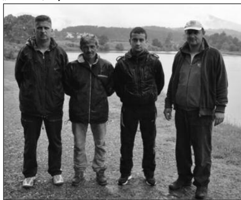
Екипа „Водовода“ и даље на првом месту