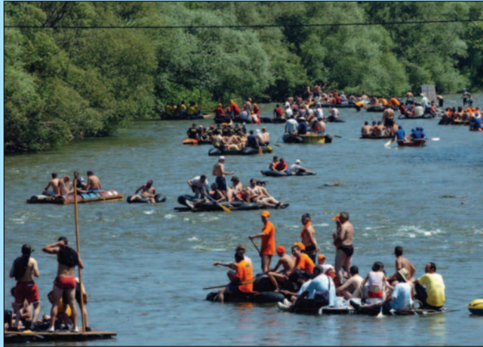
Безбедност спушташа стављена у први план

Највише времена Организациони одбор је на састанку посветио најважнијој теми -