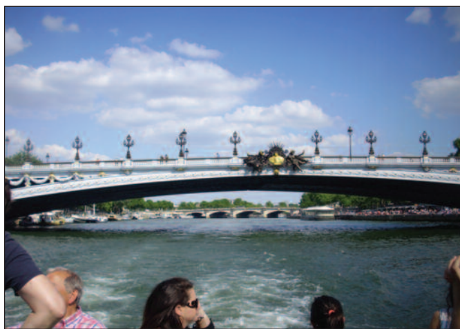
Мост Александар III подигнут у част руског цара

рале налази се „нулта тачка Француске“, од које почињу сва мерења. Било је време да се метроом вратимо до наше нулте тачке, цркве Светог Саве. Дочекала нас је вечера коју су наши домаћини спремили за нас. Дружили смо се, размењивали адресе и spremали се да кренемо назад за Србију. Сви домаћини су изашли да се поздраве и да нас отпрате, а spremали су нам сендвиче и пиће за пут. Из Париза кренули смо један сат иза поноћи. Домаћини су пустили и по коју сузу, а ми ћемо њихово гостопримство заувек памтити. Песма се у аутобусу заорила одмах по поласку и трајала је до јутра. Париз нас је својим космополитским шмеком добио за сва времена и нема члана „Абрашевића“ који га не би поново обишао. Постоји и изрека која каже да ко једном посети Париз, сигурно ће се поново вртити. А до тада остају нам лепе успомене, пријатељства и анегдоте.