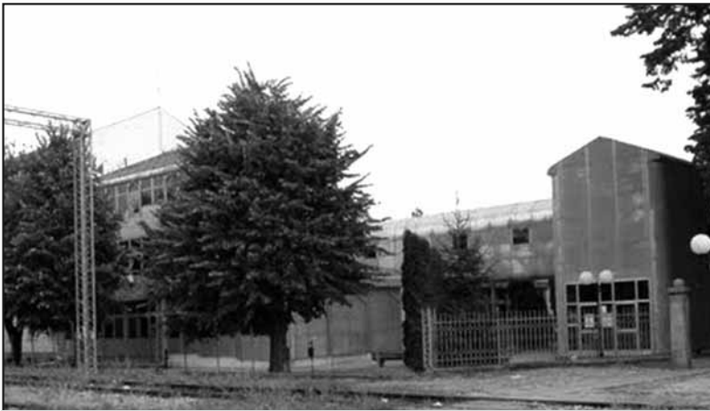
Машински факултет Краљево