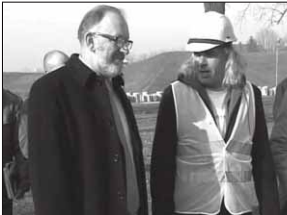
Градоначелник Краљева приликом обиласка радова у Спомен гробљу

Поред овога градоначелник Краљева је изразио очекивања да ће и многи други помоћи да се