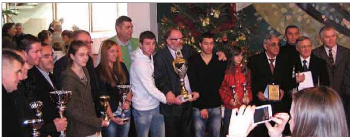
Сви награђени са градоначелником