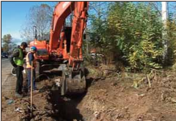
Поред пута – па за Совљак

У сваком случају најаву „побуне“ потекла је из Ратине. Из ове Ратине у којој успешно ради преко 40 привредних погона у којим егзистенцију за