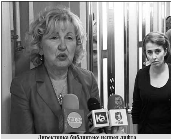
Директорка библиотеке испред лифта

- У летопису Народне библиотеке „Стефан Прво-