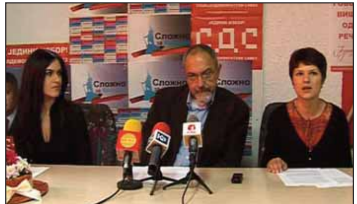
Детаљ са конференције за штампу Групе грађана Сложно за Краљево

Желимо да се наступи културно-уметничких друштава што више одржавају на селу, а у плану су и секције радионице ручних радова у покушају да од заборава сачувамо старе занате. Покушаћемо да и у села доведемо познате бендове, јер није нужно да они само наступају по градовима. У припреми је