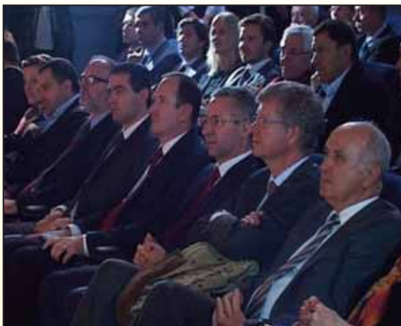
Амбасадори са домаћинима у Мултимедијалном центру „Кварт“