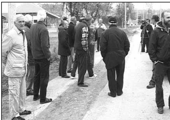
Изненађени и увређени - мештани улице Милке Боснић