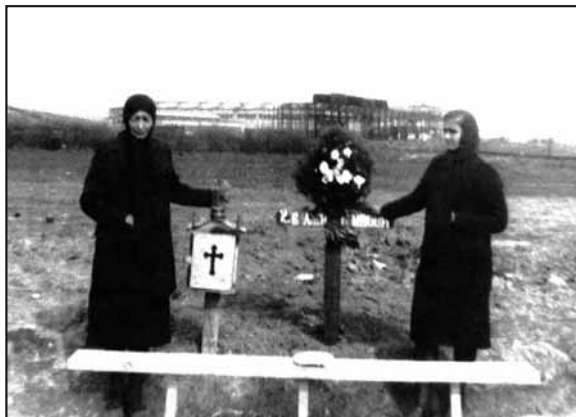
Прва крстача на гробљу стрељаних – у позадини локомотивска хала

Деценијама се у Краљево није ништа знало о судбини хале.