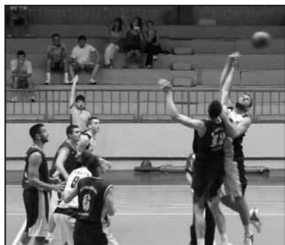
Са утакмице Слога - Машинац 2009. године

Запитали смо се чему све то, када огромна улагања и одрицања, чак проходност те, домаће Прве лиге, не доноси баш ништа, ни финансијски добитак, ни спортско напредовање. Клуб је био на чистом губитку, јер је за учествовање у прволигашкој конкуренцији било по-