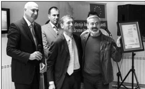
Дежер са сертификатом

вањем актера на локалном нивоу. Ми са милионима евра помажемо општине широм Србије и локалне власти на спровођењу пројеката на изради тендерске документације. Могу да кажем да