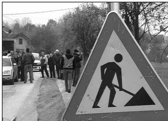
Изнанадни радови на улици

учињено више штете него користи. Оно што знам је да се само један човек јавно и директно изјаснио да ће имати користи јер ће само он моћи да се прикључи на канализациону мрежу, пошто су сви остали већ прикључени. Овај асфалт више никада неће