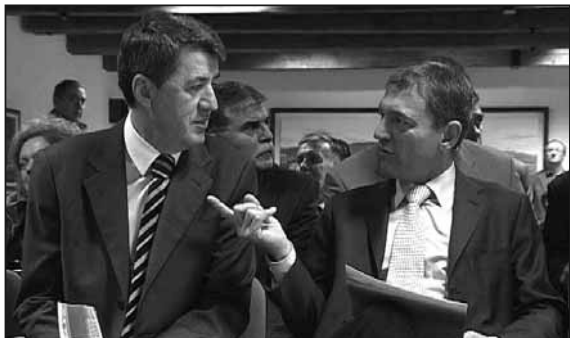
Министар просвете Жарко Обрадовић и Венсан Дежер

- Доста наших активности било је управо у области доброг управљања и изградње капацитета. Један од начина на који ми то желимо да радимо је изградњом кластера, односно удружи-