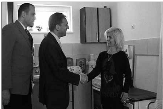
Дежер у пријатном разговору са станарима згаде

- Од пре месец дана то је постала стварност. Захваљујући напорима Града Краљева који је обезбедио земљиште и инфраструктуру опрему, захваљујући УНХЦР-у и њиховом имплементарном партнеру „Визији“ и за-