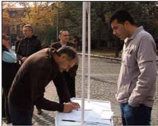
Краљевчани потписима против корупције