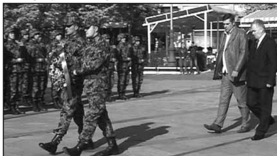
Председник Скупштине Града Краљева и његов заменик положили венце