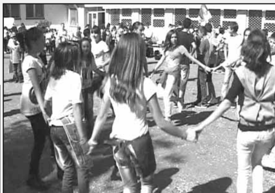
Коло деце занатлија

деље, а у којој ће малишани моћи да исажу своју креативност, таленте и жеље. Посебно желим да истакнем посвећеност и максималну ангажованост деце ометене у развоју,