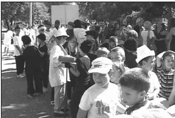
Пекари и оцачари

- Циљ ове манифестације био је да децу полако уведемо у активности поводом Дечје не-