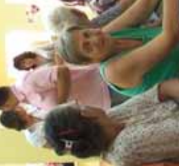
Детљав са дружења

Наиме, тога дана се у просторијама Месе заједнице Стара чаршија окупили они којима иве година олавно по косама мало, житељи овог дела града и заједнице.