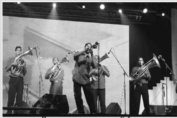
Прошлогодишњи учесници Сабора