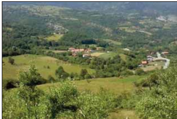
Поглед на Луке

мање, датума неутврђеног, а лета Господњег између 1183. и 1196. како историја каже. Поменуше се у тој повељи и Полумир и Церје.