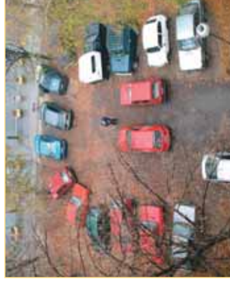
Снимљено на паркингу у Војводе Путника улици.