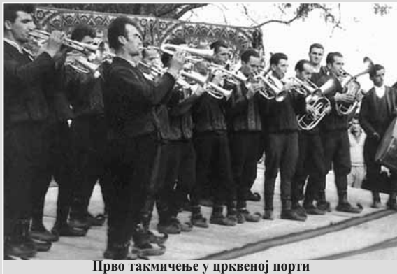
Прво такмичење у црквеној порти