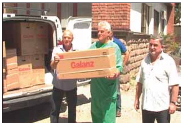
Донација клима уређаја ЗЦ Студеница

На конференцији за новинаре у Здравственом центру, краљевачки привредници истакли су низ проблема са којима се свакодневно суочавају. Зато је и основан Клуб привредника „Иницијатива 2012“ како би на