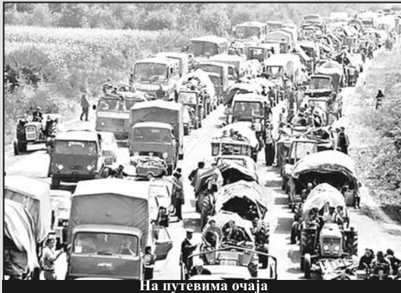
На путевима очаја

Ницале хумке украј путева. На многим ни крстача није пободена у земљу, на многим