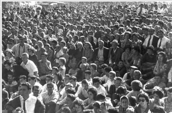
Први посетиоци Сабора