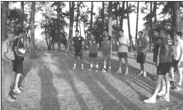
Први тренинг ОК Рибнице у „Борићима“

Поучени искуством из претходне сезоне када смо имали много проблема око селектирања тима и на крају играли са