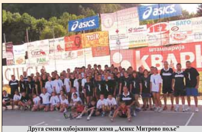
Друга смена одбојкашког кама „Асикс Митрово поље“