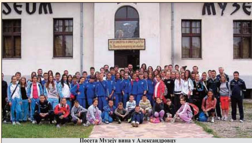
Посета Музеју вина у Александровцу