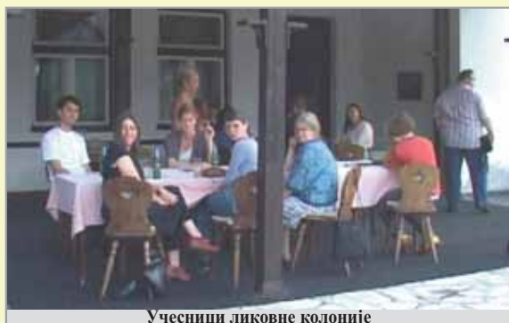
Учесници ликовне колоније

Опстанак Ликовне колоније „Студеница“ коју организује Туристичка организација Краљево не би био могућ без подршке града.