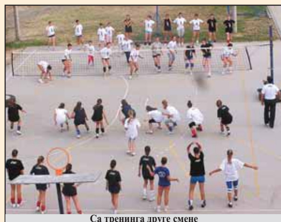
Са тренинга друге смене

- Друга смена је била пун погодак. Овај Камп је поодавно заслужио да се ради у две, па зашто не и у три смене. Деце је све више, сви желе овде да уче и усавшавају своје одбојкашко знање и то није случајно. Верујем да смо успели свим полазницима и прве и друге смене да барем за један проценат подигнемо ниво одбојкашког знања и да су овде много тога научили, не само од одбојци, већ од пријатељству, другарству, васпитању, дисци-