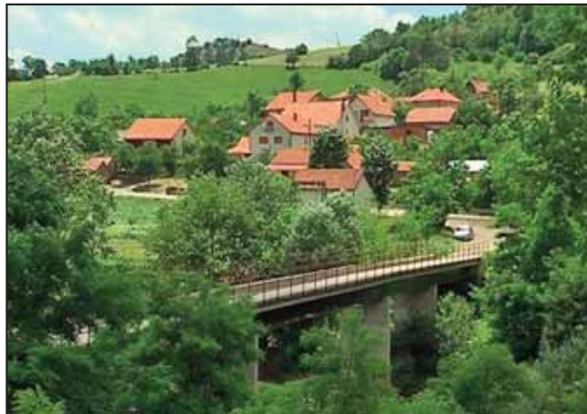
Преко новог моста

вом без обзира бежали. И људи путевима ходили кад се с једне на другу страни селили. Мање вољно, почесто пред силом и неправдом.