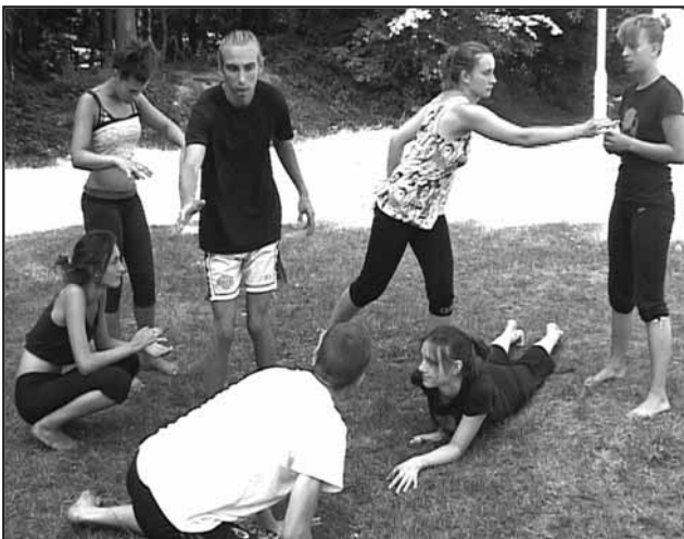
Полазници радионице увежбавају представу

- Краљевачко позориште нама излази у сусрет и сваке недеље овде одржава представе за децу која бораве на планини Гоч, а та сарадња се кроз школе у природи наставила и током лета. Ово је један од начина на који желимо да узвратимо Краљевачком позоришту тако што смо им домаћини у организовању ове представе