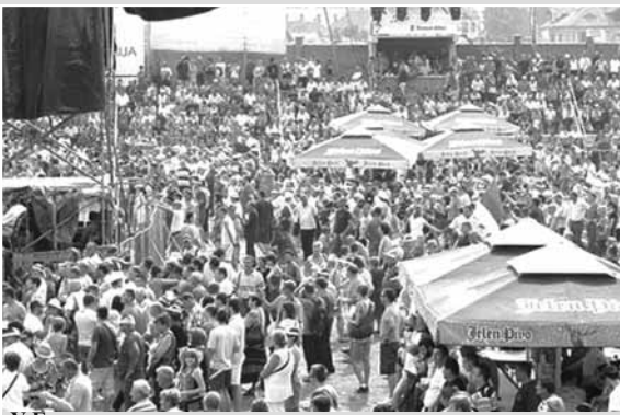
У Гучи се окупио око пола милиона људи са свих континената