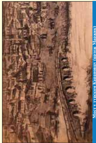
Мост у турском Каранову (према Маржаку)

Овај мост који се гради из правца Скопљанске улице седми је по реду подигнут на Ибру. Неки од претходних су остали само у покуштеним заштитним, другима севања. Елем, запис о првом мосту у турском Каранову оставио је аустријски официр Паул Митесер који је у два наврата (1783. и 1784. године) као ухода обилазио Србију. Записао је да у Каранову постоји веома солидан дрвени мост дуг 150, а широк 6 корака.