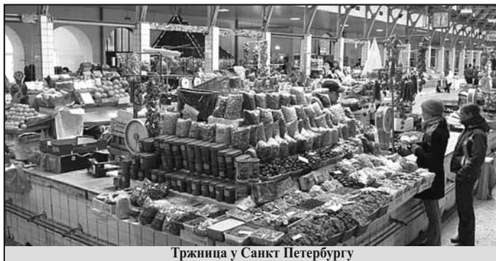
Тржница у Санкт Петербургу