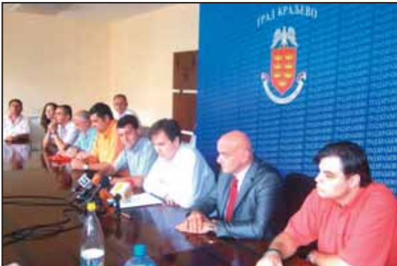
Са конференције за новинаре