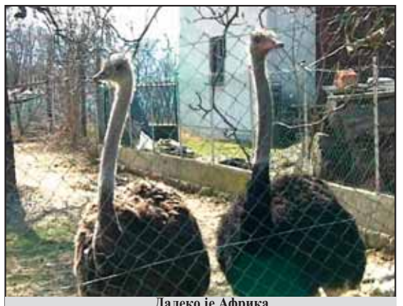
Далеко је Африка

Било како било, тек, у дворишту иза лепе куће шепуре се иза плетене жице нојеви. Највеће птице на свету, како књиге кажу, које