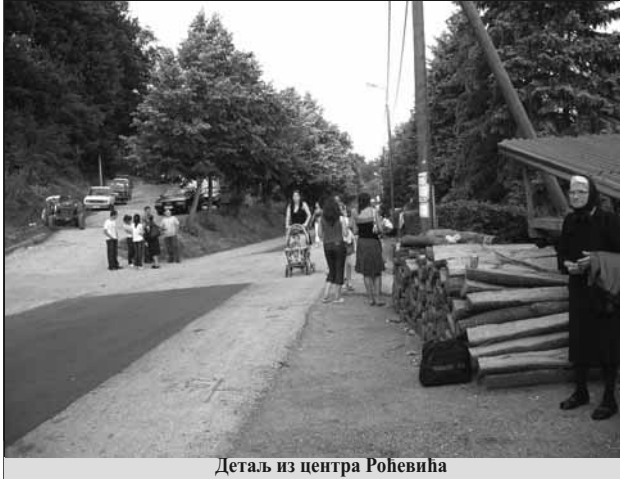
Детаљ из центра Рођевића