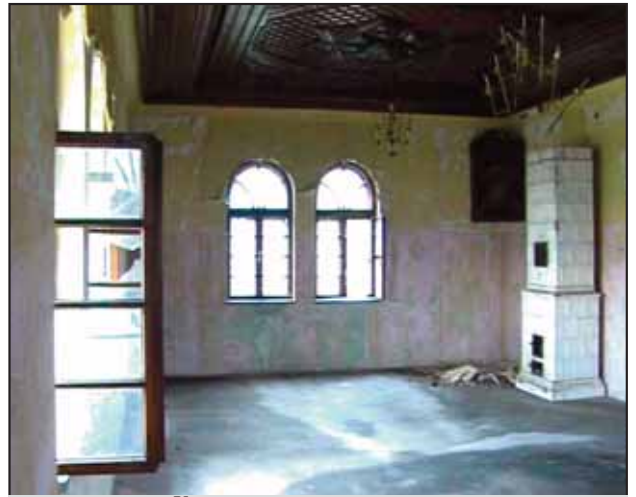
У унутрашњости пустош влада

Самује данас Којића кућа (оно што је остало од ње) а разговори се неки воде да се