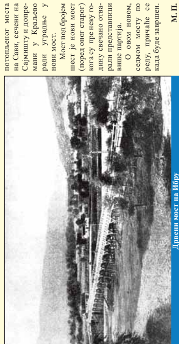
Дрвени мост на Ибру

После коначног ослобођења Каранова од Турака постављени су потпунски мост на месту где је било најпогодније да се по-дигне - педесетак метара узводно од овог сада постојећег моста.