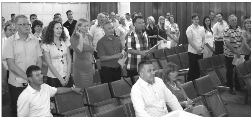
Седница Скупштине града 3. јул 2012

У сваком случају „комотна“ скупштинска већина (преко 40 одборника коалиције Српске напредне странке, Нове Србије, Социјалистичке партије Србије, Партије уједињених пензионера Србије-ПУПС, Јединствене Србије, Демократске странке