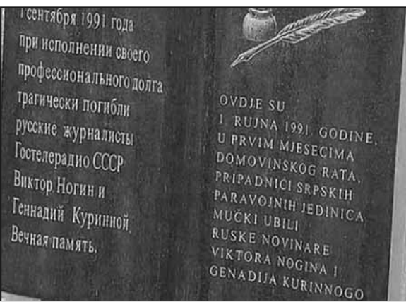
Споменик несталим руским новинарима у Пањанима

На руском натпис гласи: „На овом месту 1. септембра 1991. године, приликом вршења своје професионалне дужности трагично су погинули руски новинари Гостелерадија СССР