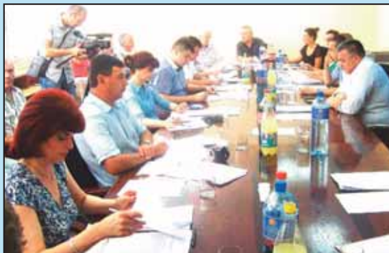
Последња седница Градског већа