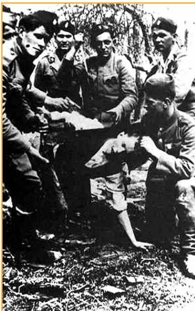
Братоубилачки рат, покренут Српски мученик прије клања

Српски национални устанак од 1941. године, као и пуч од 27. марта, искоришћен је у каснијим ратним годинама, преко оба антифашистичка покрета, као монета за поткусуривање у геополитичкој трговини великих сила и њихових интернационалних идеологија. Широм биолошки угроженог српског националног корпуса, поред рата са нацистима и њиховим сателитима-Хрватима, муслиманима, Мађарима, Бугарима и Албанцима, распламсао се српско-српски грађански рат, вођен у име либерализма и комунизма. Као фактор мобилизације, посебно се од стране југословенских комуниста користио русофилски занос српског народа, јер како је стојало у једном документу „његова вјера у скору побједу братске Русије се не може ничим поколебати”.