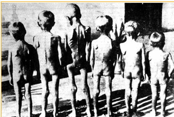
Деца у Јасеновцу

Оваква историјска амнезија постаје схватљивија ако се посматра из перспективе новопроектване ревидиране историјске свести „Уједињене Европе” о Другом светском рату, која у евроунијатским српским круговима има тежину вредносног аксиома. Циник би приметио, да данашњи поборници српске интеграције у Нови светски поредак (New World Order), морају да имају историјско разумевање за интеграцију Балкана у Нови поредак југоисточне Европе (Neuordnung Südosteuropas) из 1941. године. Ипак, кључ за потпуно разуме-