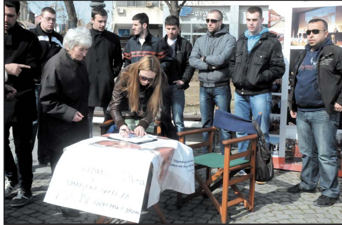
Потписивање петиције за смањење ПДВ-а

Уз ограничавање маржи у промету семена, садног материјала, средстава за заштиту биља и крмних смеси напред-