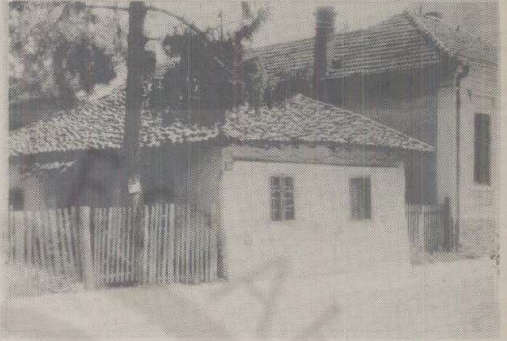
БИВША „КРАЉЕВАЧКА ПИВАРА“ У УЛИЦИ ХЕРОЈА МАРИЧИЋА (ДАНАС ЈЕ ТУ ЗГРАДА „БОЈАДИКСА“) ПРЕКО ПУТА КОЈЕ СУ ЗА ВРЕМЕ НОЋНОГ БОМБАРДОВАЊА 1944. ГОДИНЕ САВЕЗНИЦИ ПОГОДИЛИ СКЛОНИШТЕ И ТОМ ПРИЛИКОМ ИЗГИНУЛО 20 КРАЉЕВЧАНА

Сазнавши да су се у јужном делу Италије искрцали савезници, њиховој радости није било краја, а врло брзо изнад краљевачког неба почели су да прелећу авиони. Летели су из база у Италији бомбардери у ескадрилама, по 12 у свакој, праћени малим авионима-ловцима. Немачке сирене унапред су оглашавале њихов наилазак, као упозорење на опасност од бомбардовања. Немци,