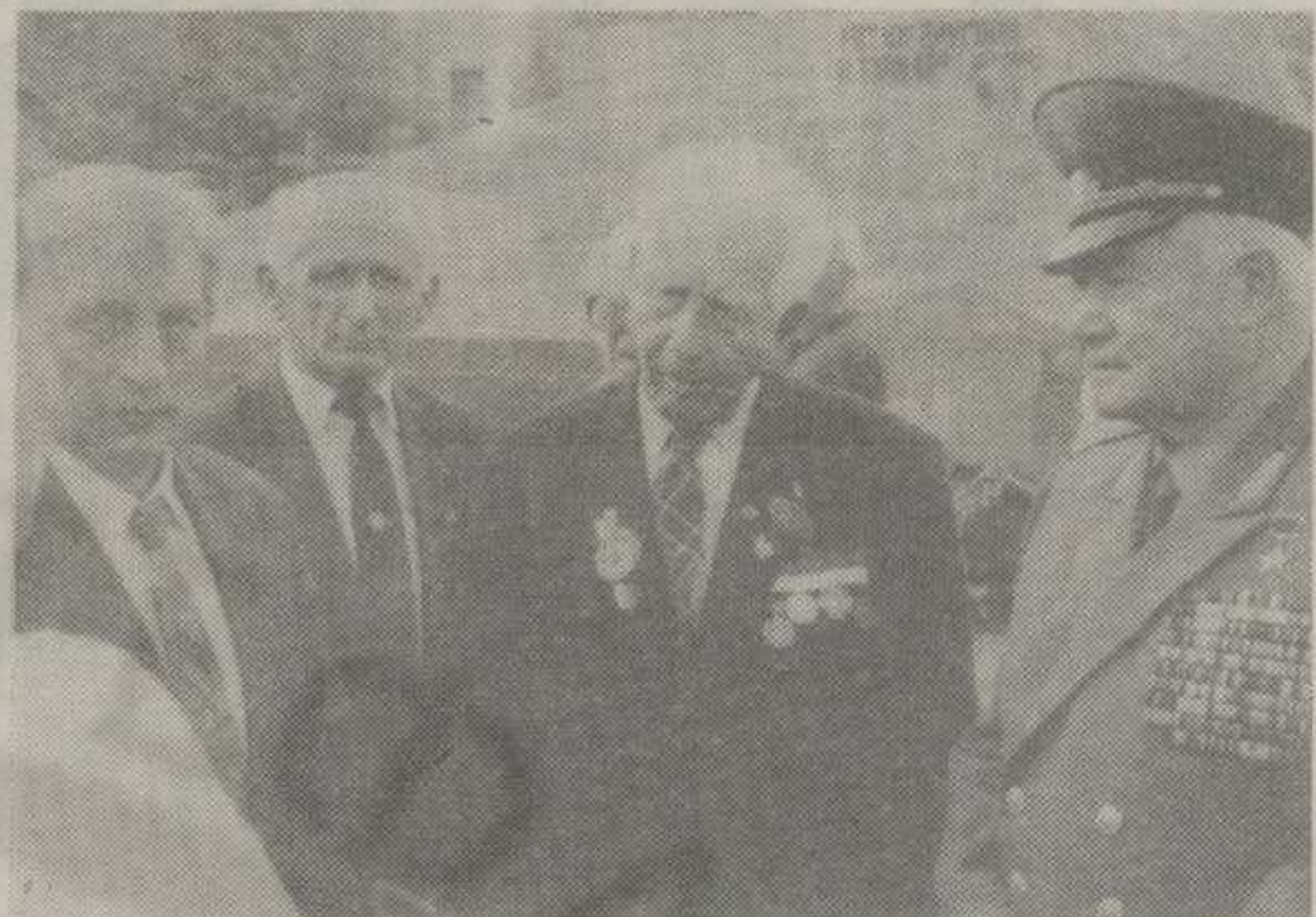
ПРОДУБЉИВАЊЕ И ЈАЧАЊЕ МЕЂУСОБНЕ САРАДЊЕ: ДЕТАЉ СА ПОСЕТЕ РАТНИХ ВЕТЕРАНА КРАЉЕВОУ

КРАЉЕВО ПОСЕТИЛИ РУСКИ И СРПСКИ РАТНИ ВЕТЕРАНИ