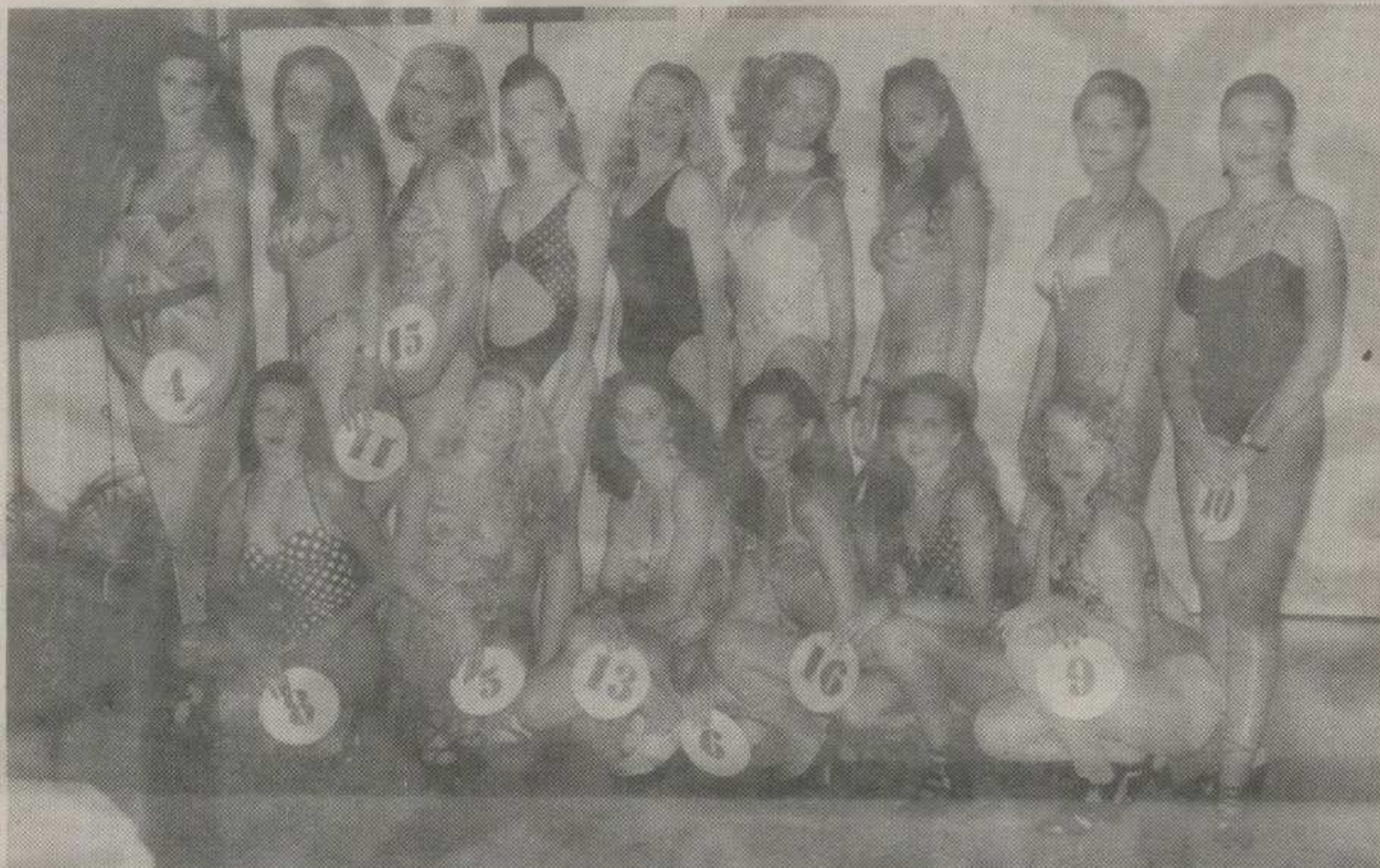
ПРЕД «ВЕЛИКО ФИНАЛЕ»: КАНДИДАТКИЊЕ У ОЧЕКИВАЊУ НАЈЗНАЧАЈНИЈЕ ОДЛУКЕ — КО ЋЕ БИТИ ОВОГОДИШЊА МИС КРАЉЕВА