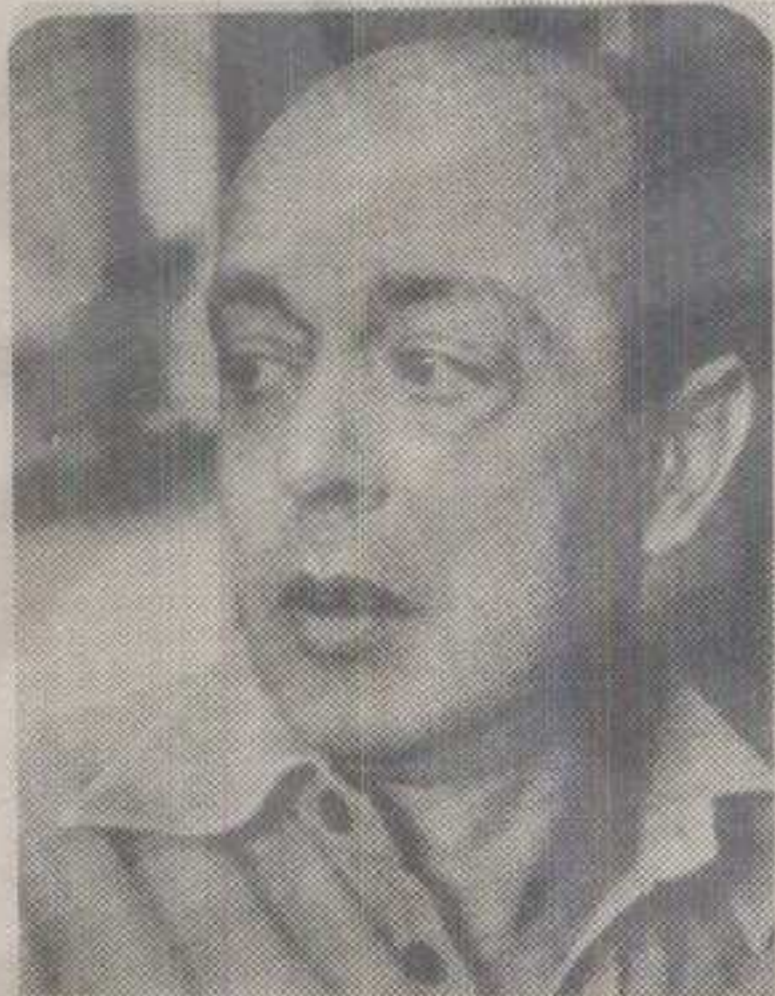
ИВАН В. ЛАЛИЋ

кић. Смрћу песника његово дело је добило свој дефинитивни печат. Говорећи о месту и значају Лалићевог песничког дела у сав-