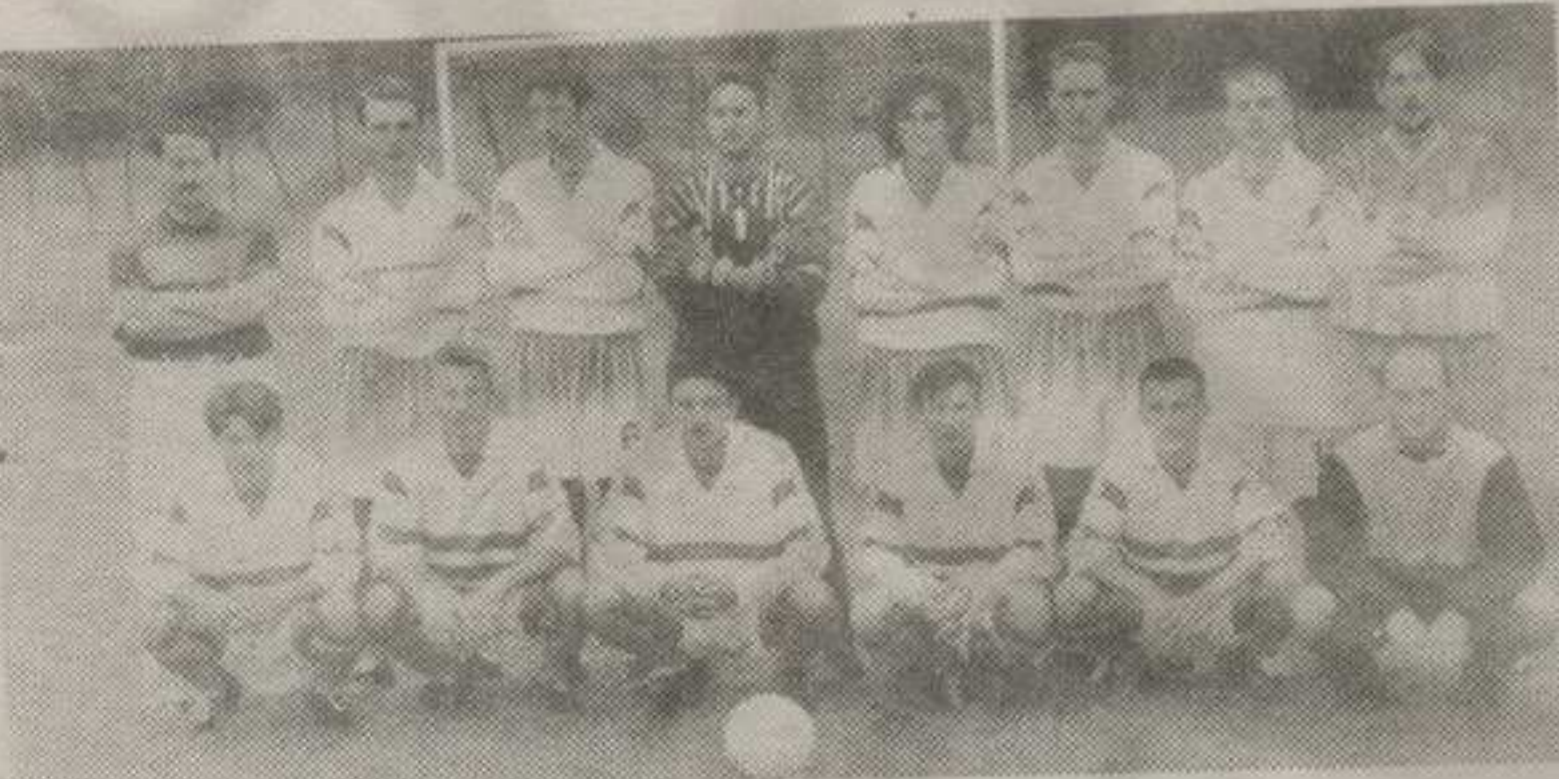
ФУДБАЛЕРИ КРАЉЕВО-ХАЈДУК ПРЕД ПОЧЕТАК МЕЧА У КРАГУЈЕВЦУ