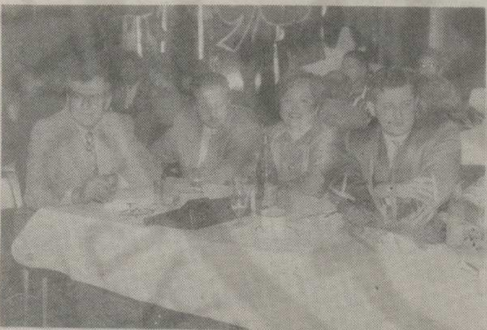
ТЕЖАК ИСПИТ: ЖИРИ ЗА ИЗБОР МИС КРАЉЕВА '96 ПРЕД ДОНОШЕЊЕ КОНАЧНЕ ОЦЕНЕ